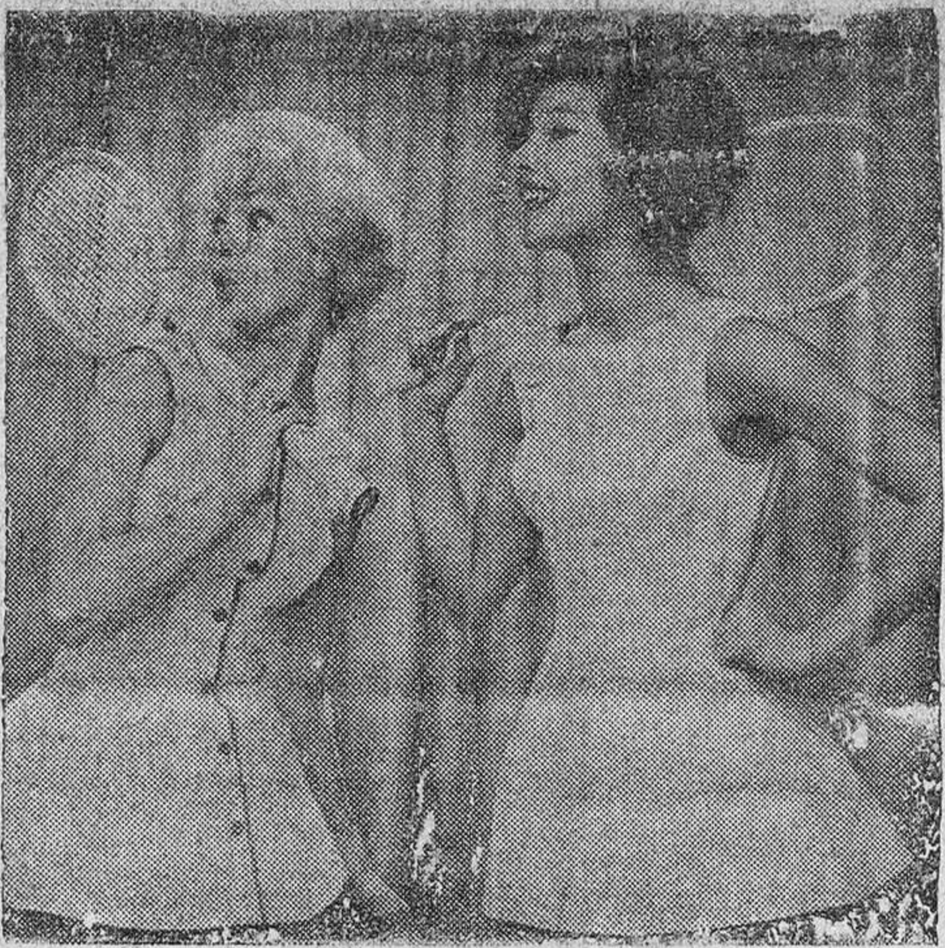
He aquí un par de trajes de tenis para vestirlos una o dos veces tan sólo, y tirarlos después. Mas no hay tanto desparpajo como cabría creer, pues los trajes son de papel, y cada uno de ellos cuesta unos quince chelines.

Para llevarlo una o dos veces y tirarlo después