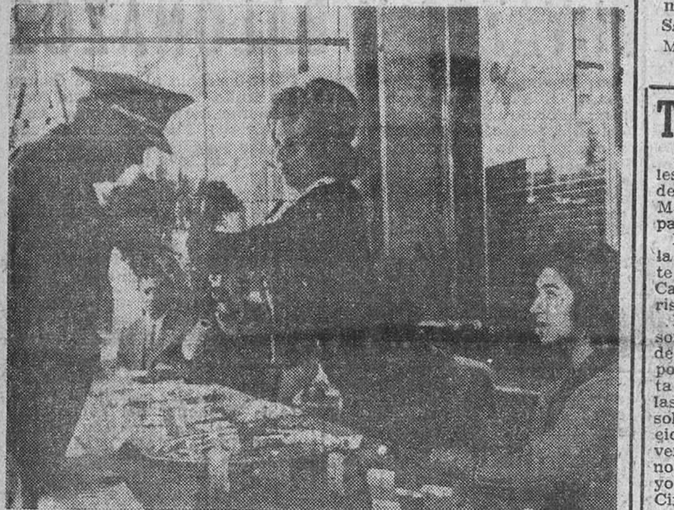
Madrid.—La Duquesa de Alba impone una insignia de la cuestación pública organizada por la Asociación Española de la Lucha contra el Cáncer al general Ríos Capapé.

La mesa presidida por la marquesa de Villaverde obtuvo la recaudación más cuantiosa