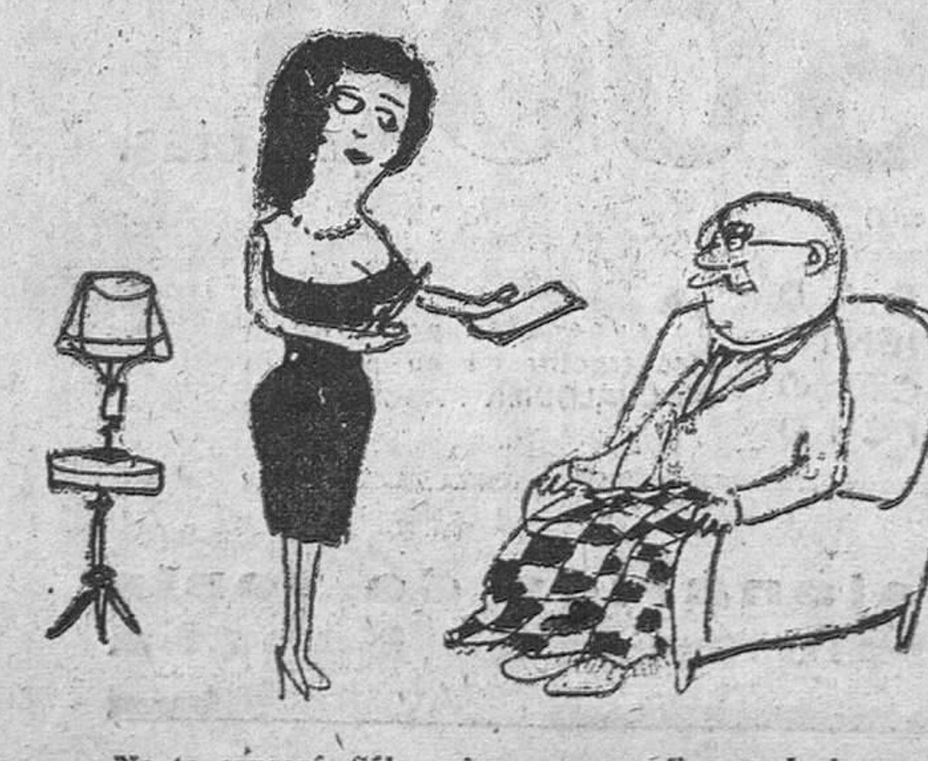
No te cansaré, sólo quiero que me firmes el cheque.