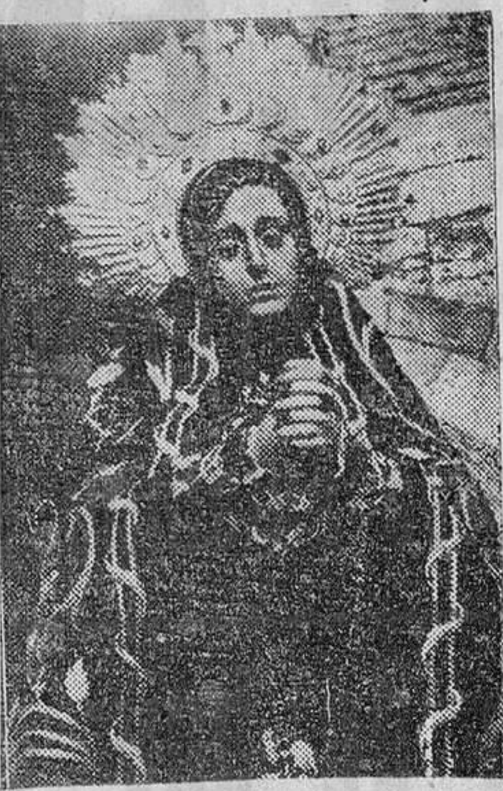
Imagen de la Soledad, también destruida en el siniestro.

quisición de sus nuevos «pasos». Lo fácil es que su ejecución caiga en manos de extranjeros de fama, cuyo resultado se quede en eso: en fama, ya sea ésta justa o preparada, y el arte, como es natural, brillará tal vez, por su ausencia. De más le hubiera servido a Toro haber convocado antes ese concurso entre los zamoranos, sometiéndolos de ese modo a prueba, con lo cual no perdía nada y acaso, o sin duda, los toresanos hubieran ganado mucho, porque la gente joven rinde más, y lo que no debe contar en estos casos, pero que en iguales circunstancias tampoco debe olvidarse, hasta se hubieran ahorrado dinero, sin menoscabo de conseguir verdaderas obras de arte, que a veces aun pagándolas por tales escasamente cumplen lo más elemental. Es lástima que tan excelentes ocasiones se dejen marchar tan insensatamente para acabar buscando, con idéntico sentido, las consabidas y desagradables justificaciones, que siempre son, como suele decirse, cartas de mal pagador. Claro está que todo esto no pasa de ser un comentario, aunque lo estimamos de la más honrada y noble trascendencia. Es