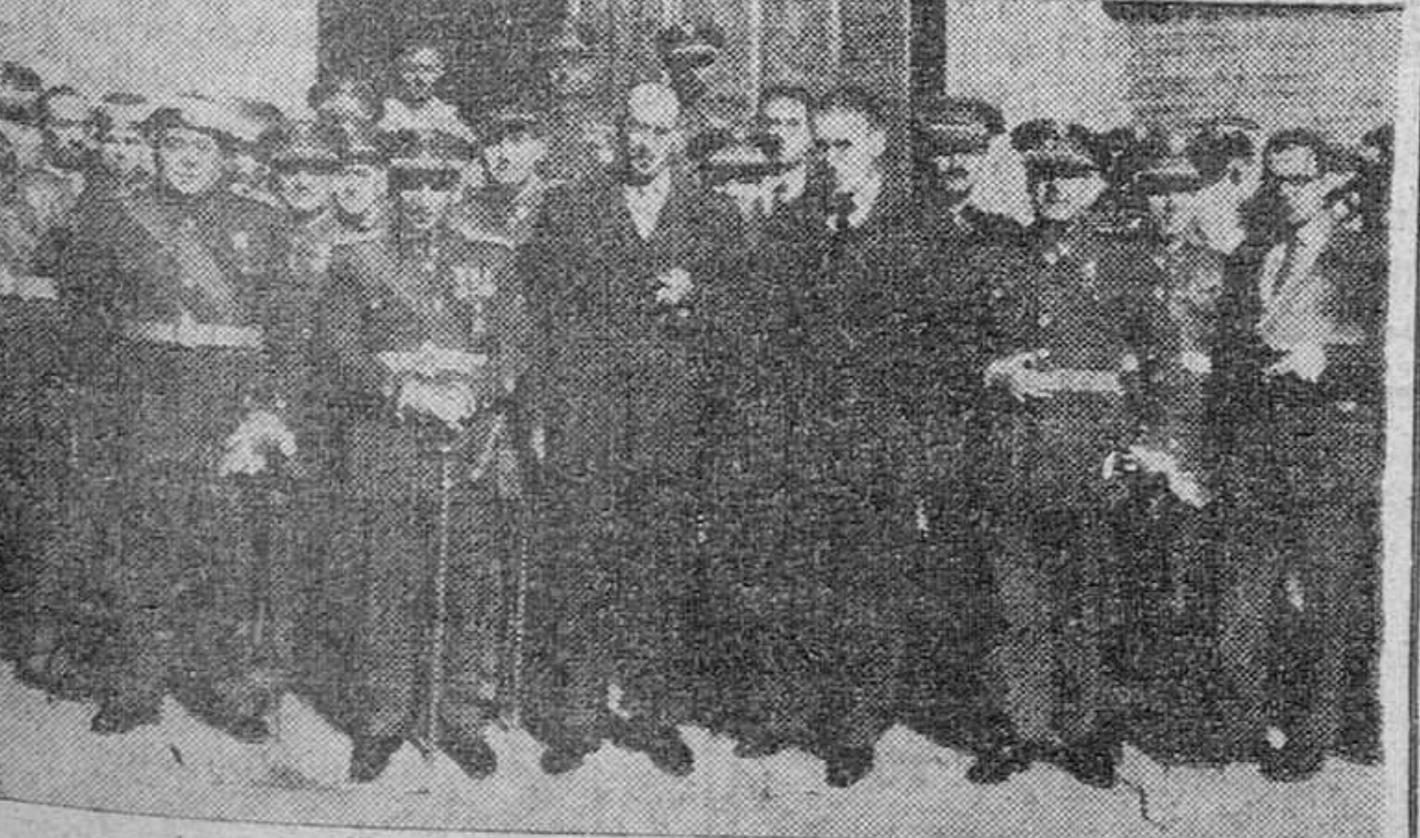
Autoridades y mutilados, después de la misa celebrada en honor del Arcángel San Rafael. (INFORMACION EN CUARTA PAGINA)