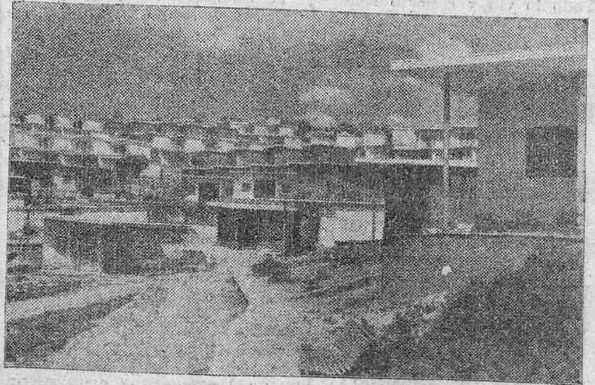
La Ciudad Residencial de Tarragona visitada esta mañana por el Caudillo.