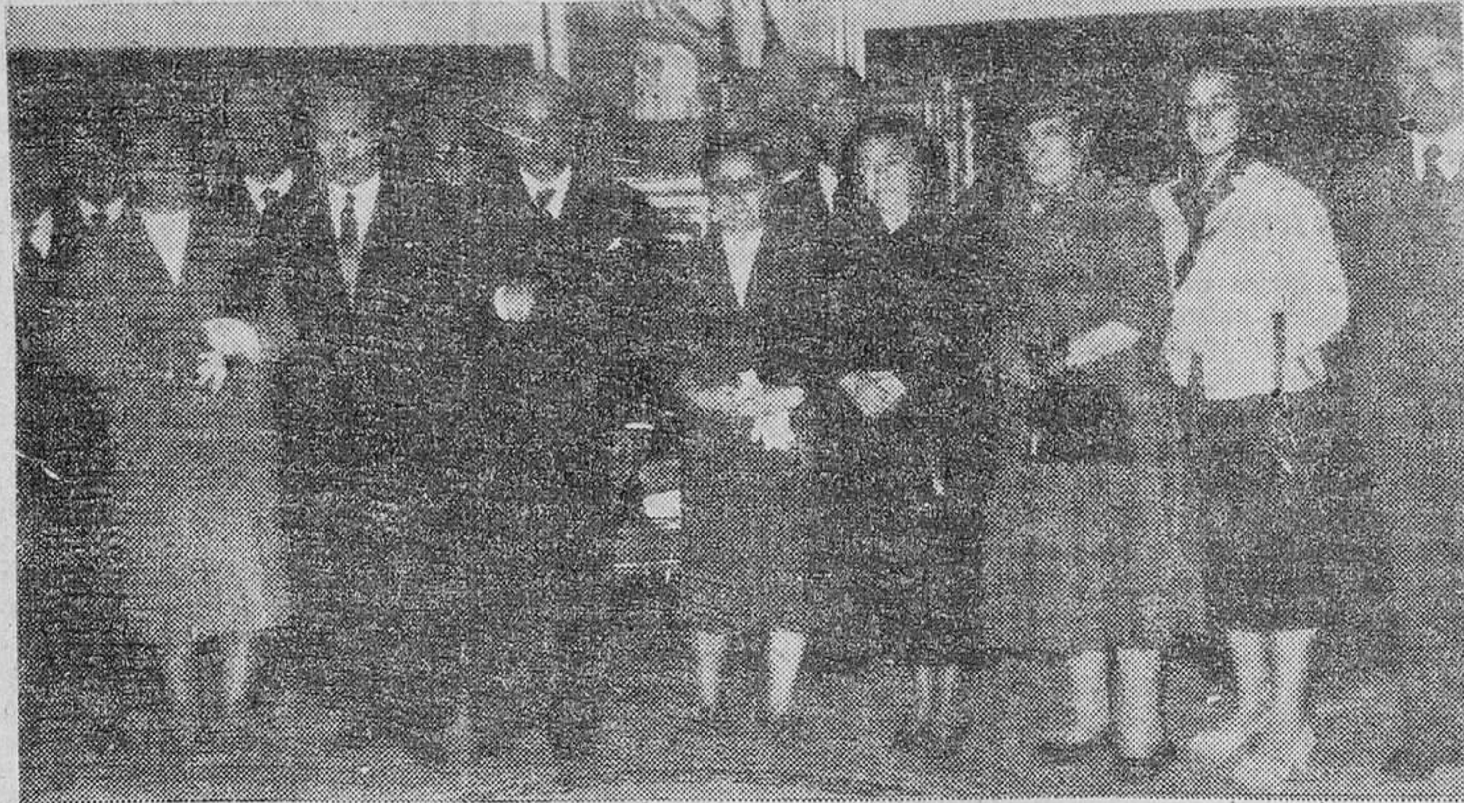
El Consejo Provincial del S. E. M., con el señor Gobernador Civil, durante la audiencia celebrada en la tarde de ayer. (Foto Juanes).

Previamente había celebrado una reunión para tratar de interesantes cuestiones