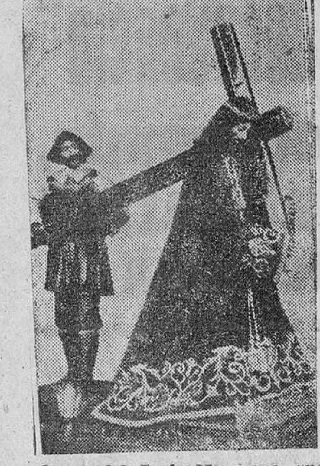
Grupo del Jesús Nazareno, que también resultó destruido en el incendio de Santa Catalina.

posible que a quienes compete la resolución de estos problemas no les padezca así, bien en justicia o bien por comodidad. Pero de cualquier forma que sea, los hechos son experiencia, y la experiencia, hoy por hoy, no nos está dejando nada que desear. ¡Y eso es lo malo!