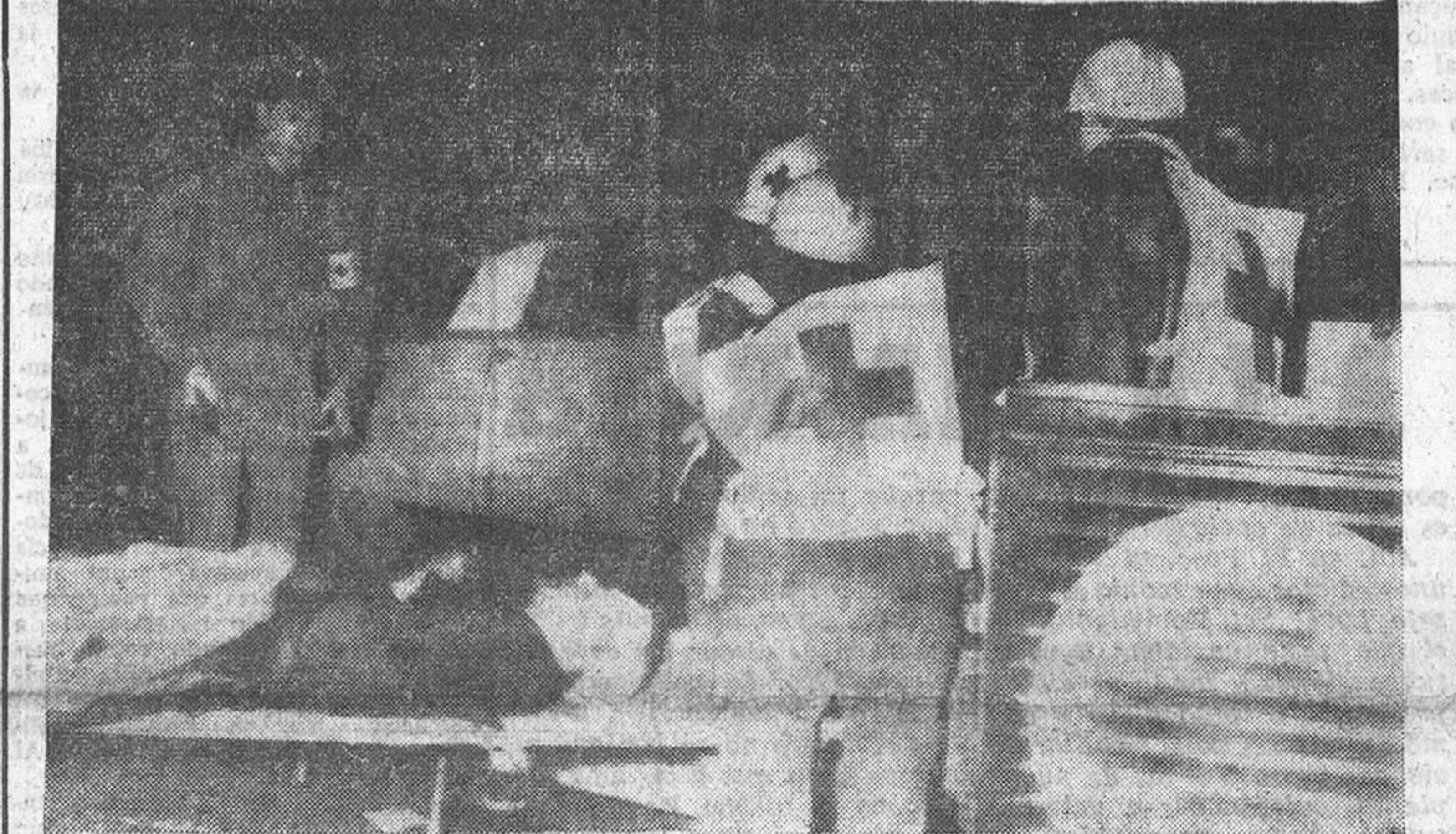
PARIS.—Ocho muertos y centenares de heridos es el balance trágico de las manifestaciones anti-OAS ocurridas cerca de la Bastilla, en París. En la telefoto, la Cruz Roja francesa prestando auxilios a un herido grave, que aparece tendido en una camilla.

Paris, 9.—Organizaciones laborales han organizado hoy una huelga, de las 15 a las 16 horas, como protesta contra la acción de la Policía en una manifestación, que tuvo lugar anoche, en la que perdieron la vida ocho personas. También han organizado una huelga general durante el entierro de las víctimas.