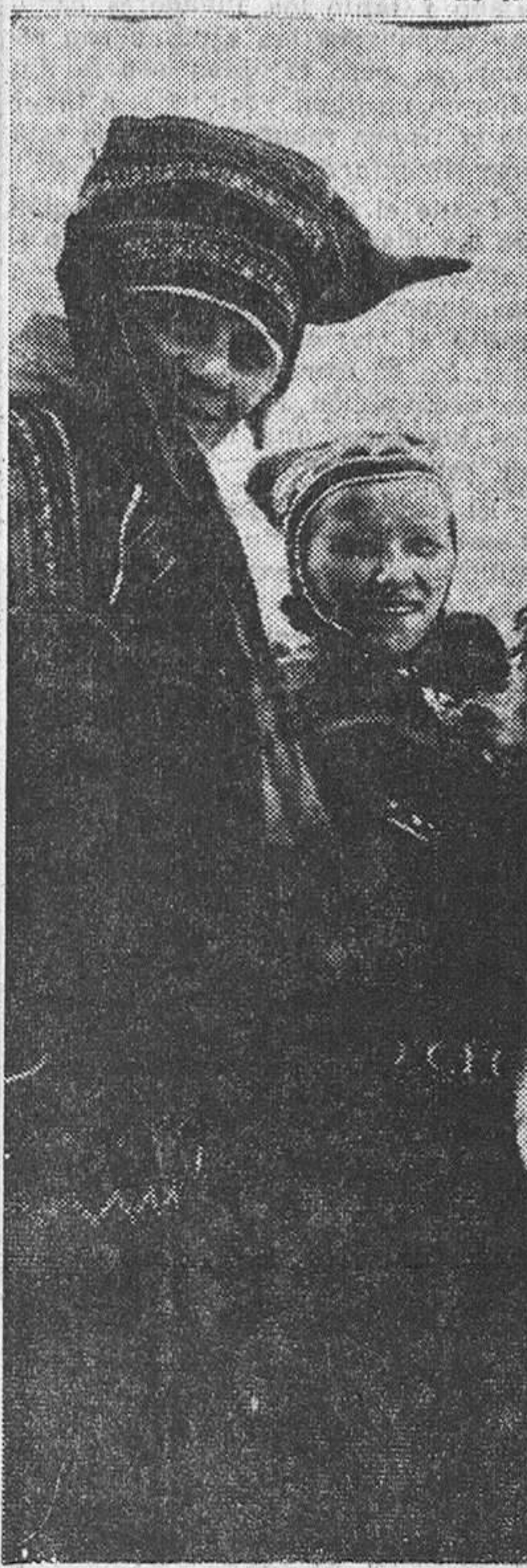
LAPONES EN ROVANIEMI.—De vez en cuando los lapones nómadas bajan hasta Rovaniemi. He aquí una familia de ellos, con sus atuendos de gala, para celebrar las fiestas navideñas.

polares, y gracias a la amabilidad del capitán, tuve ocasión de presenciar una de las visiones más bellas que había tenido en mi vida. A mis pies, y separados sólo por quinientos metros, tenía la capital de Laponia, una creación del hombre que por su urbanización racional y geométrica parecía un grupo de rectángulos de nieve iluminados en aristas por destellos de los más variados matices. Los colores de la