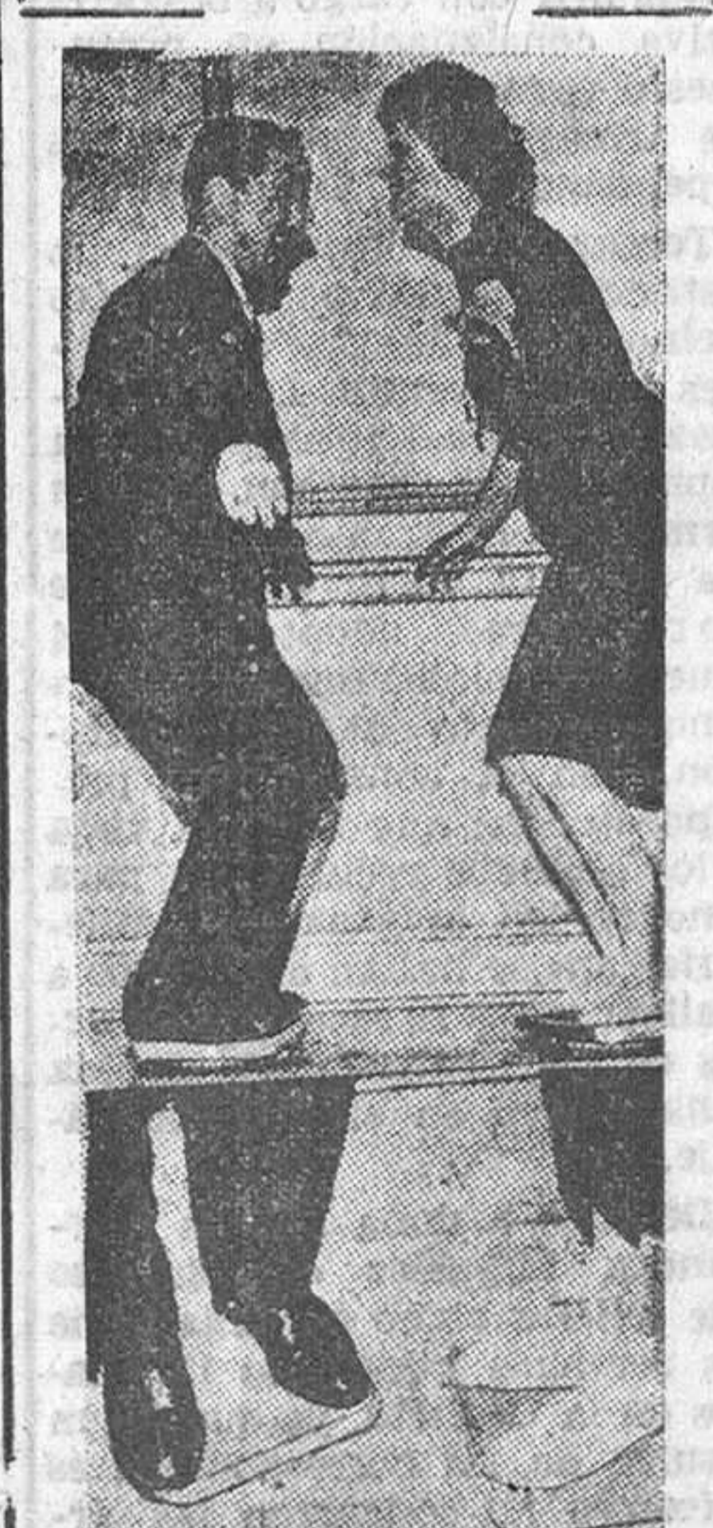
Con el «twist», la máquina para bailar el «twist». Habiendo nacido esta danza en Norteamérica, era de esperar su automatización. Es muy sencilla la máquina en cuestión. Como puede verse en la foto inferior, se trata de una peana, parecida a la de las máquinas caseras, montada sobre un soporte, que permite a la plataforma desplazarse en todas direcciones. De este modo pueden aprenderse las contorsiones indispensables a un bailarín de «twist» que no quiera perder la figura.