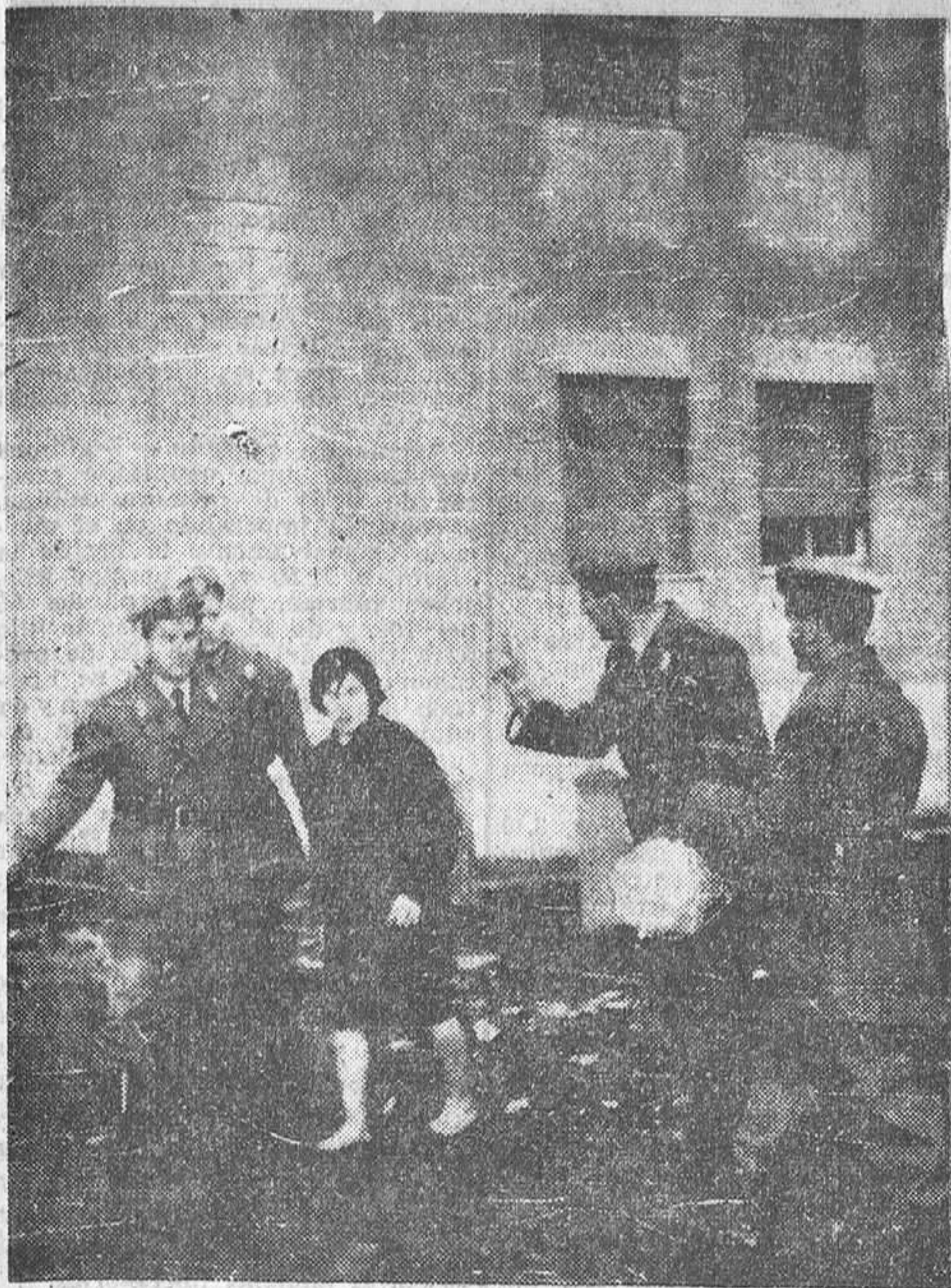
ROMA (Italia).—He aquí una escena de los incidentes ocurridos en el distrito romano de San Basilio, cuando un numeroso grupo de gente sin vivienda ocuparon un grupo de nuevas viviendas asignadas por el Gobierno italiano a empleados del Estado.