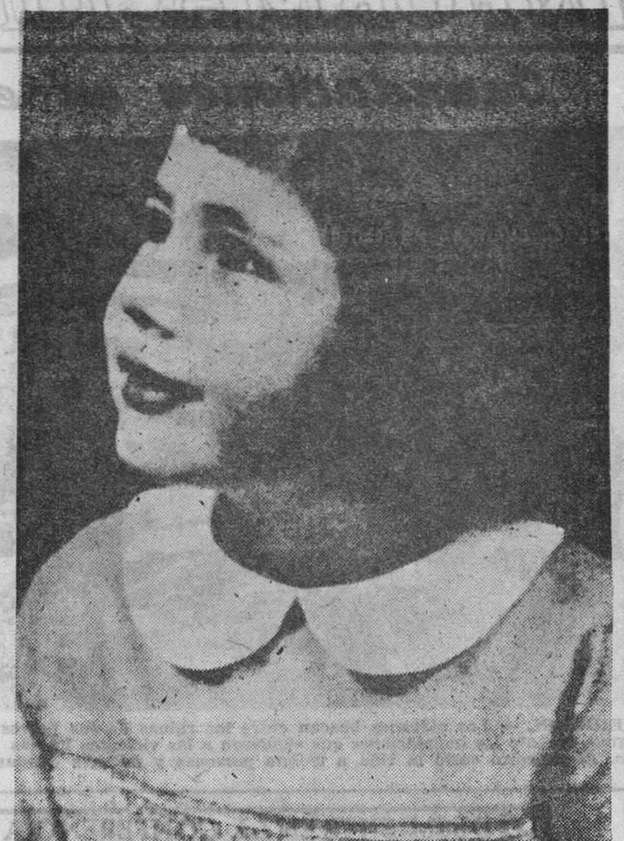
Soraya, en Berlín; fotografía tomada el 12 de febrero de 1935.

Una de las primeras escenas de mi infancia que dejaron en mí un recuerdo preciso fue una excursión a caballo a través del desierto al sur de Ispahan. Tenía apenas seis años, pero sabía sostenerme firmemente en mi silla y galopaba al lado de mi padre, que montaba un brioso potrillo árabe.