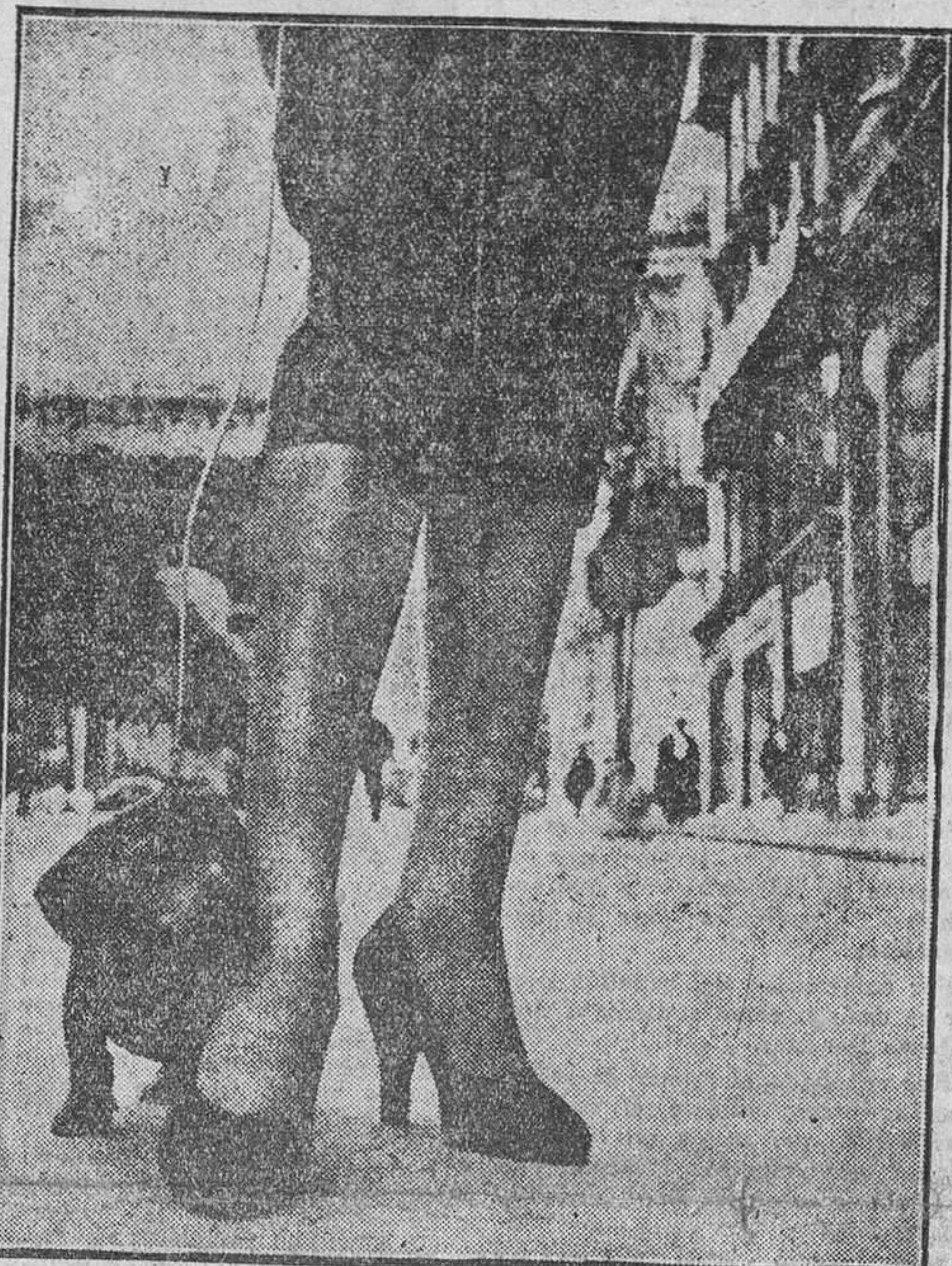
La polémica, en torno a la falda corta o a la falda larga está a punto de terminar. La falda más corta ha triunfado. He aquí la línea 1954, lanzada por una revista francesa.