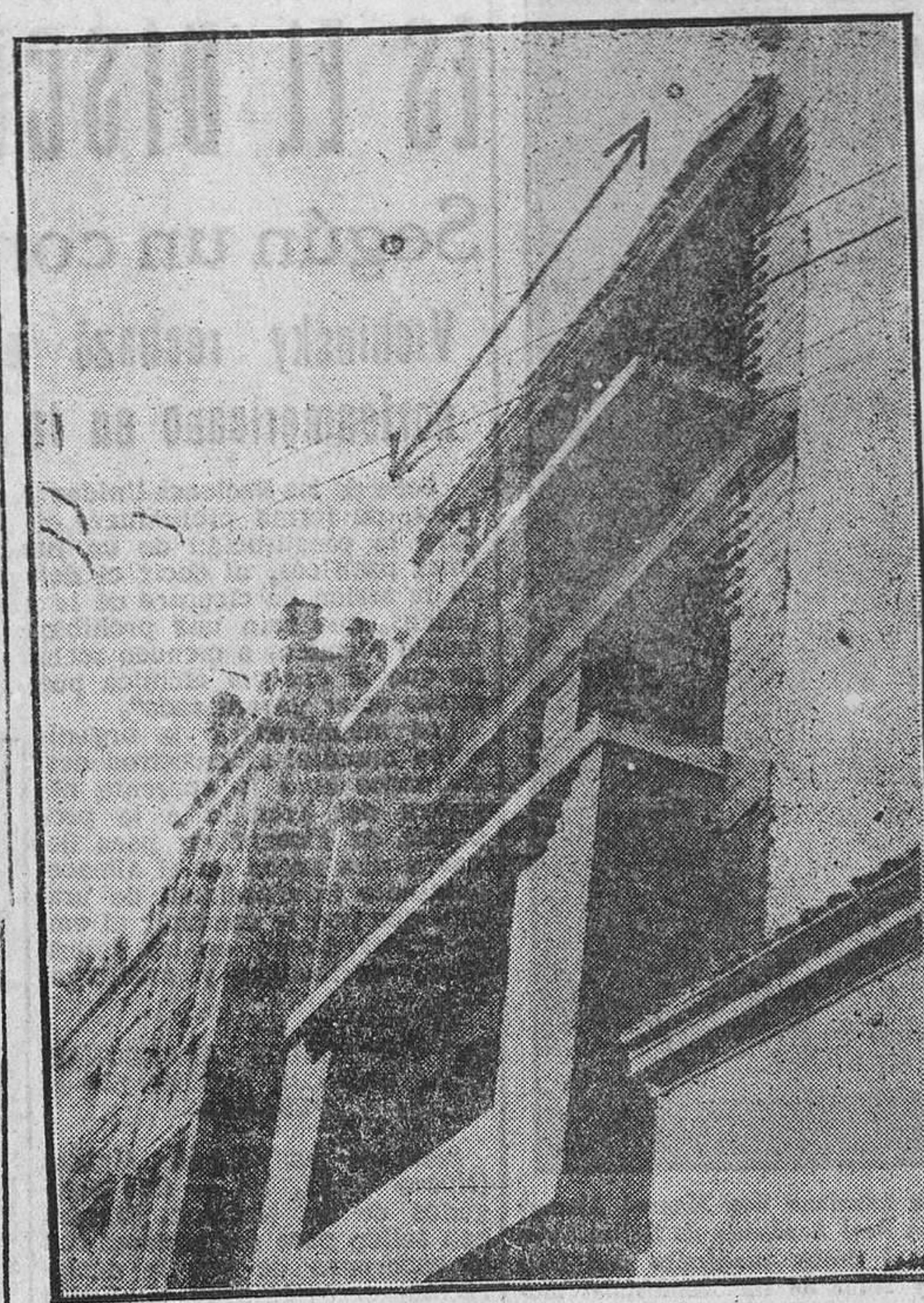
La flecha indica perfectamente la parte de cornisa desprendida que ocasionó la muerte a una criatura de veinte meses de edad.

El suceso ocurrió en la calle de Santa Clara cuando mayor era el número de transeúntes