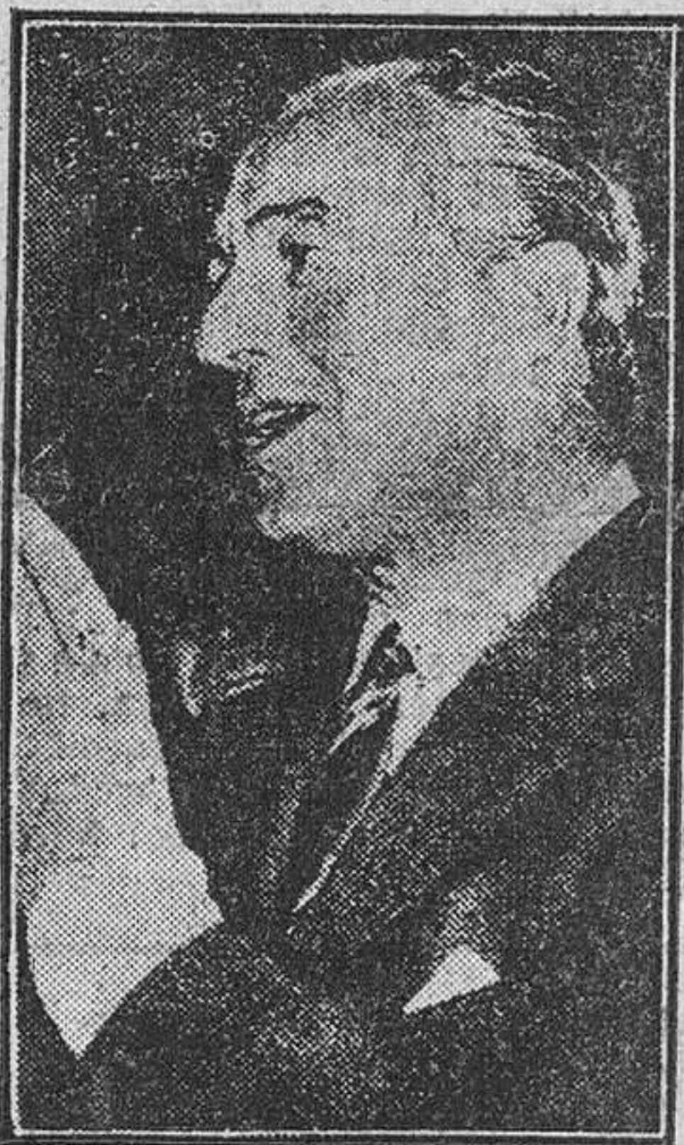
El magnífico director del cine italiano ha llegado a Madrid con motivo del estreno de una de sus películas.