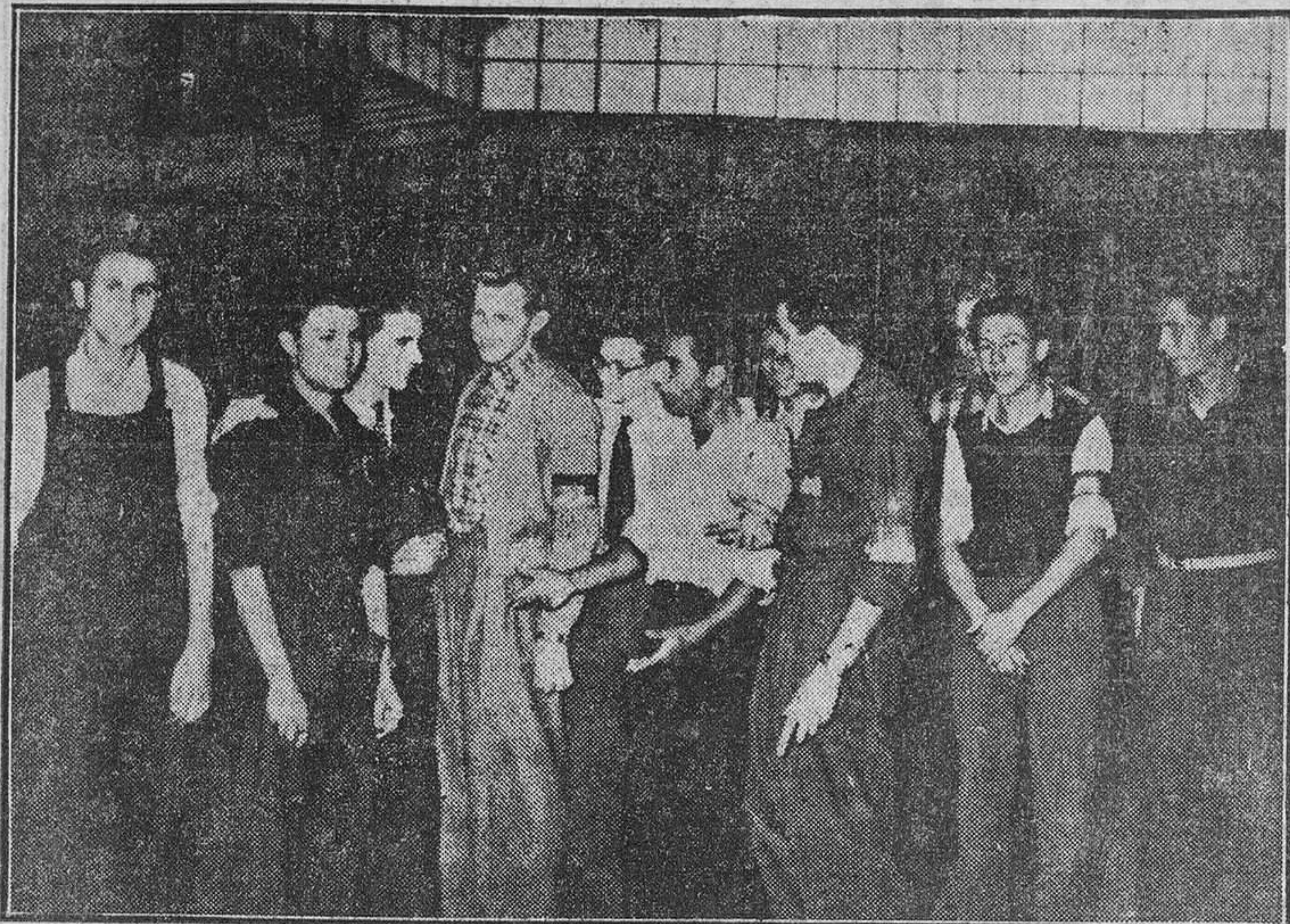
En el Colegio Sindical "Virgen de la Paloma" se inaugura el Campeonato Internacional de Aprendizices del Frente de Juventudes, en el que toman parte representantes de seis países. Representantes de los países participantes, con sus compañeros españoles, a su llegada a la Institución para comenzar el Concurso.