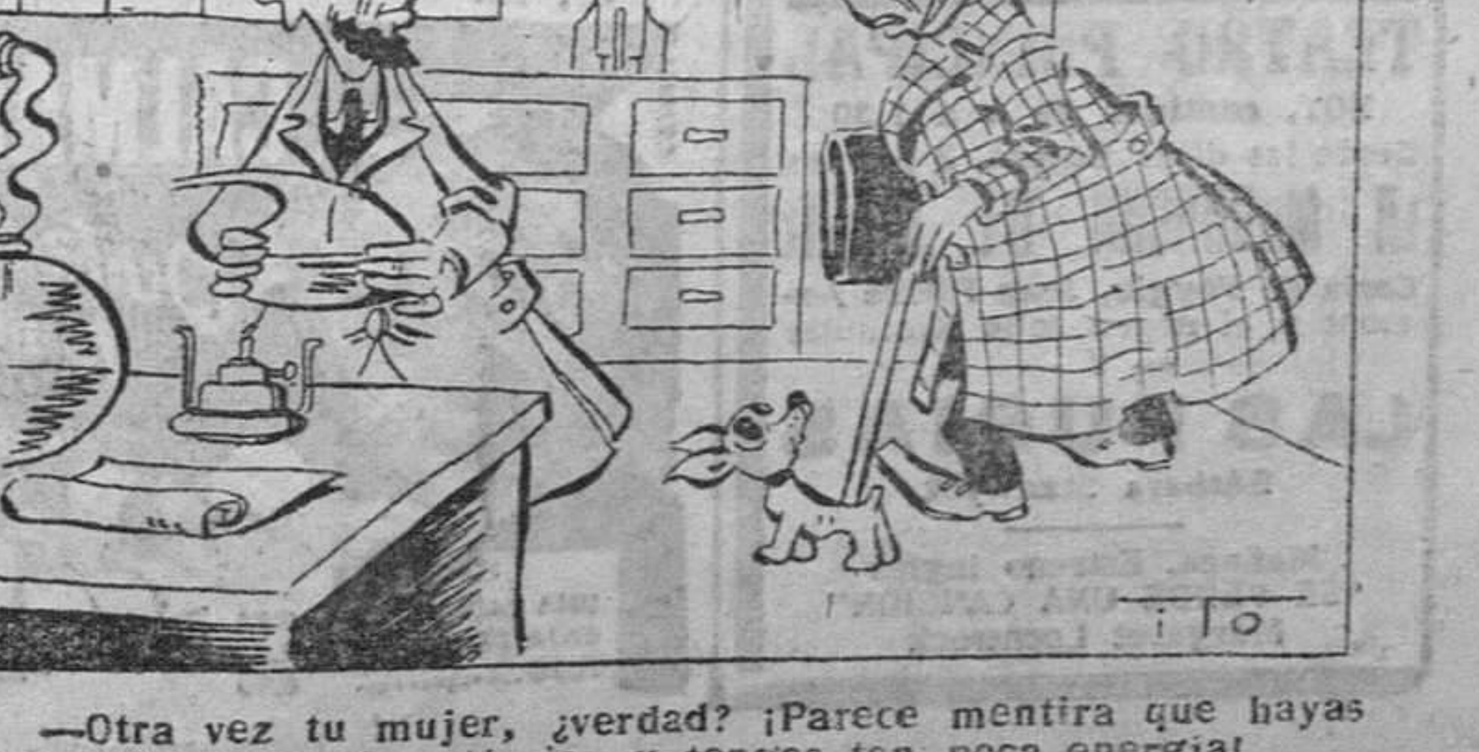
—Otra vez tu mujer, ¿verdad? ¡Parece mentira que hayas inventado la bomba atómica y tengas tan poca energía!