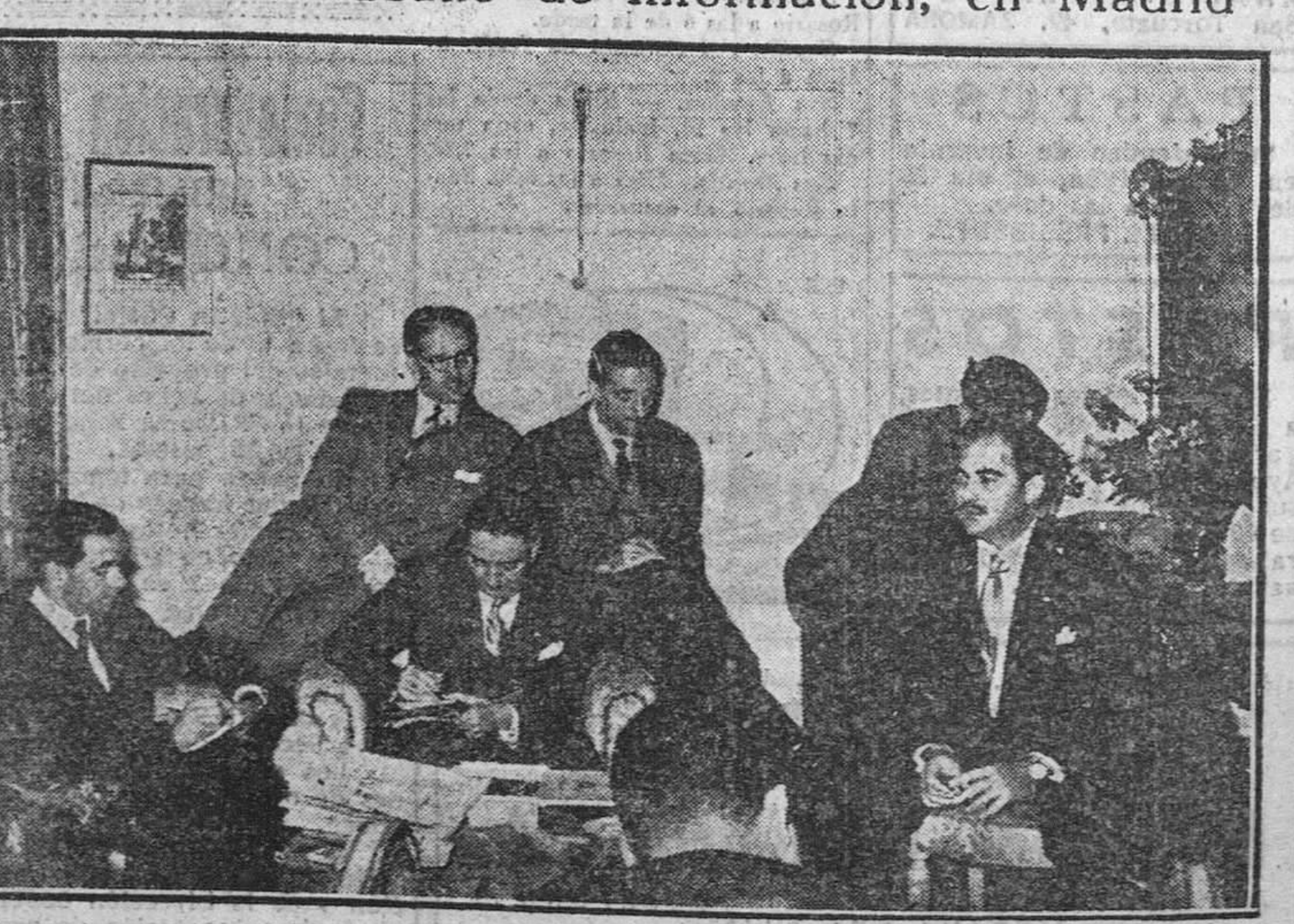
El ministro de Información de Cuba, don Ernesto de la Fe, que visita España, recibe a los periodistas, a los que hizo importantes declaraciones.