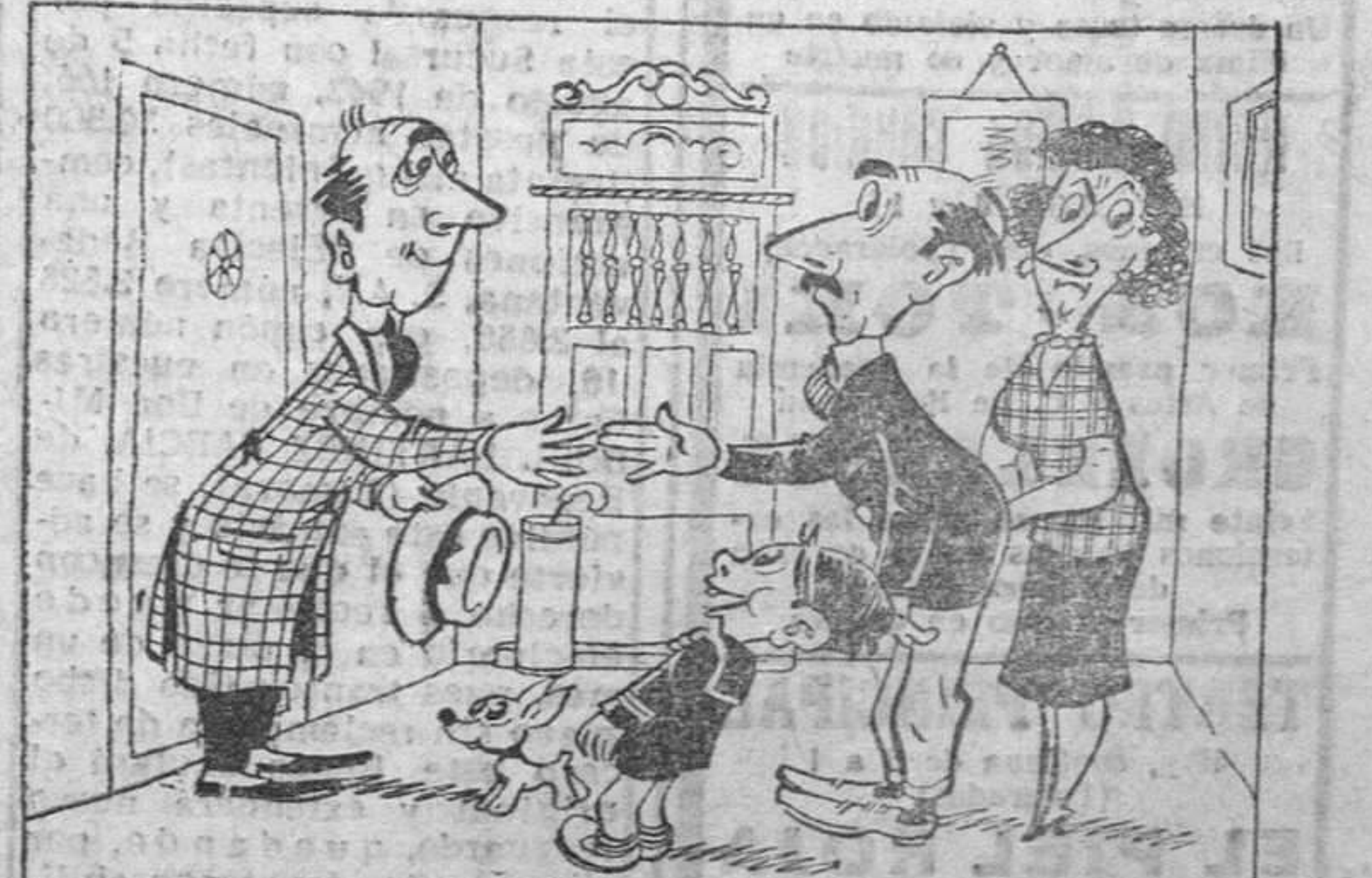
Invitado: —Encantado; es el día que mejor he comido. El niño: —¡Y nosotros también!