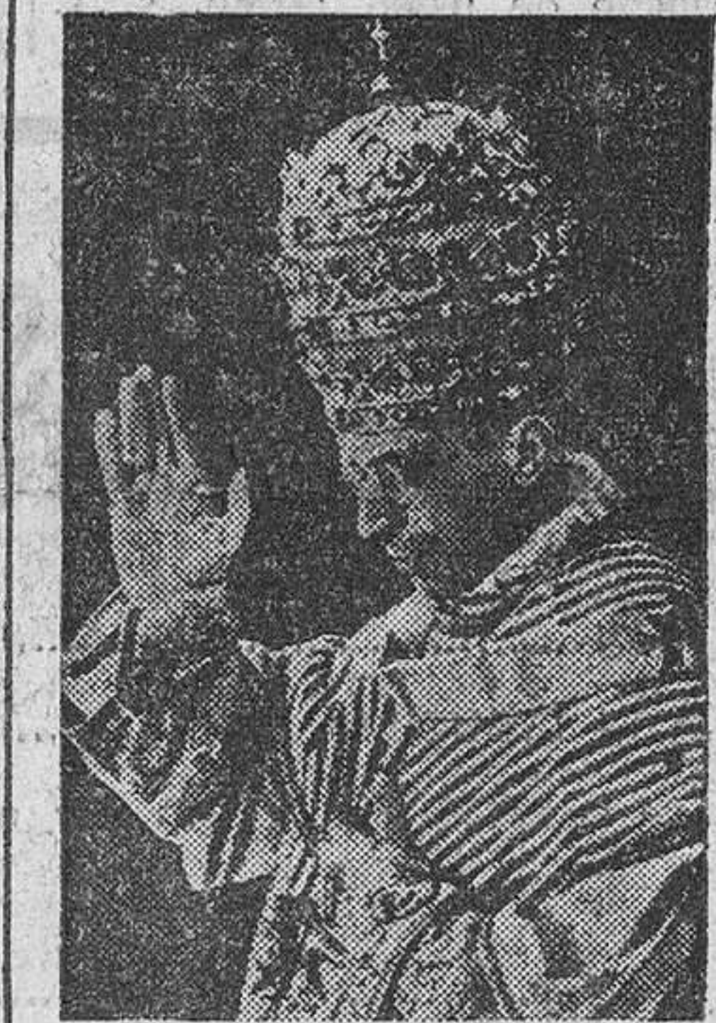
SU SANTIDAD PIO XII

Bilbao, 15.—Con una memorable jornada de fe y adhesión a la Iglesia ha sido clausurada la Santa Misión general del Nervión.