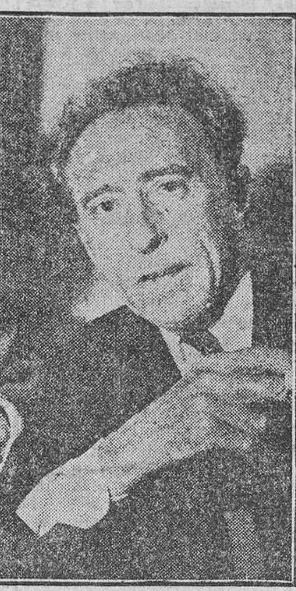
El ilustre escritor francés Jean Cocteau, que pasa unos días en Madrid, conversa con nuestro colaborador César González-Ruano.