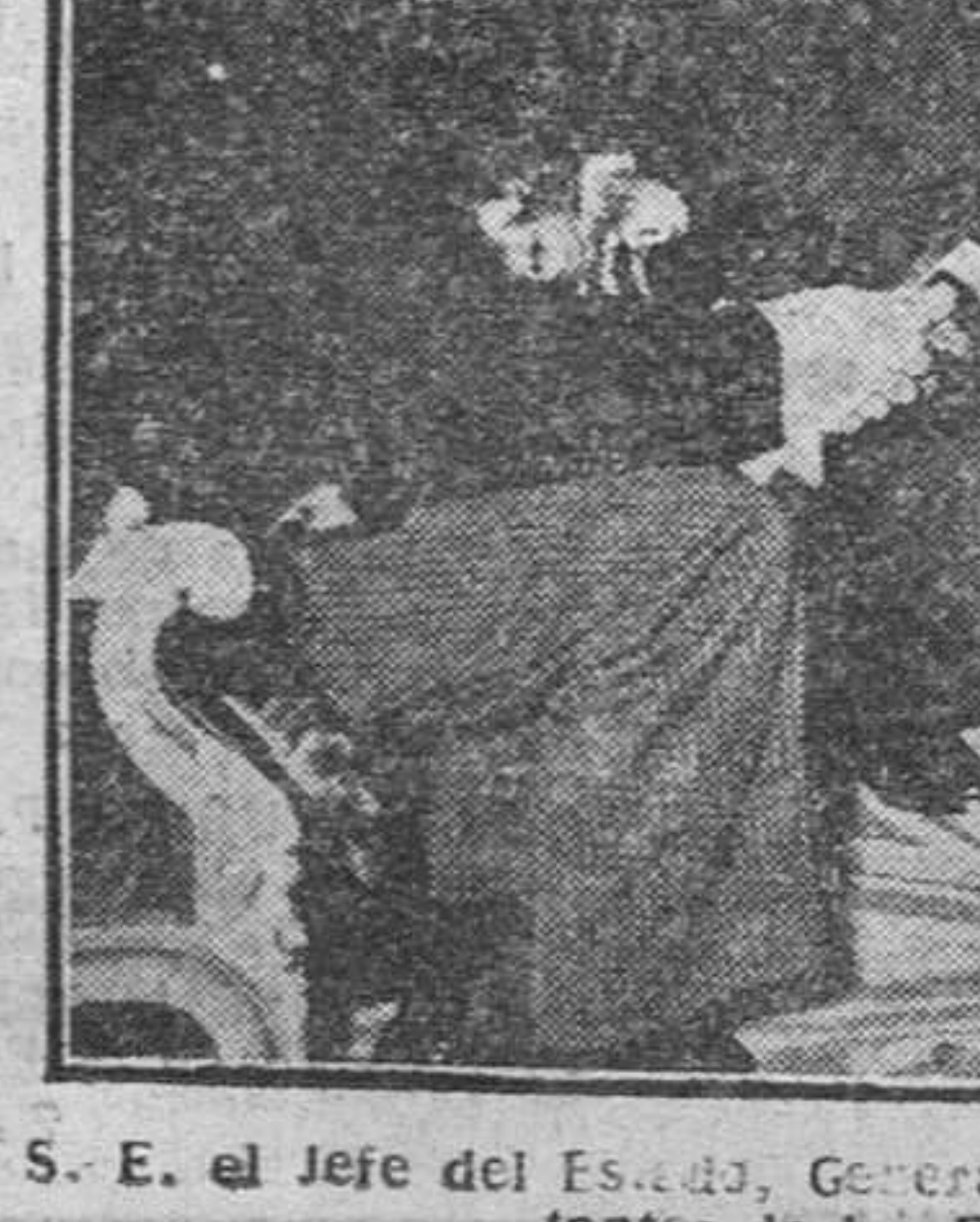
S. E. el Jefe del Estado, Generalísimo Franco, recibe al presidente de la Cámara de Representantes de los Estados Unidos, mister W. Martin.

La construcción y aplicación de los edificios destinados a enseñanza primaria se realizarán con arreglo a los siguientes sistemas: Ejecución por el Ministerio de Educación Nacional; ejecución mediante convenios especiales del Estado con las entidades públicas y ejecución intervenida por las Juntas provinciales de construcciones escolares. El Estado podrá concertar convenios con los Municipios que sean capitales de provincia o con los mayores de doscientos mil habitantes para realizar planes de conjunto de construcciones escolares en la localidad, siempre dentro de los créditos presupuestarios.