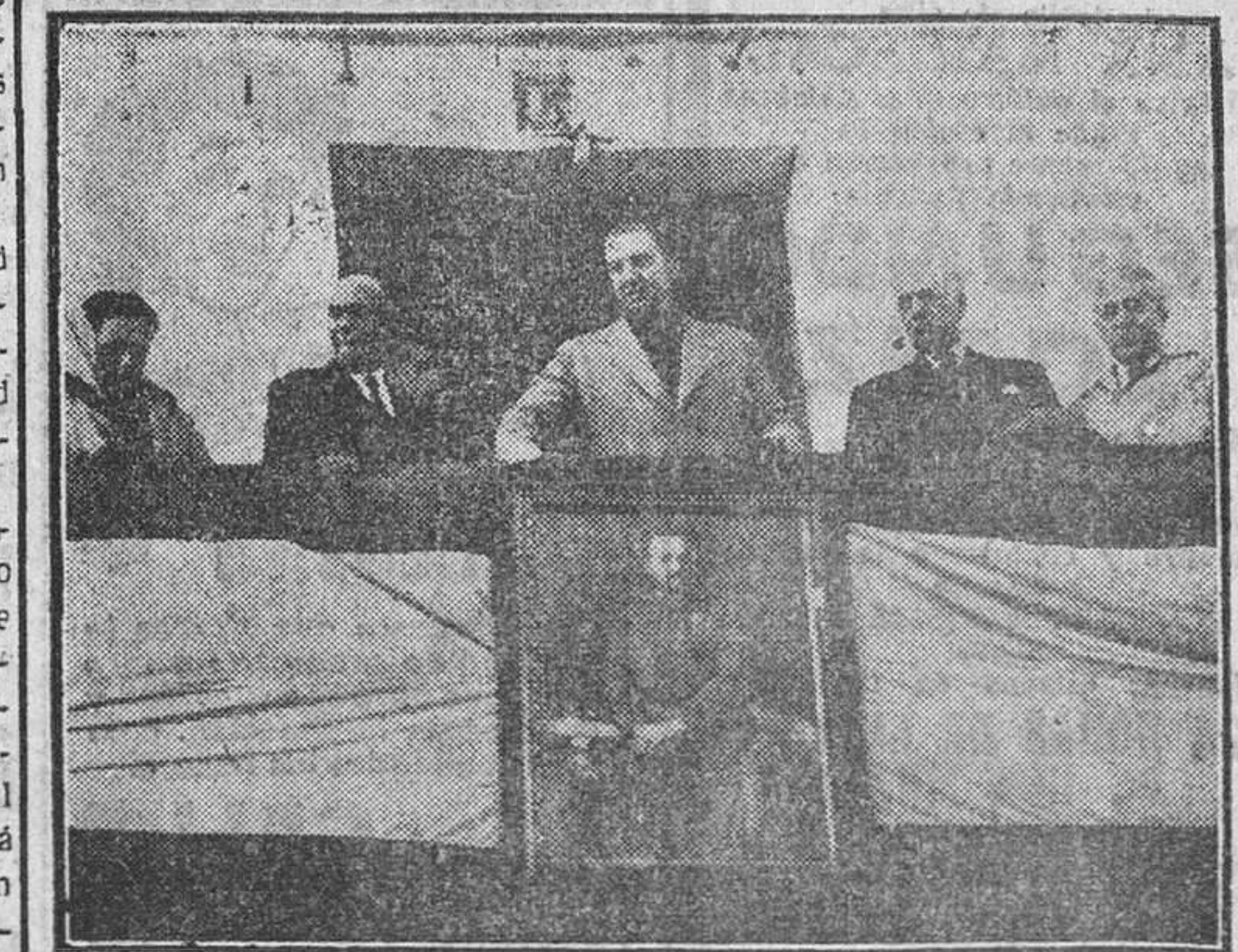
Nuestra primera autoridad dirige la palabra al vecindario de El Perdigón.

El pueblo necesita con urgencia un grupo escolar