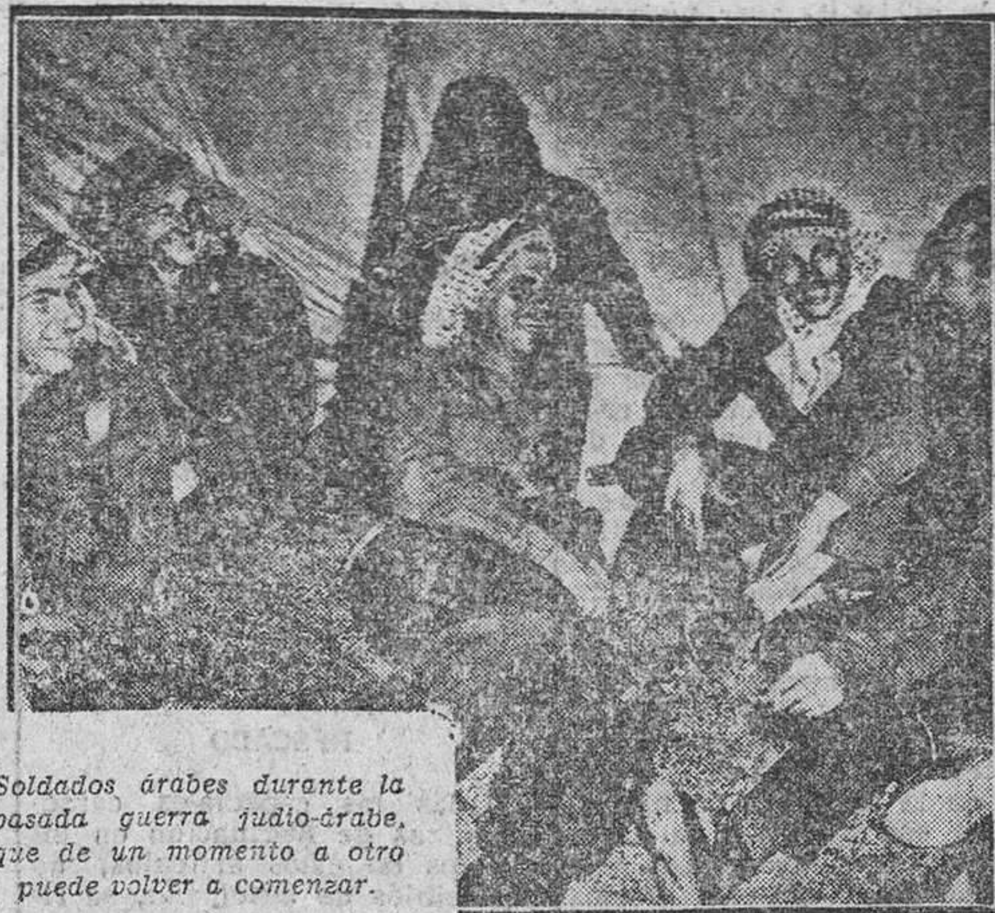
Soldados árabes durante la pasada guerra judío-árabe, que de un momento a otro puede volver a comenzar.

Ahora se ha dado la vuelta del revés y se han reconocido nuestra honra de bien y nuestra laboriosidad. La legislación social es justa y hecha sobre realidades que acorquen más a los de arriba y a los de abajo. Colaboración, al bien común, que es la verdadera paz entre los hombres. Y si hay escasez, intervención prudente o drástica—según aconsejen las circunstancias de buena voluntad o egoísmo—, con el fin de defender a los económicamente débiles. Esa ha sido la línea de conducta del Gobierno de Franco en los días difíciles, y esa es la disposición que volvería a repetirse en caso de que algunos olvidasen cuál es el recto camino de la Patria, del pan y de la justicia de todos y para todos.