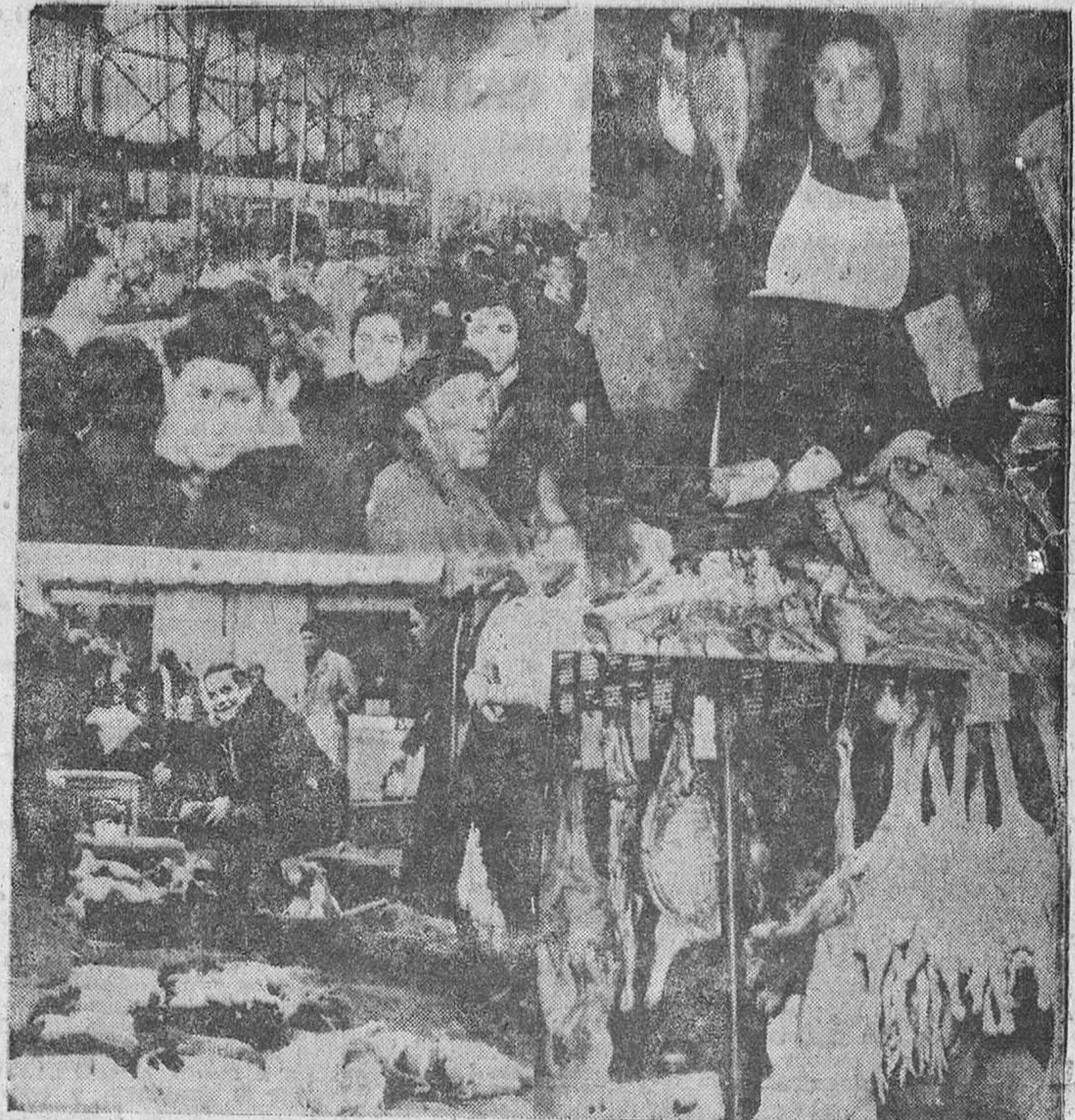
La cámara de Juanes recogió estas cuatro instantáneas para ilustrar el presente reportaje. Una vista parcial del Mercado de Abastos, completamente rebosante, como puede verse. La dueña de una pescadería ofrece besugos a veintidós pesetas. Los pollos, sobre el suelo, esperan resignados el cuchillo y la cazuela. Y por último, uno de los puestos que ofrecen a las amas de casa los gallos y los conejos ya limpios de plumaje y piel.

—Valen a diez pesetas. —¿Las nueces? —Las escogidas, a doce —¿Y las no escogidas? —A nueve. —¿Y las castañas? —A tres cincuenta el kilo.