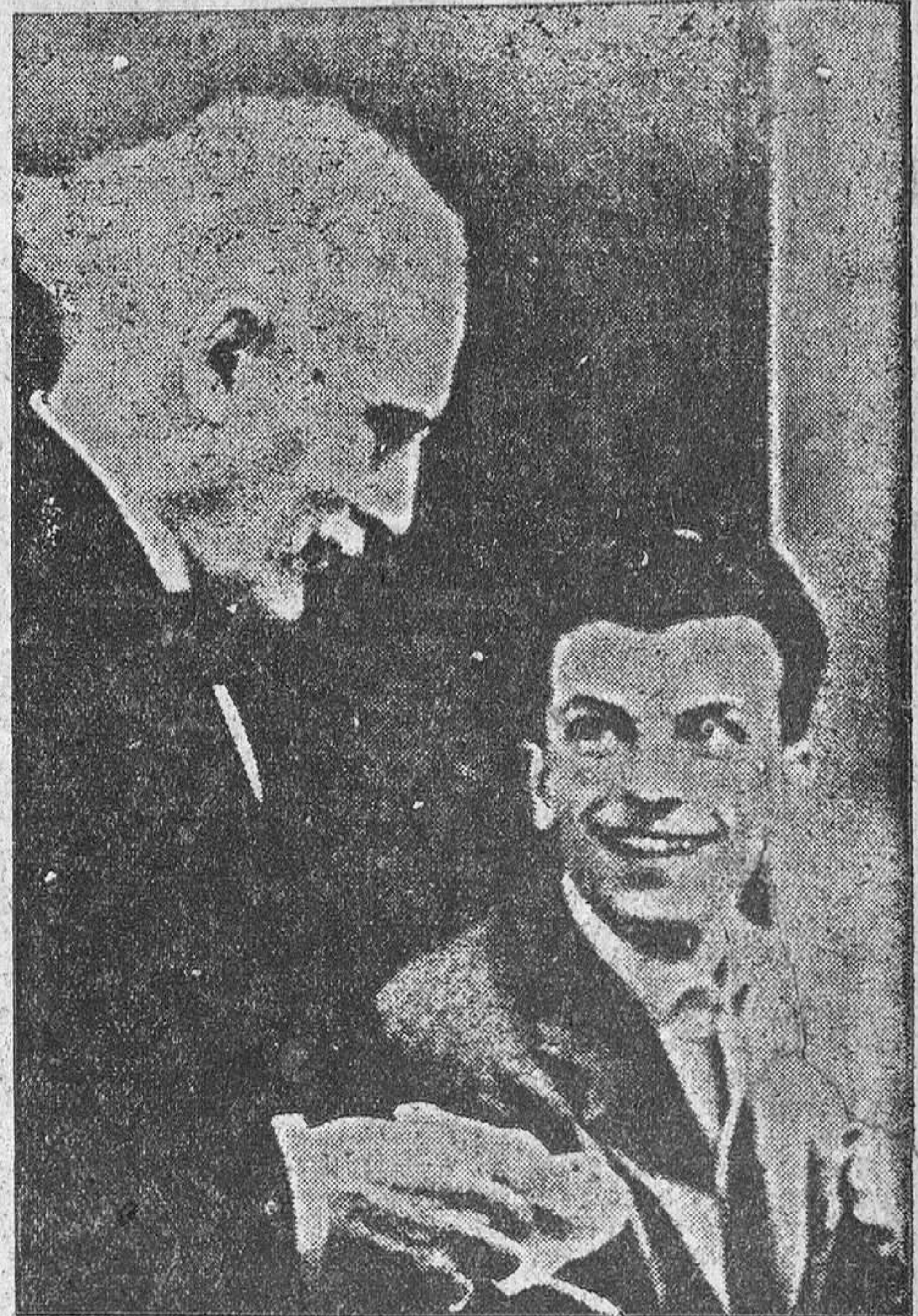
Toscanini con Cantelli, su sucesor, fotografiados en Milán, en 1950.