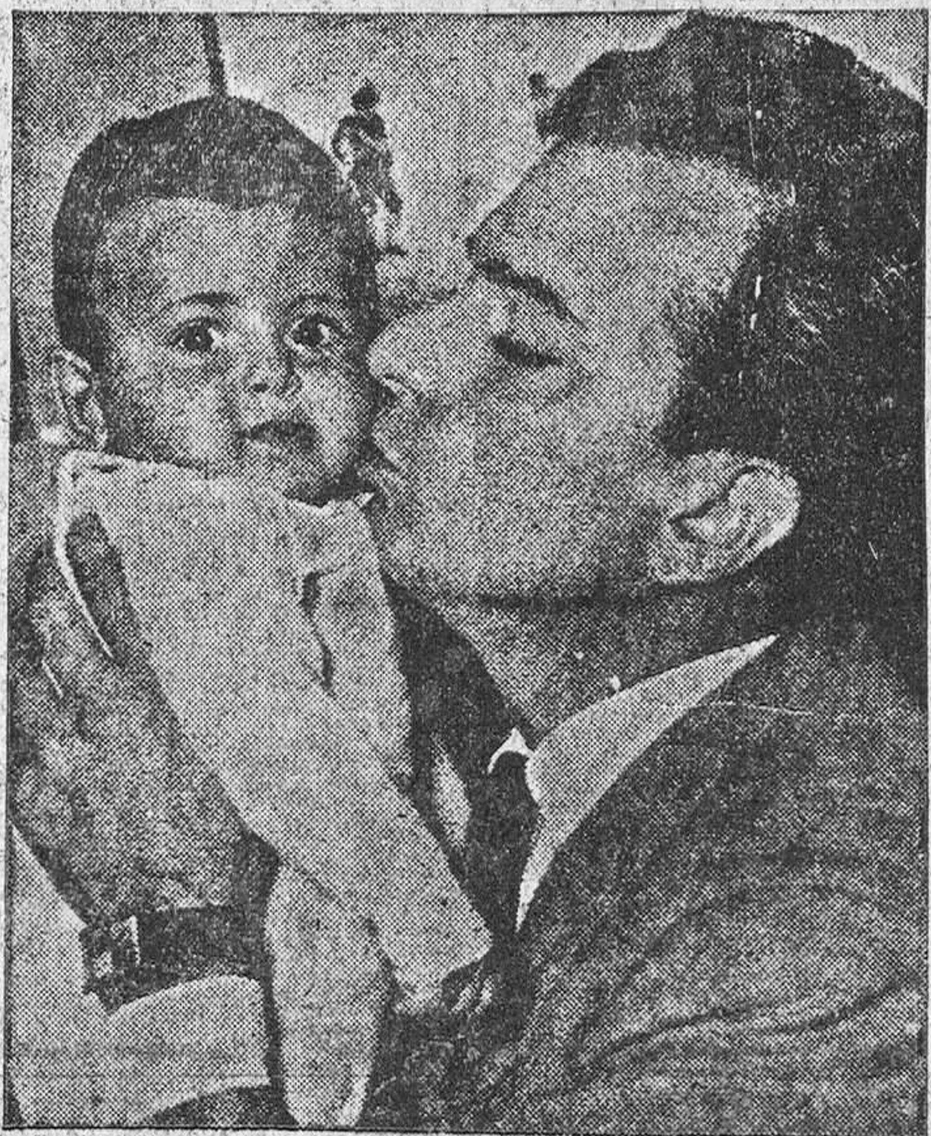
Cantelli besa a su hijo, que constituía la mayor ilusión del joven ídolo musical.

En la reciente catástrofe de Orly desapareció, entre tantas víctimas, un genial director de música: Guido Cantelli. Su vocación se manifestó desde niño. Hablando de él todos decían: "Es un muchacho muy afortunado". Habla quien lo expresó, como a él le acaeció, cuando sólo contaba veintiocho años por un Arturo Toscanini, hasta el punto de ser "adoptado" artísticamente y proclamado "heredero" del más grande director de orquesta de todos los tiempos. Eso, cierto, es una