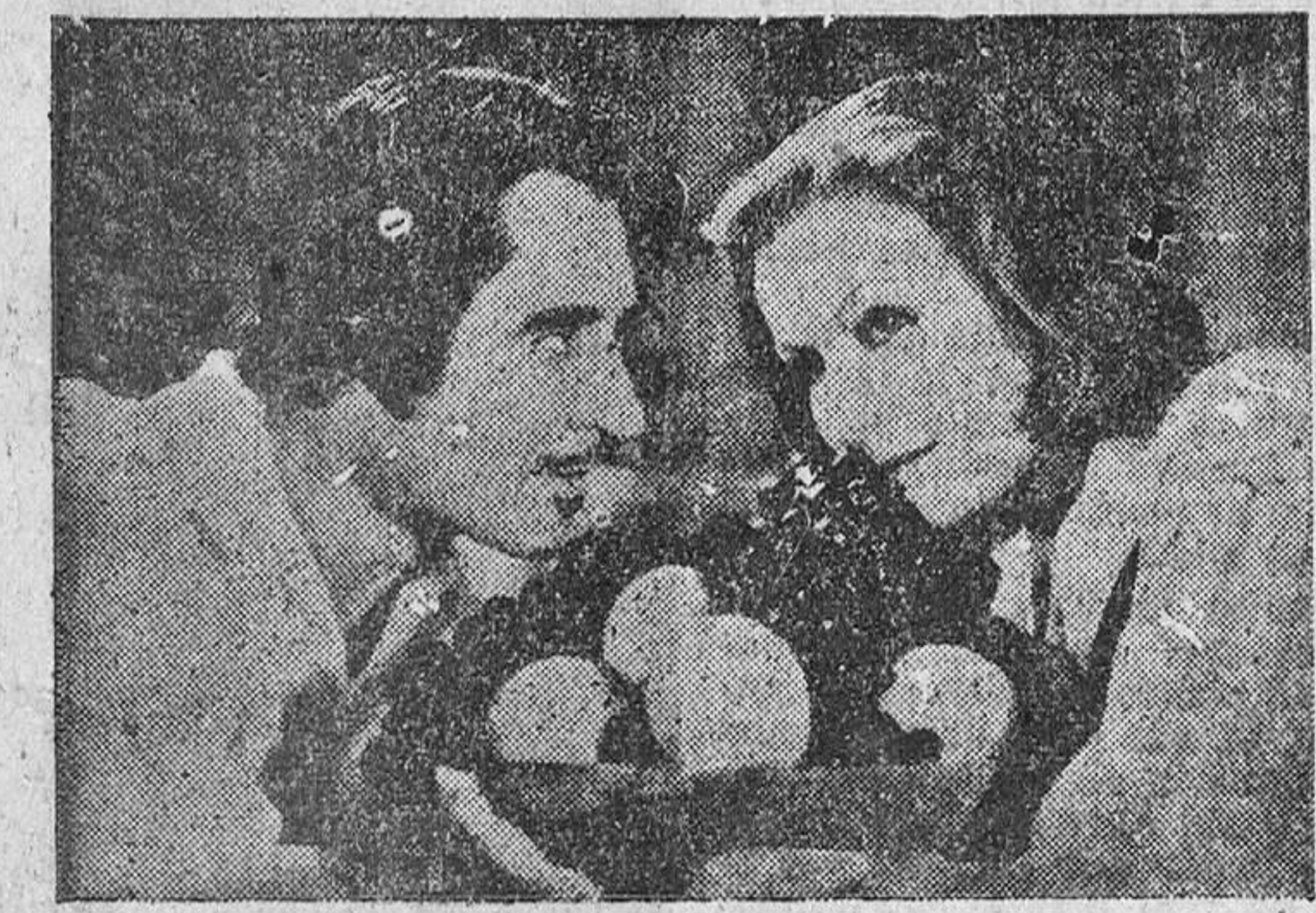
Greta Garbo en una de sus famosas películas, junto a John Gilbert...