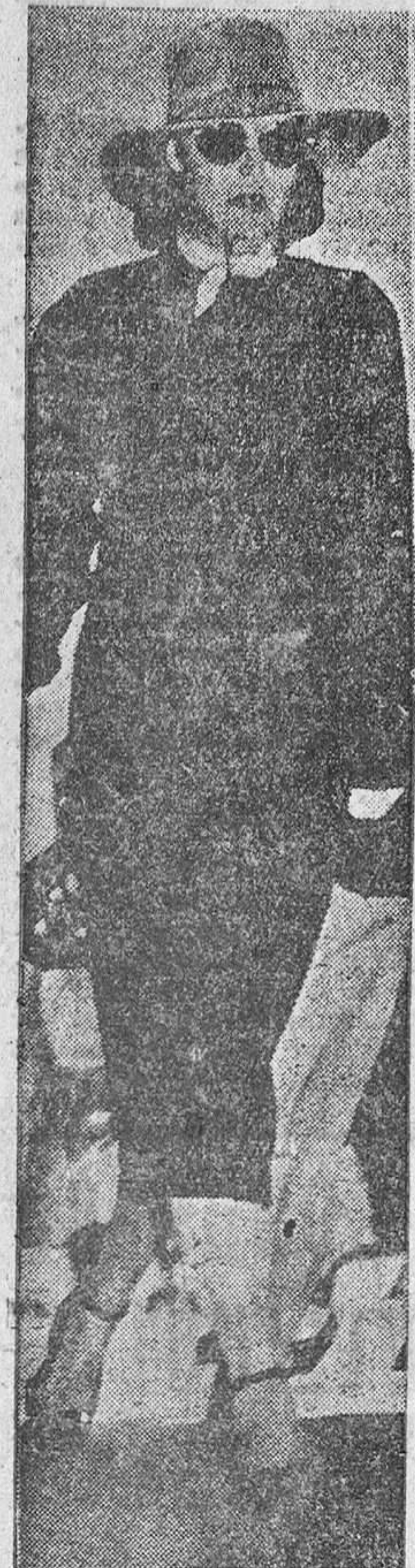
Greta Garbo en la actualidad, paseando su enigma por el mundo.