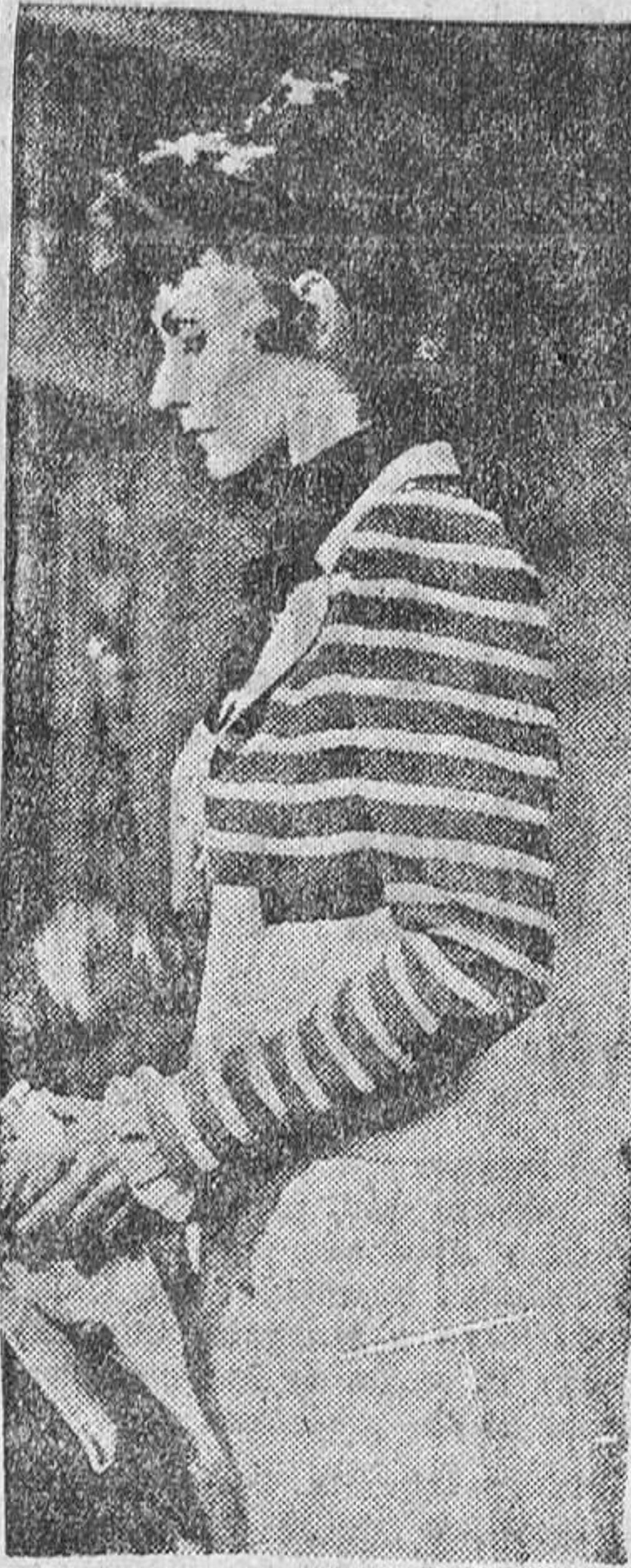
Una de las grandes películas de Greta: "María Waleska"