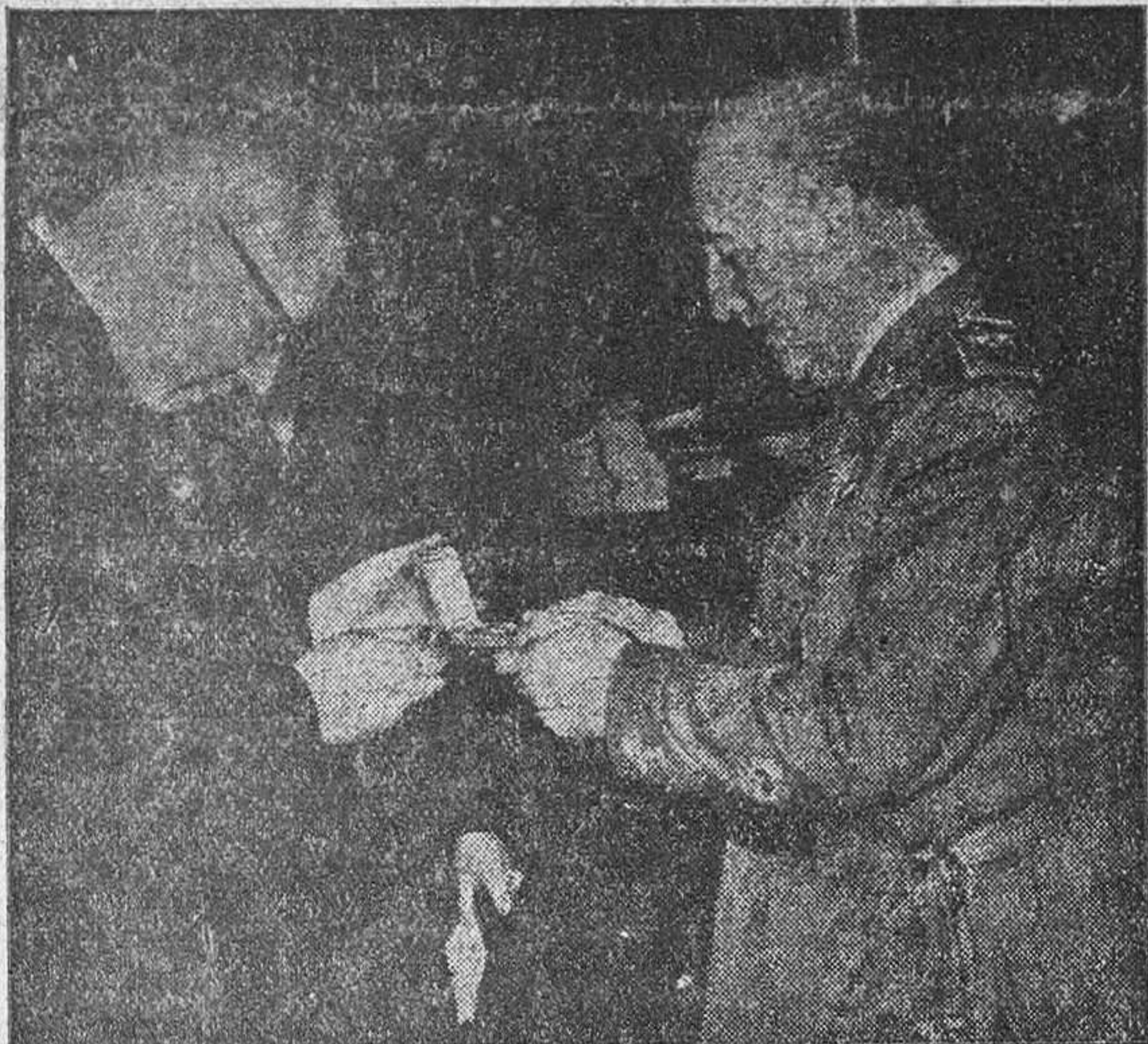
El Jefe del Estado recibiendo la Medalla de Oro del Monasterio benedictino de Mariazell, de manos de su prior y que solamente se ha concedido con carácter excepcional a destacadas personalidades.