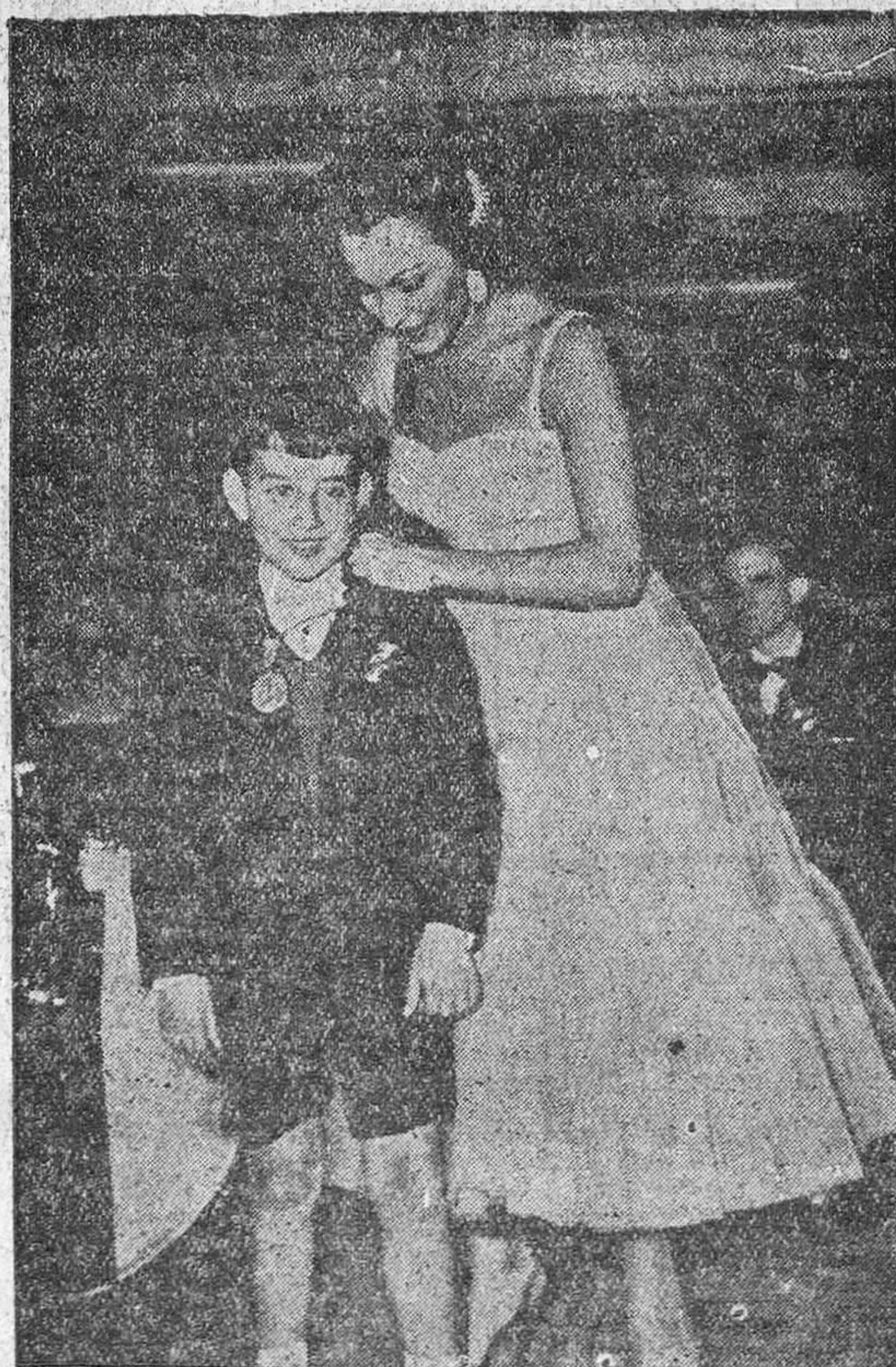
La artista de la pantalla, Paquita Rico, impone a su colega cinematográfico, el pequeño Pablito Calvo, la Medalla de Oro del Círculo de Bellas Artes, en el acto-homenaje a los artistas galardonados con dicha Medalla.