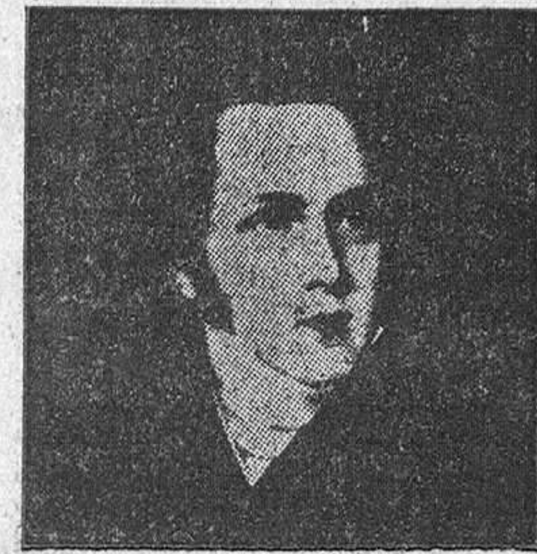
Bellini y su autógrafo.

Todo el mundo conoce la obra de Shakespeare "Romeo y Julieta", cuyas escenas son tiernas, patéticas y terribles. Para triunfar verdaderamente en este terreno, al compositor italiano le hubiese sido preciso poseer toda la flexibilidad del genio inglés. Bellini, delirioso en las expresiones de melancolía y ternura, pierde sus ventajas en las situaciones trágicas y fúnebres, que reclaman vigor. Hablando fríasado el tercer acto, se le sustituyó por el de las tumbas de otro