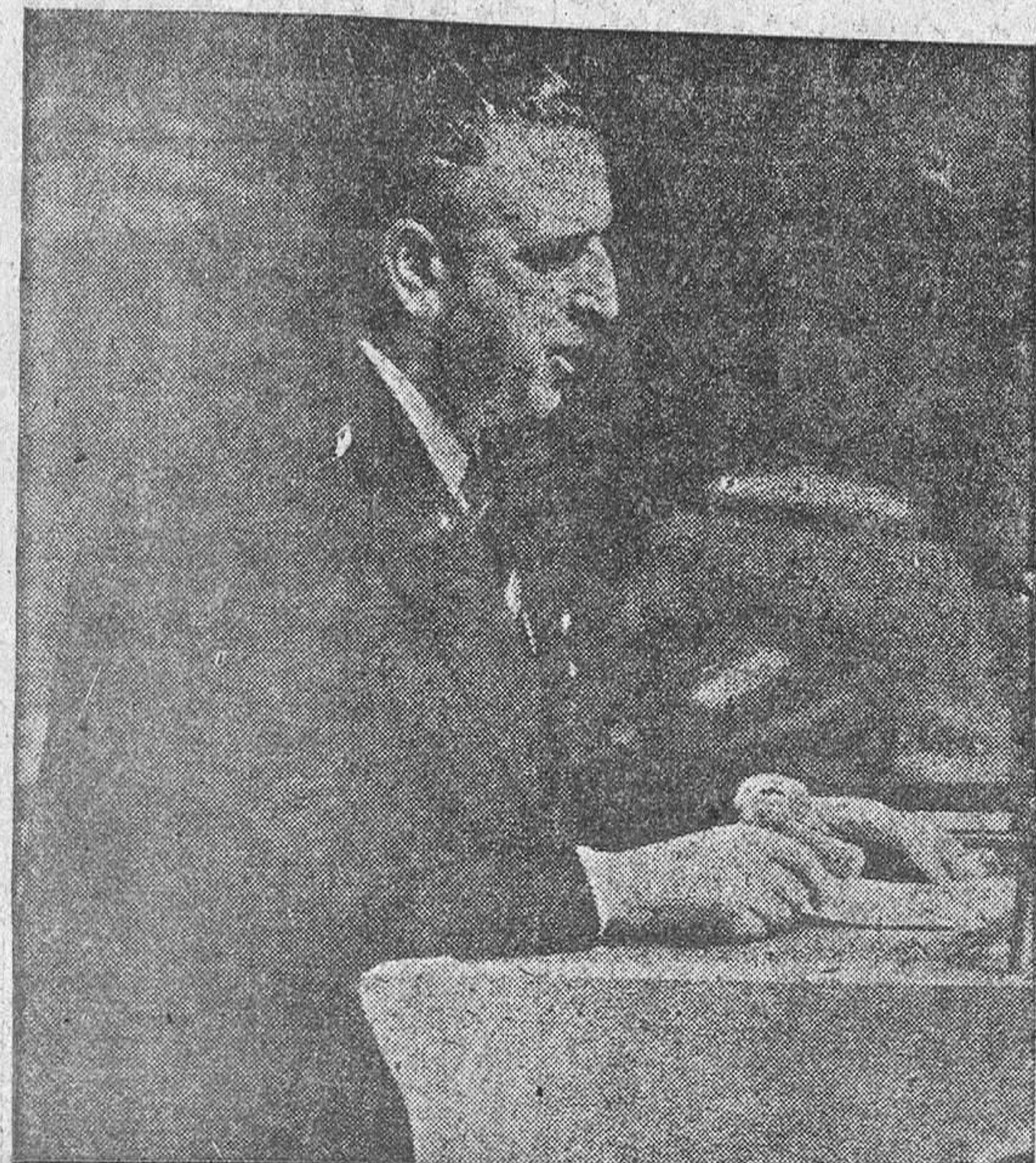
Martín Artajo, en la O. N. U.

España pide a Norteamérica más ayuda económica y trato de excepción en el suministro de petróleo