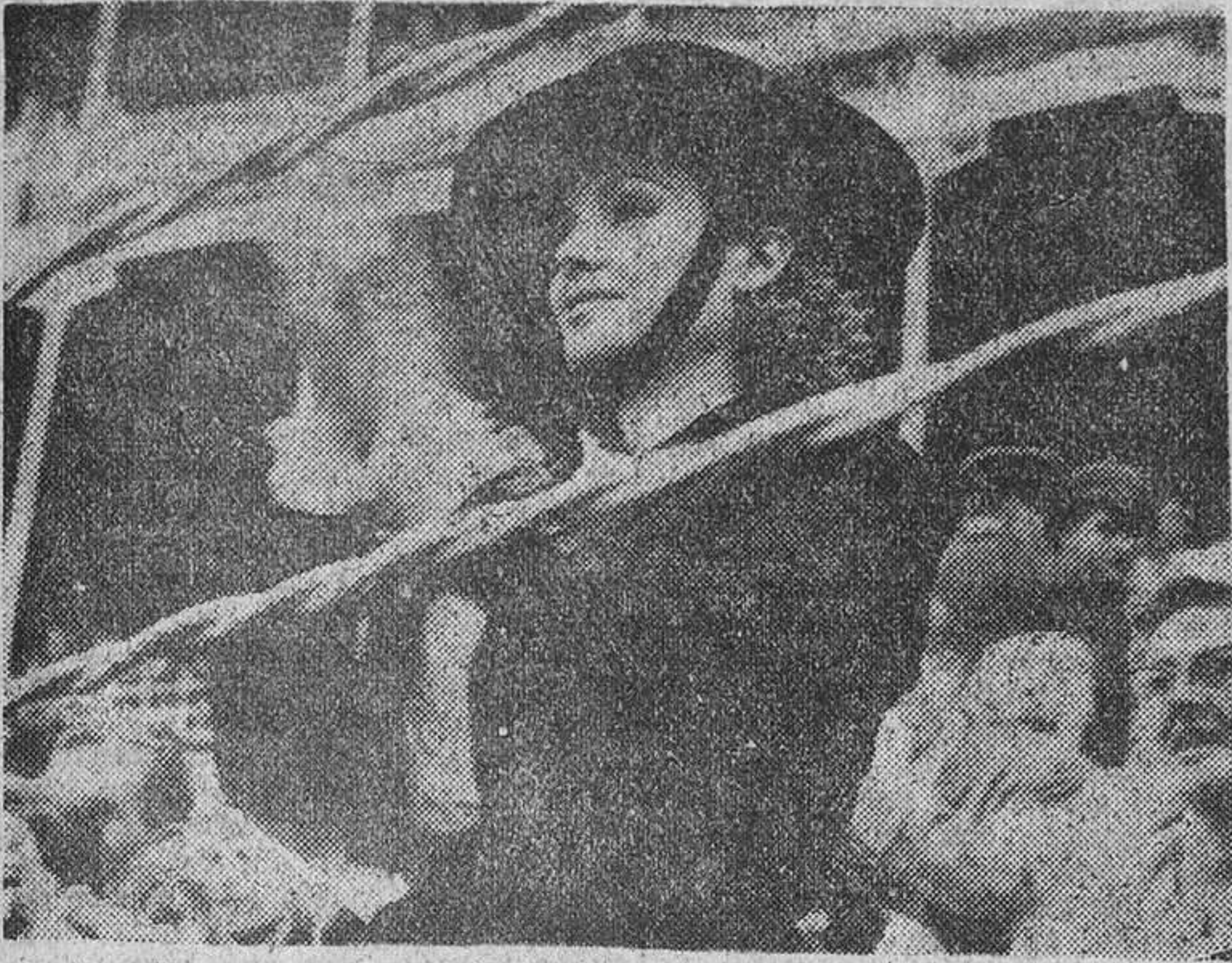
Festival taurino en Tarragona

Informes no oficiales señalan que fueron avistados unos catorce buques de guerra rusos. En fuentes militares se afirma hoy que dos destructores rusos y uno polaco y un petrolero soviético entraron recientemente en el Báltico, y que, al parecer, regresaban de prestar servicio en la flota soviética del Ártico.—Efe.