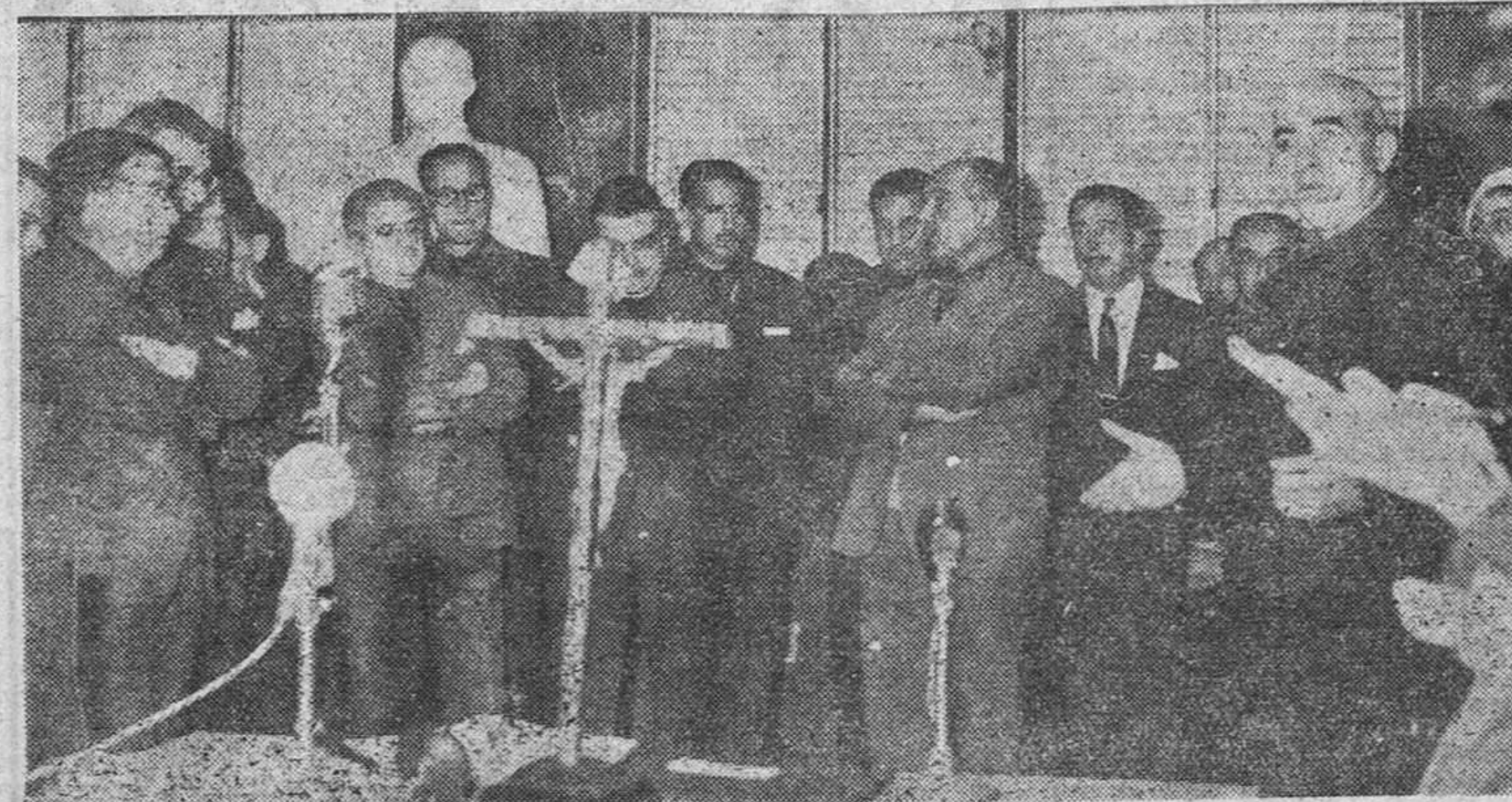
MADRID.—Un momento del acto celebrado en la Casa Sindical y bajo la presidencia del Ministro Secretario General del Movimiento durante el cual tomaron posesión los nuevos cargos sindicales.