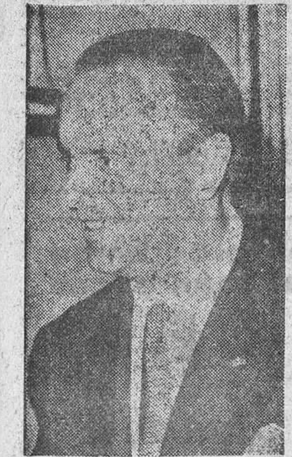
Lección de Fraga Iribarne al inaugurar el curso de la Academia de Ciencias Morales y Políticas

Madrid, 6.—(Servicio especial de PYRESA).—La actualidad del tema de la integración europea y su influencia en la política mundial dio indudable importancia al tema desarrollado por el ministro de Información y Turismo y catedrático, don Manuel Fraga Iribarne, en su lección inaugural de curso, en la Real Academia de Ciencias Morales y Políticas, bajo el título de "La forma política de la unidad europea".