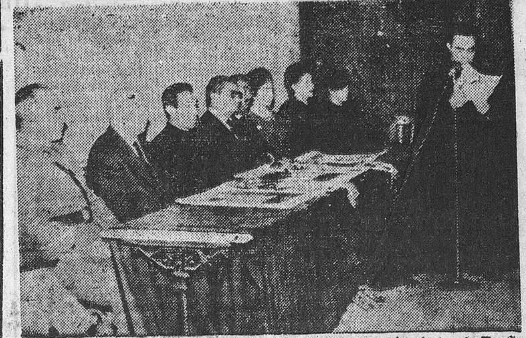
Un aspecto de la presidencia. En primer término, el P. Secretario leyendo la Memoria.