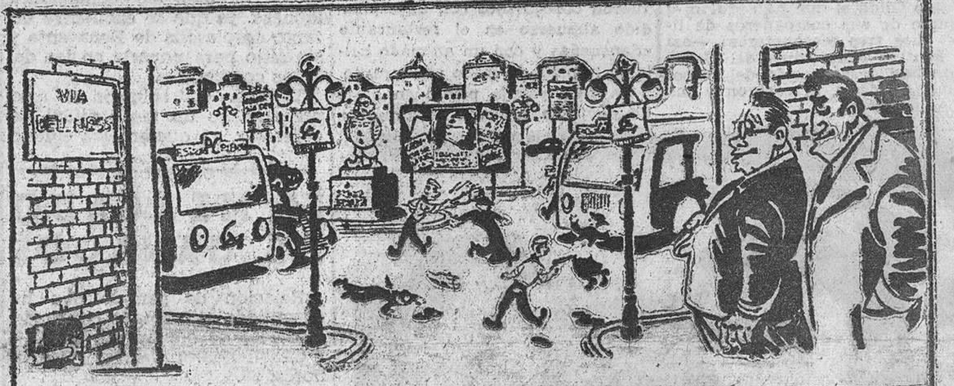
EL SUEÑO DE TOGLIATTI: Si la cosa sigue así, creo que no hará falta mi eterna oposición.