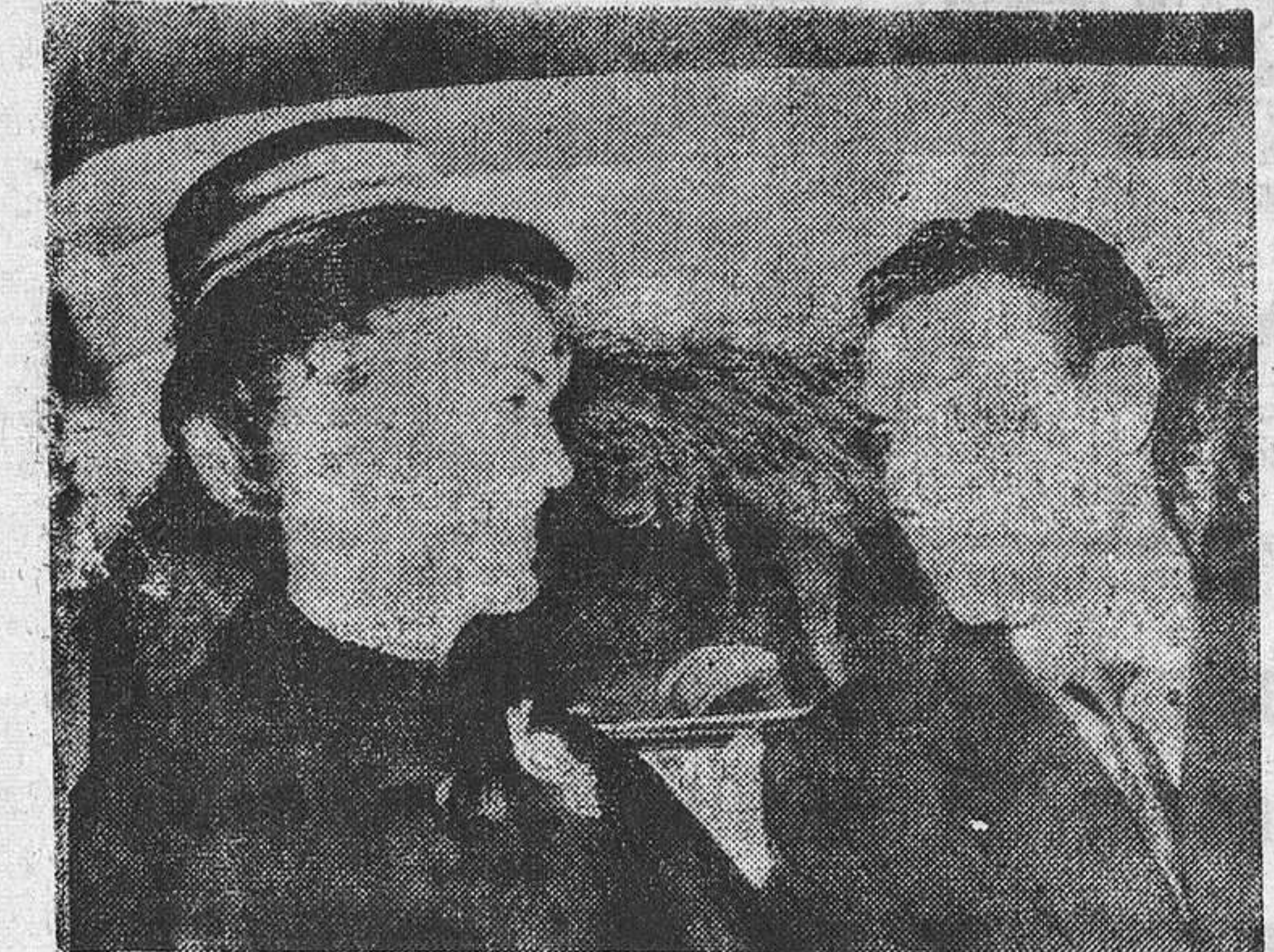
El pasado lunes, día 15, a las doce y media de la mañana y en la iglesia parroquial de San Juan del

La feliz pareja partió en viaje de novios para varios lugares de