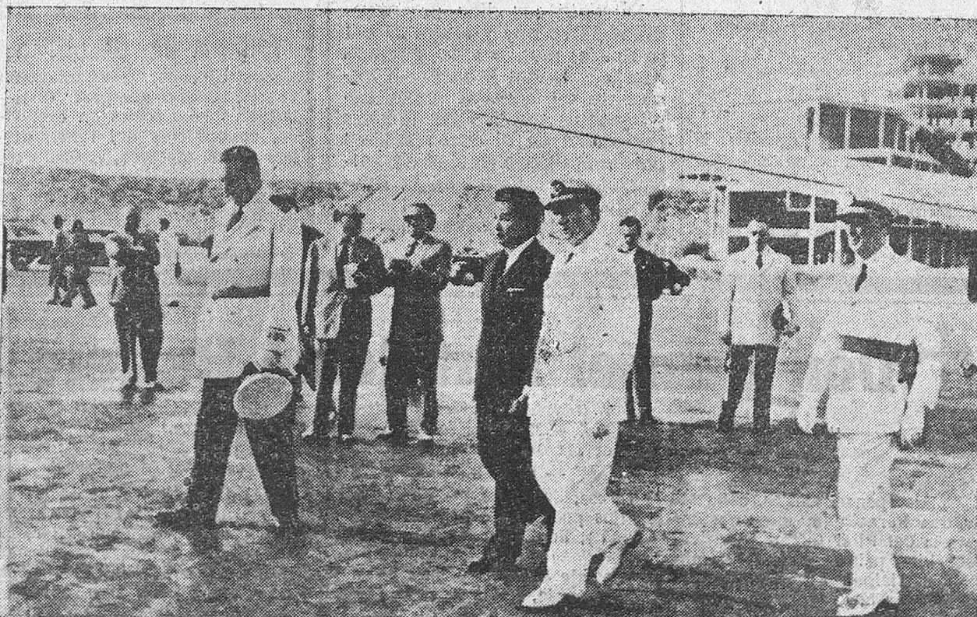
Aeropuerto de Barajas. — El príncipe Norodom Sihanuk, de Camboya, acompañado de los ministros de Asuntos Exteriores y Aire de España, señor Martín Artajo y general González Gallarza, pasa revista a las fuerzas militares que le rindieron honores en el aeropuerto, a su llegada.