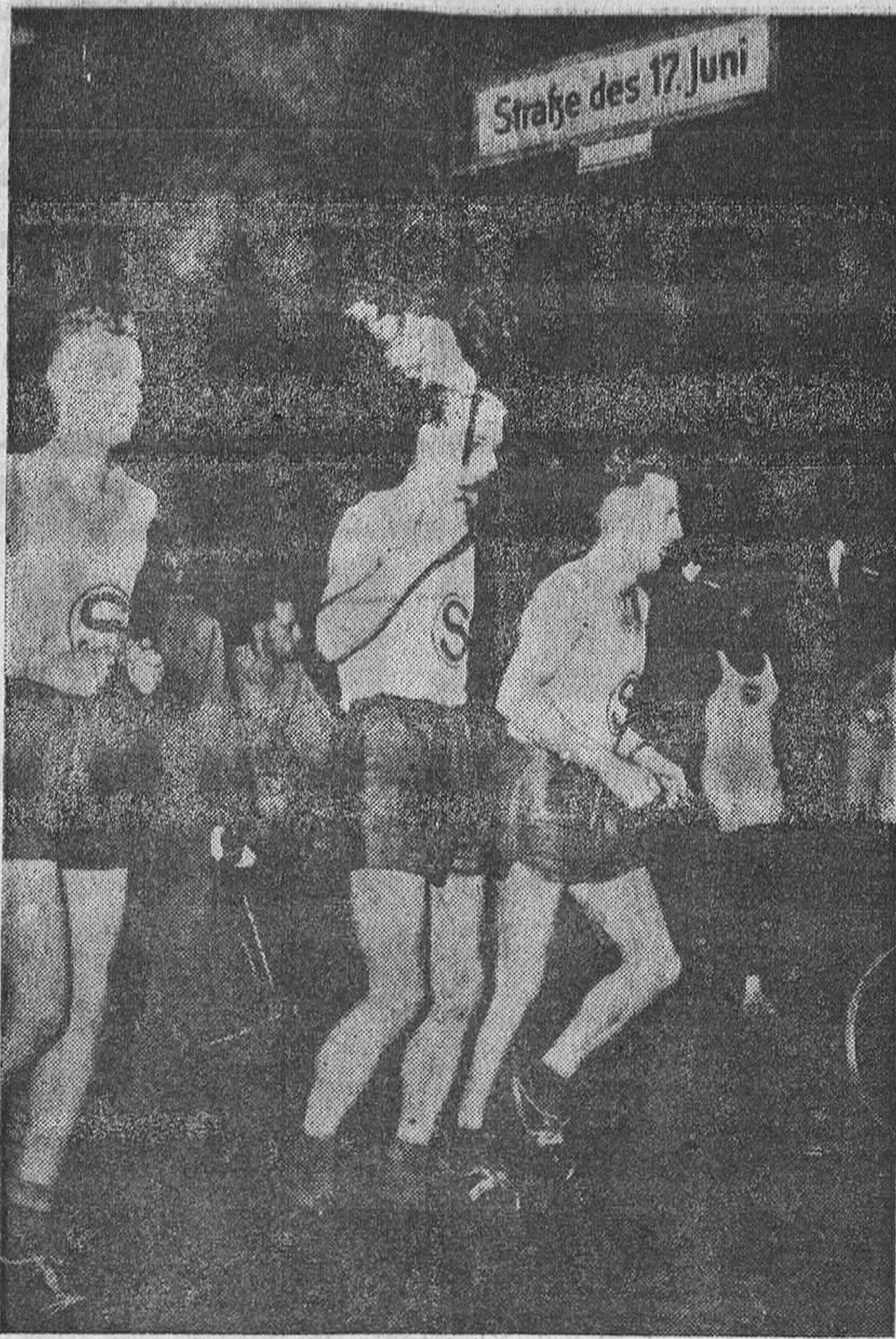
Miles de berlineses se reunieron ante las ruinas de la antigua Cancillería para dedicar un recuerdo a las víctimas de la rebelión de junio de 1953. Jóvenes anticomunistas portan la antorcha en honor de los héroes de aquel alzamiento.