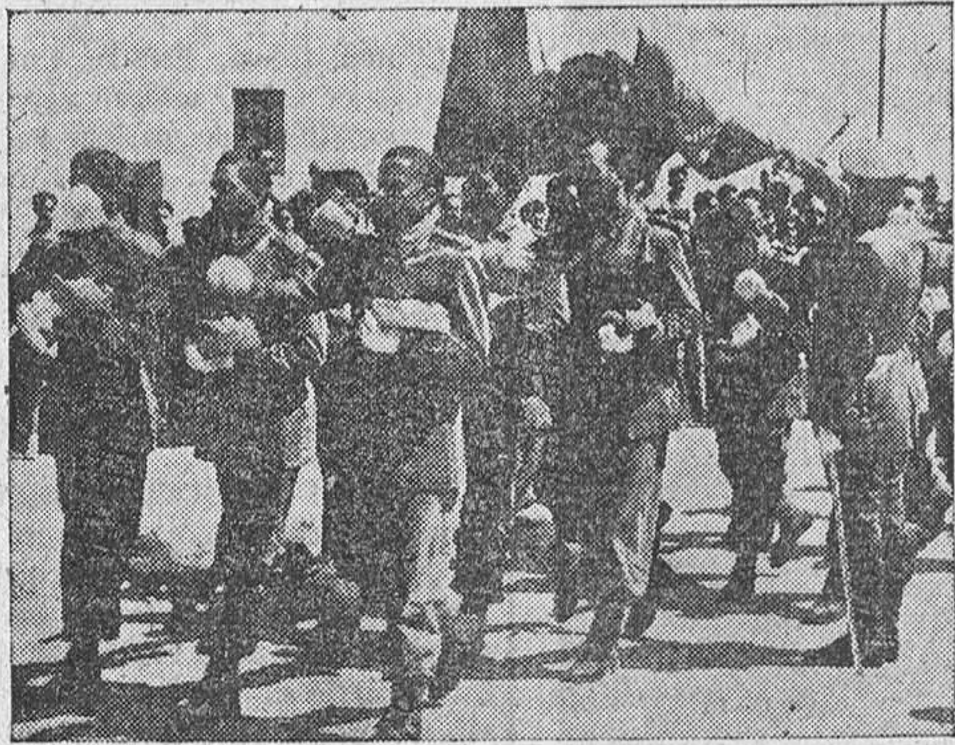
Los reclutas del Regimiento Toledo desfilan bajo la bandera después de prestar juramento.