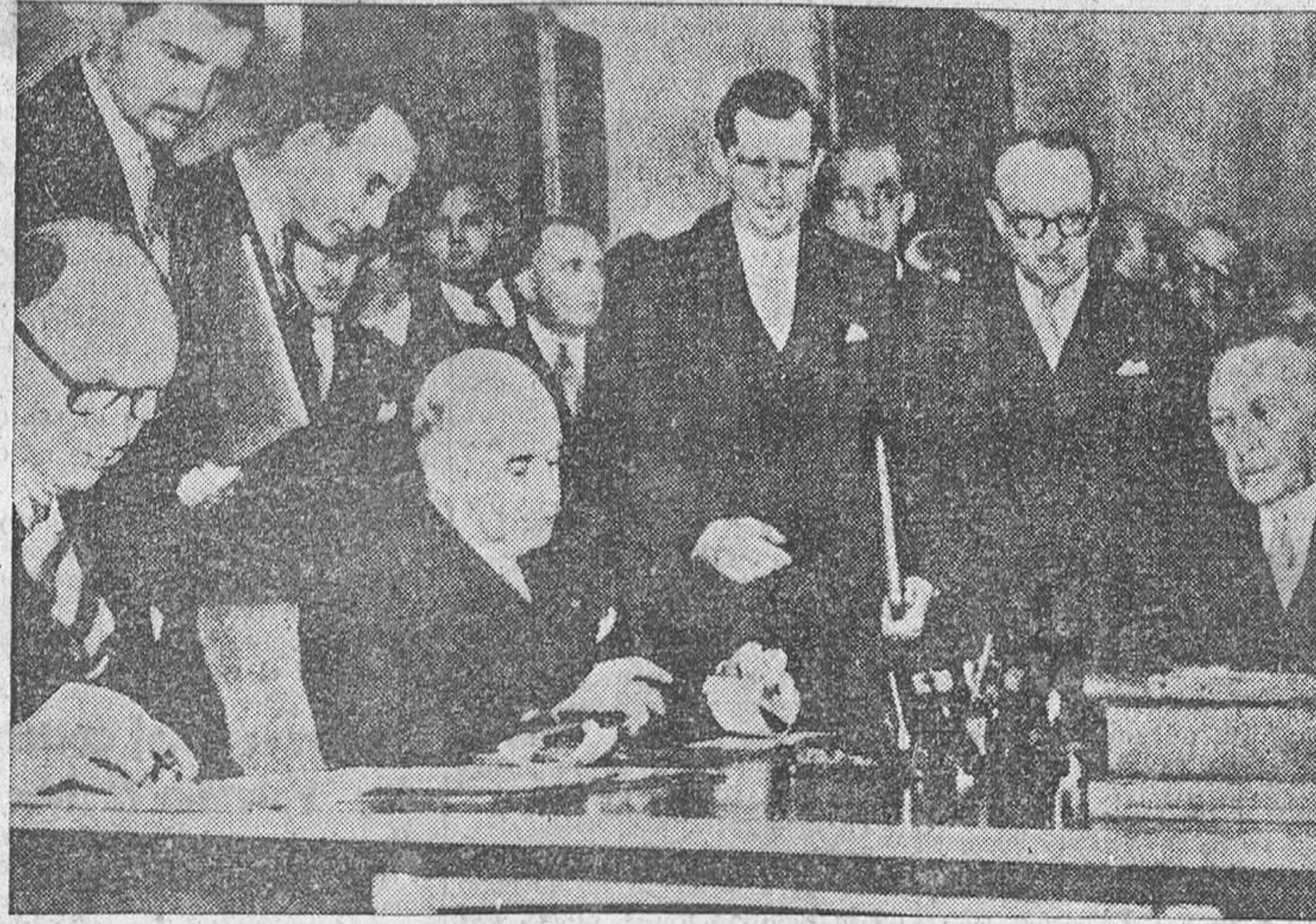
ESTE es el momento en que mister Hoyer Miller y Francois Poncet, hasta ahora Altos Comisarios de Inglaterra y Francia en Alemania, firman los acuerdos por los que esta noble y heroica nación recobra su libertad perdida. Presencia la escena el canciller Adenauer.

Harold MacMillan, el secretario británico del Exterior, dijo: «Proclamamos con esto nuestra fe en el pueblo alemán, como ellos proclaman la suya en las miras y los ideales de la O.T.A.N.»