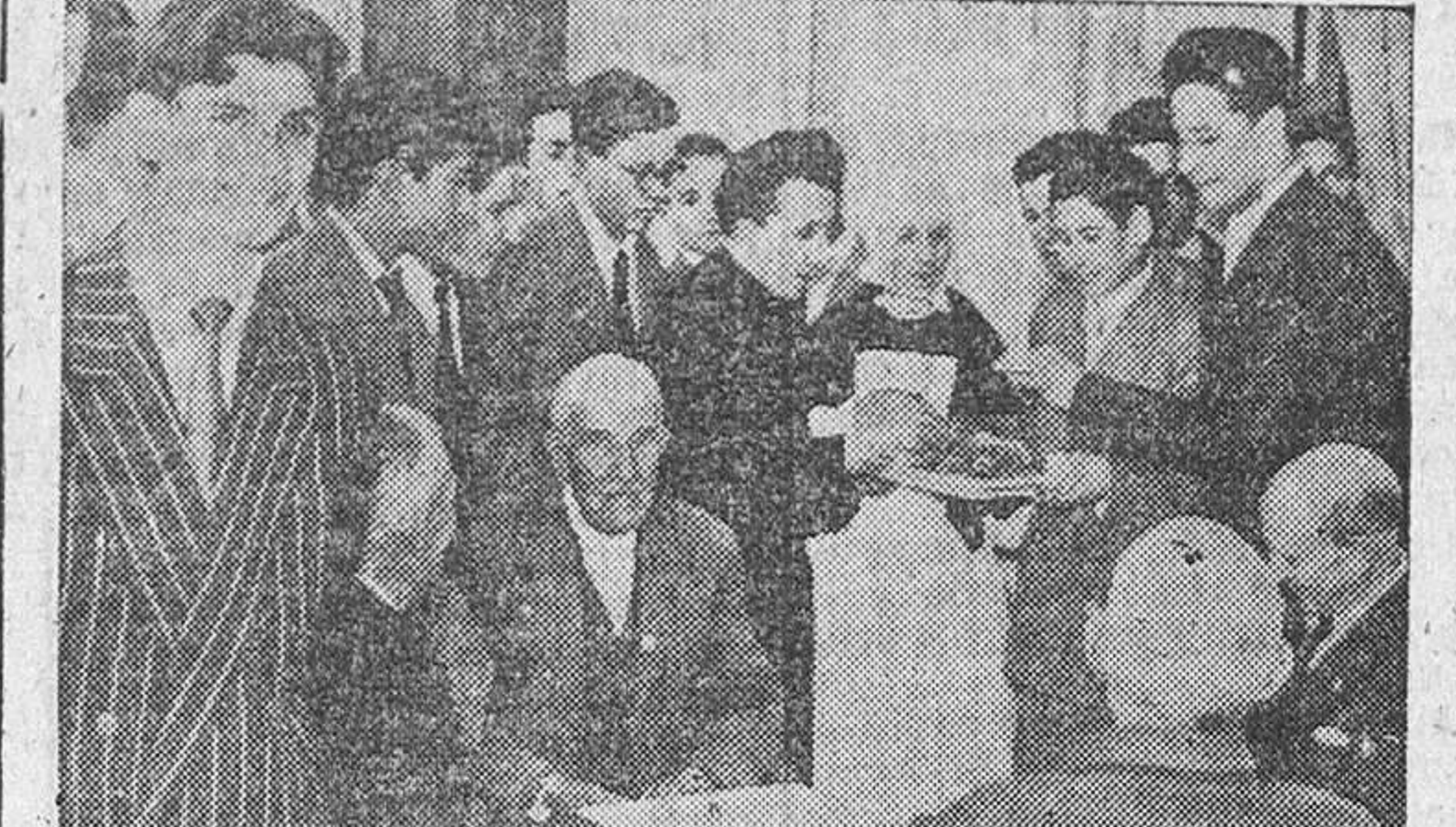
Los alumnos del Colegio del Corazón de María, a quienes correspondió el «Mandón de los Marcianos», tuvieron el bello gesto de donárselo a los ancianos del Asilo. El domingo se verificó la entrega. Después de desmenuzado convenientemente, todos los ancianos fueron obsequiados con el caramelo.