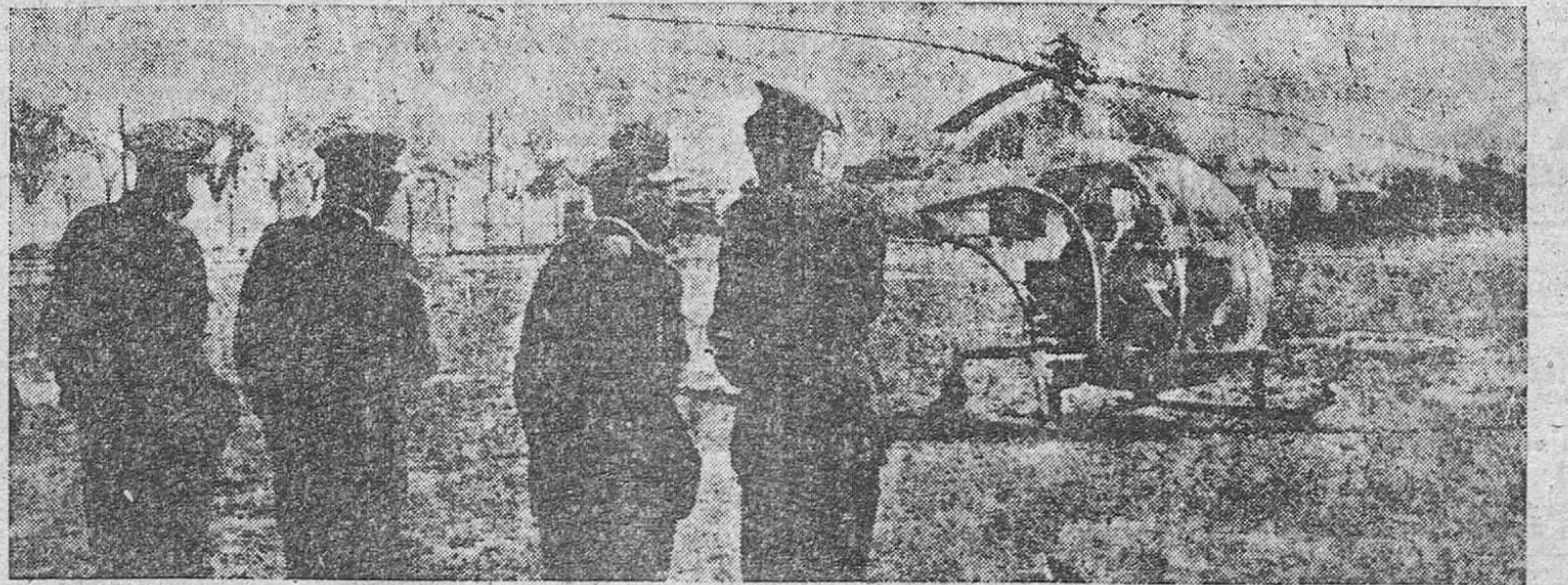
El pasado miércoles se celebraron en el aeródromo de Getafe pruebas con el primer helicóptero a reacción (el AC 13), de construcción española. En nuestra fotografía, el momento en que el helicóptero se posa en tierra, en presencia del ministro del Aire, señor González Gallarza y otras personalidades.