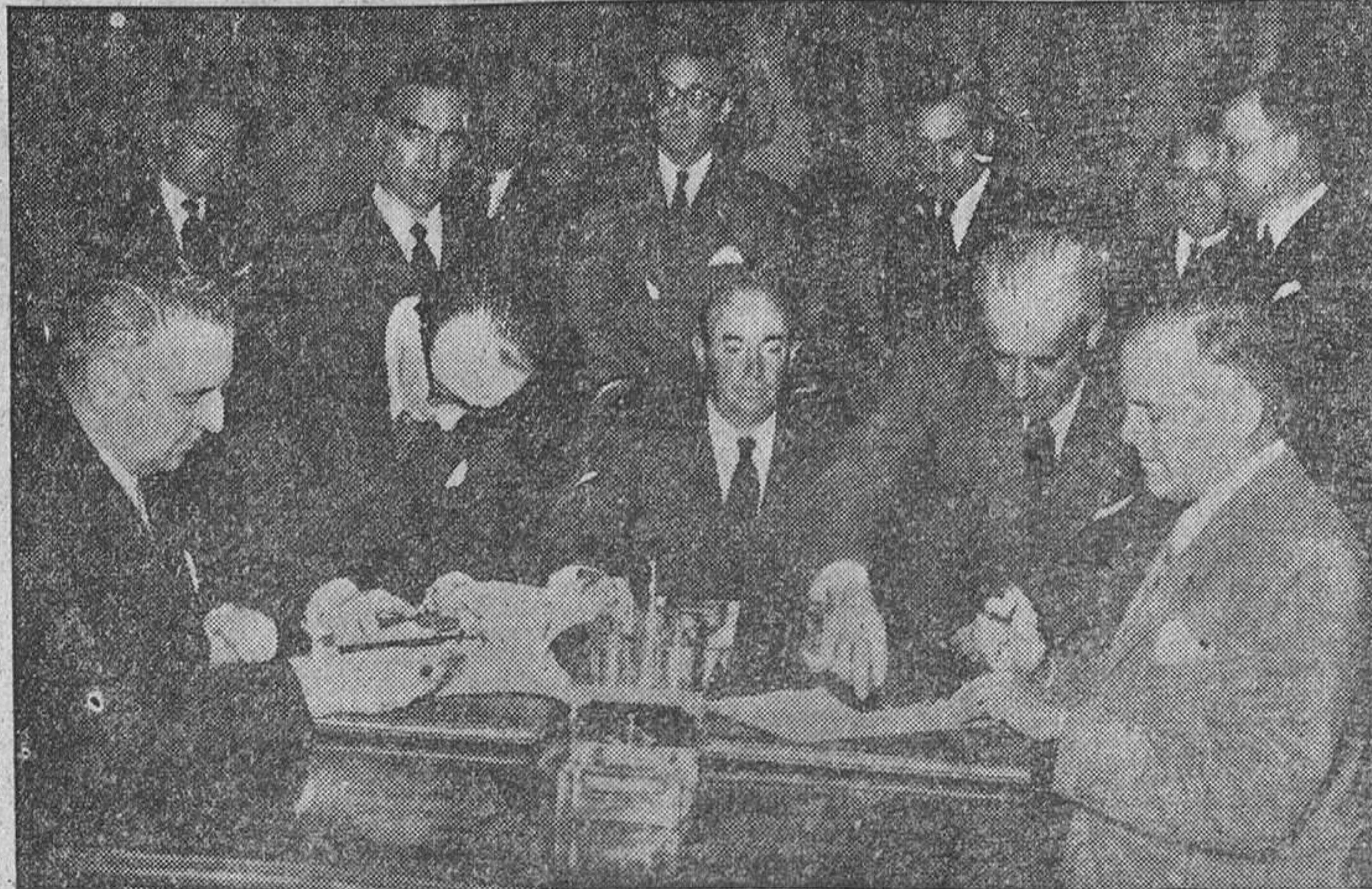
MADRID.—En el Ministerio de Asuntos Exteriores se ha celebrado el acto de la firma del acuerdo hispanonorteamericano de suministros de excedentes agrícolas. Los ministros de Asuntos Exteriores y el de Comercio con el embajador de los Estados Unidos en el momento de la firma.