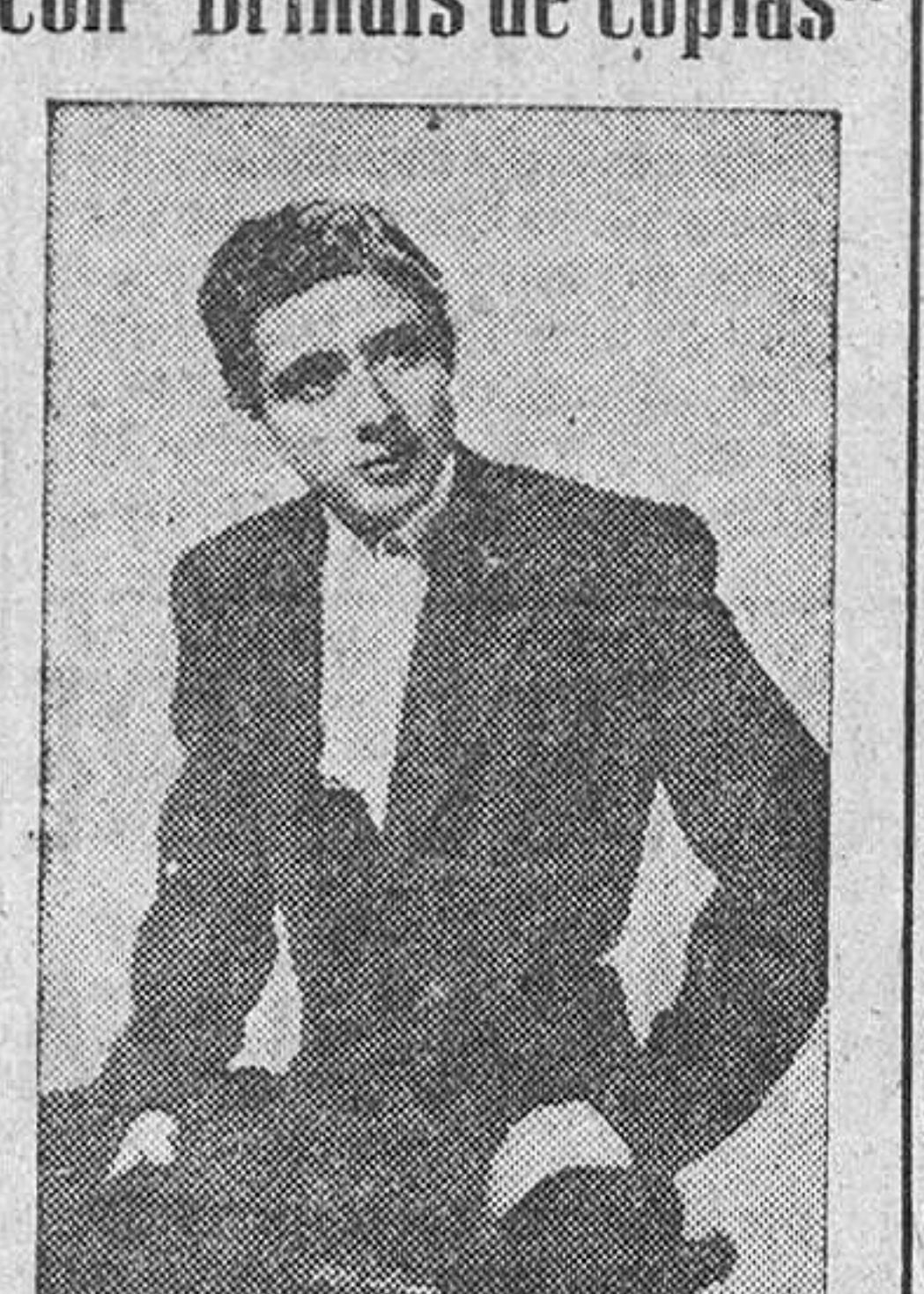
Presentación de El Príncipe Gitano con Brindis de coplas.

Porque, dicho sea de paso, cierto es que no figura en esta primera exposición todo lo bueno que, tanto en pintura religiosa como en imaginaria, existe en nuestra ciudad y provincia. Pero no es menos cierto que si toda obra que aspira en su proceso a un supremo grado de perfección necesita infaliblemente de un principio feliz, esta exposición de arte sacro tiene en su primera manifestación pública el principio más elocuente: la abundancia de obras, la calidad estimable de las mismas y la manera en que nos son presentadas, para lo cual se habrán visto morados director y organizadores, dado el espacio reducido del salón, que nos obliga, sin querer, a verla recargada, a pesar de los esfuerzos indudables que habrá costado la distribución y colocación de las obras.