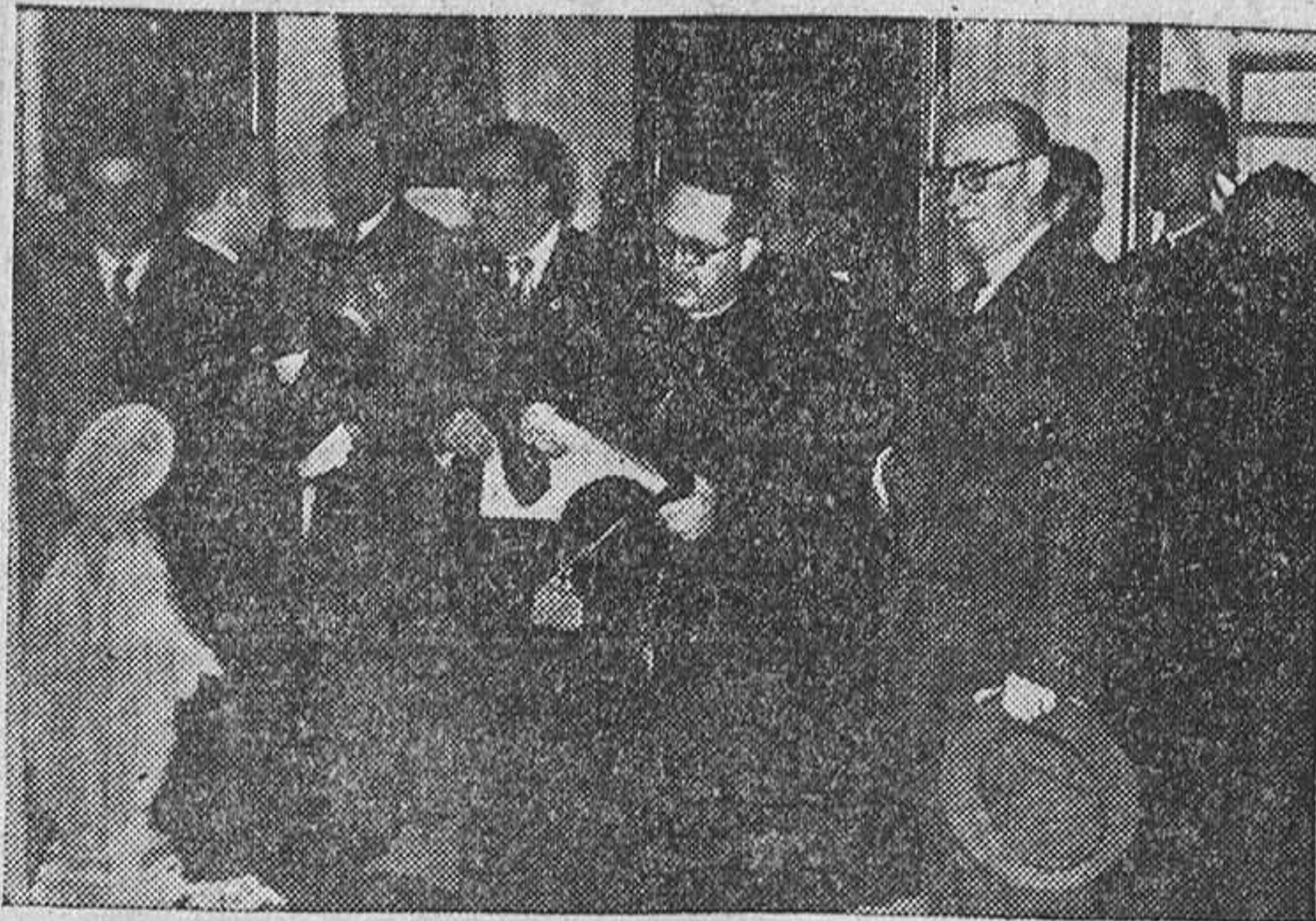
El acto de la inauguración.