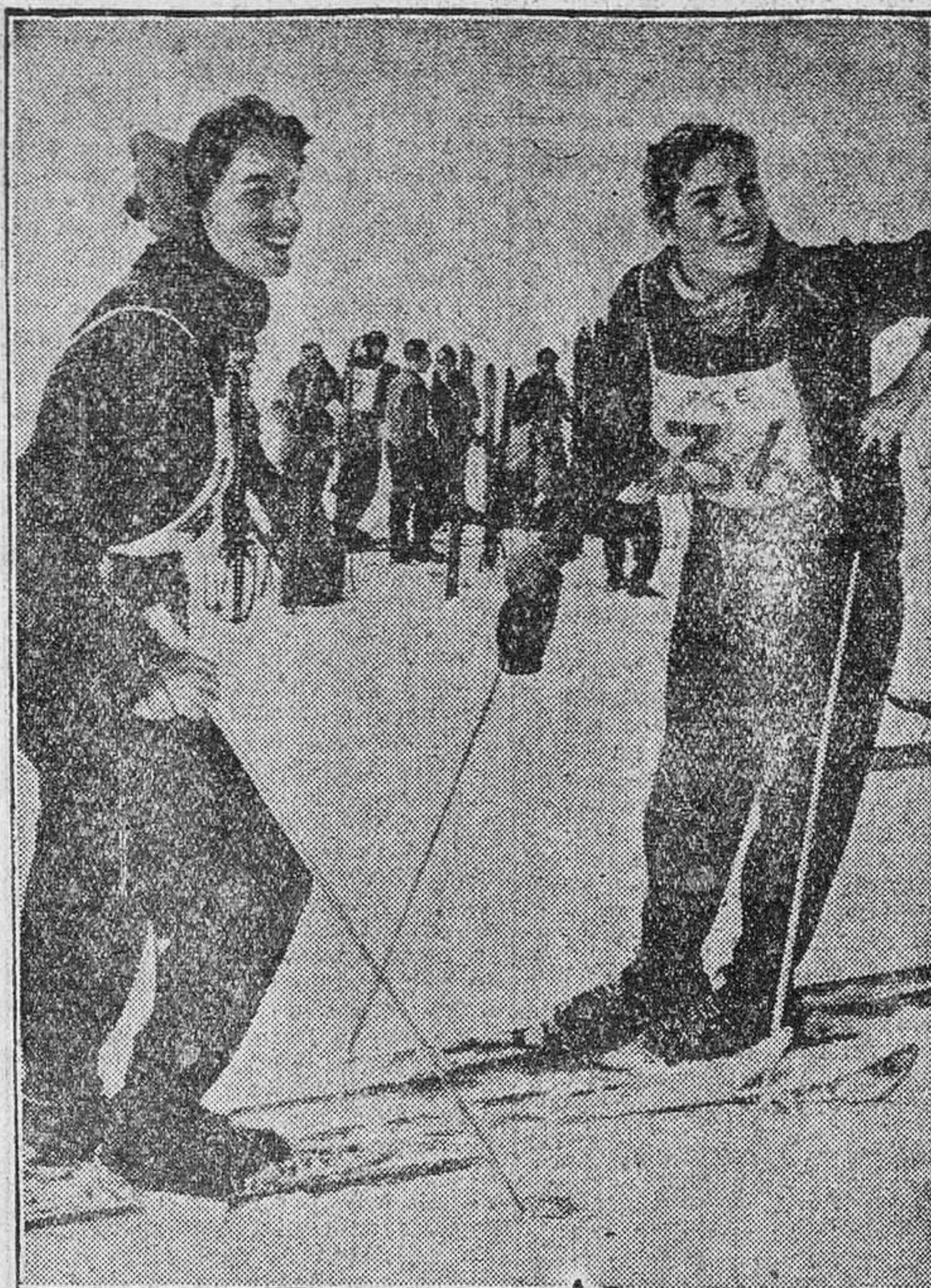
Se están celebrando en las pistas de Nuria los Juegos de Invierno. Entre los participantes, bellísimas mujeres, como las de nuestra fotografía, se deslizan sobre la nieve.