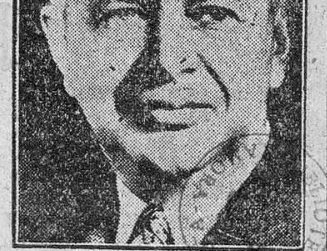
WILSON Secretario de Defensa de los Estados Unidos

Por su parte, Wilson dijo que el Gobierno de los Estados Unidos está determinado a mantener buenas relaciones con el Gobierno y pueblo españoles. Como referencia al programa de construcción de bases, señaló que reconocerá la situación de tal forma, que nazca un mutuo respeto y renacimiento fundamentales para el desarrollo del acuerdo entre ambos países.—Efe.