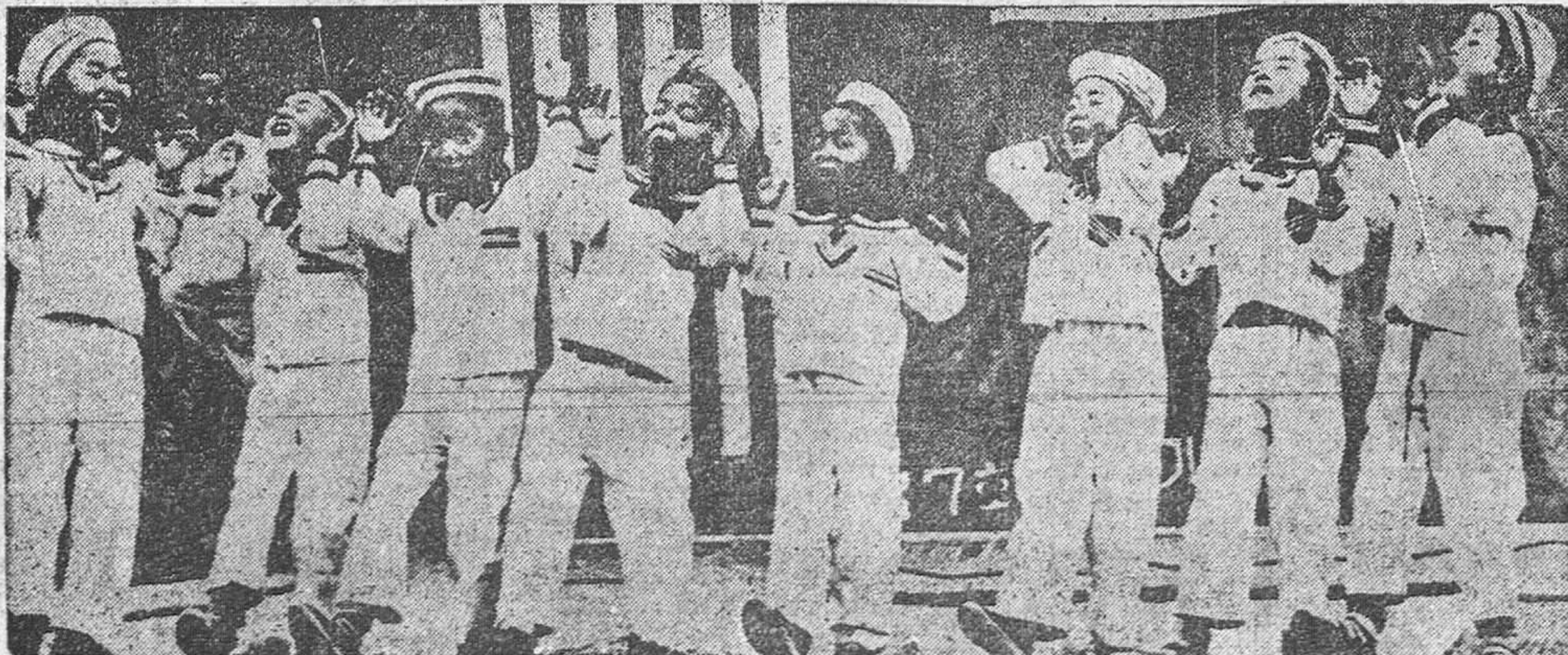
Parecen simpáticos muñecos de un teatro de marionetas, pero son niños coreanos que cantan y danzan para agradecer así a los marinos norteamericanos el ofrecimiento de una escuela primaria donde la chiquillería de Corea aprenderá a amar a su patria y a sentirse reconocida a los Estados Unidos.