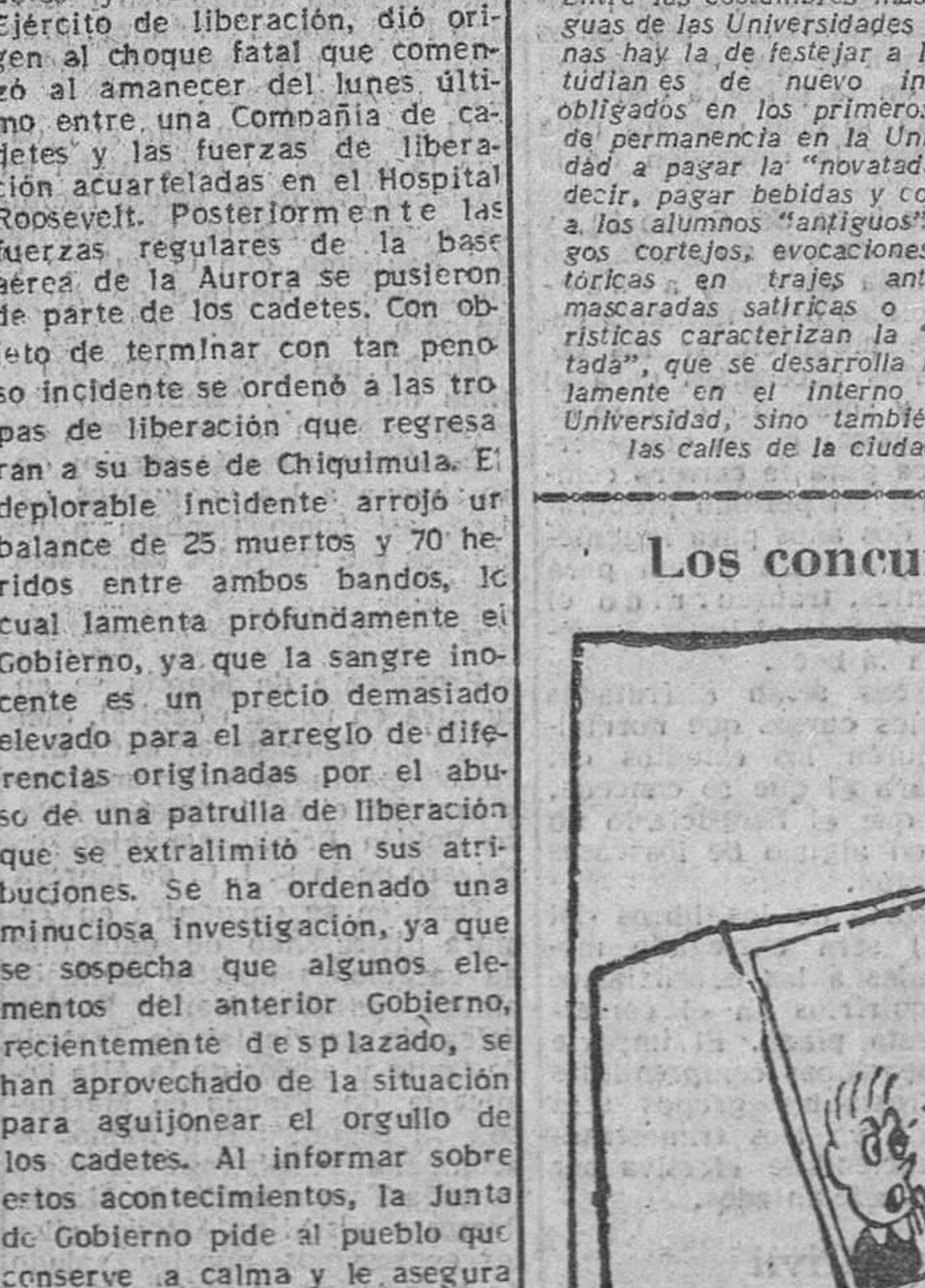
—Y ahora, dígame: ¿Qué es lo que descubrió Colón? ¿...? ¡América!