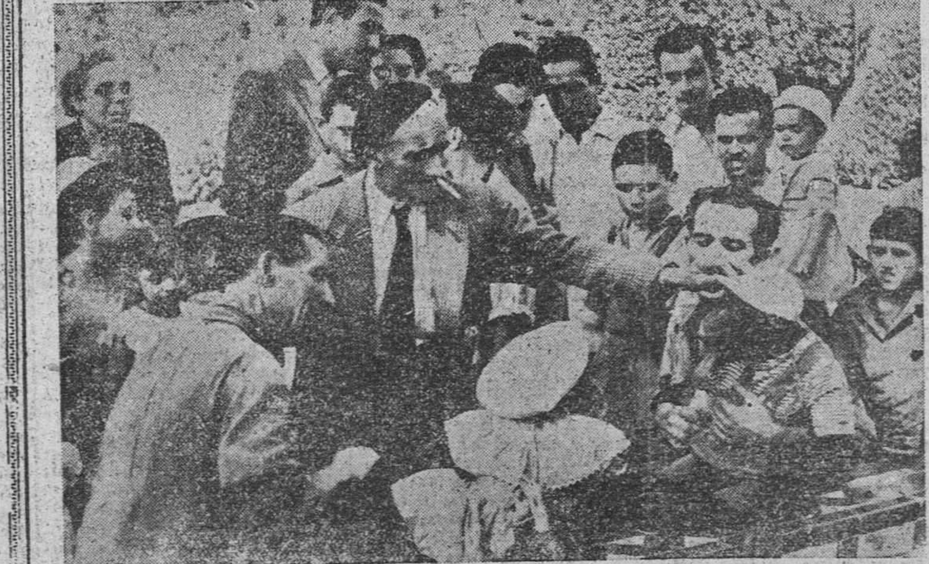
MADRID.—A la llegada de los contingentes procedentes de la ciudad, son recibidos con todos los honores por los visitantes del parque. Los orangutanes, a los que visitó el Ayuntamiento, no han extrañado nada a sus visitas.