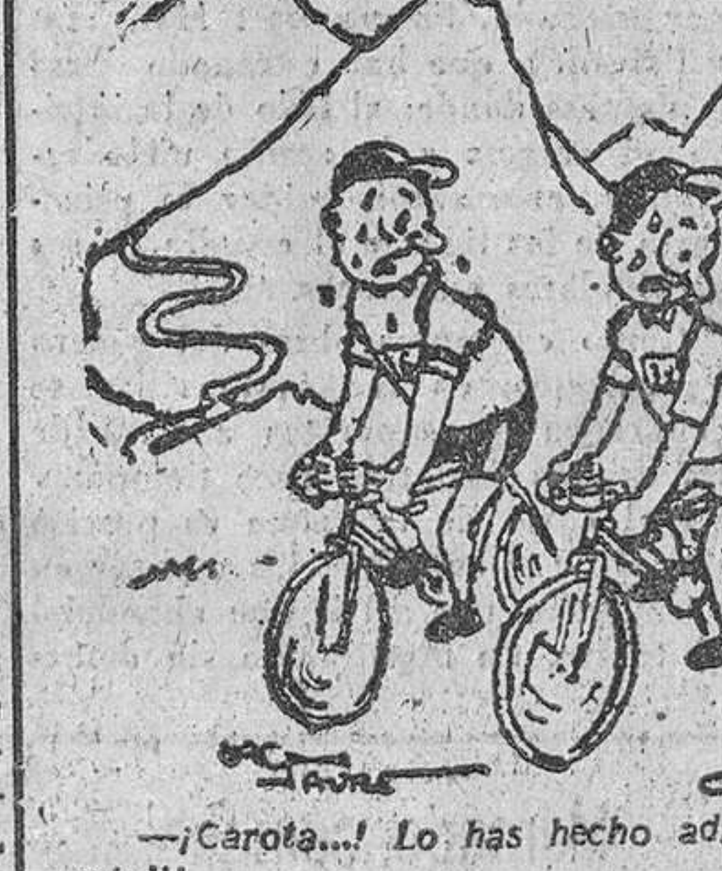
—¡Carota! Lo has hecho adrede para volver a París en automóvil!...