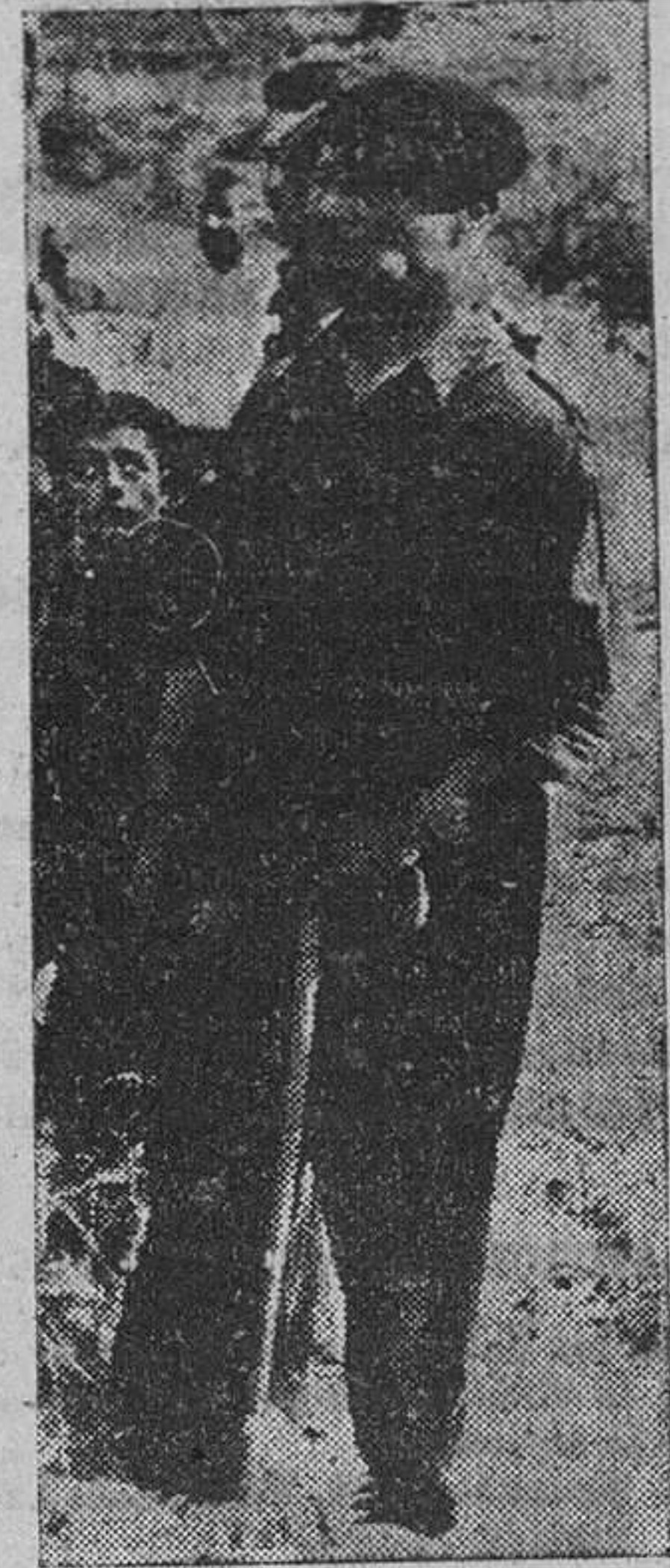
Con su camisa azul y apoyándose en la garra, este vecino de San Pedro de las Herrerías sigue, embebecido, el desarrollo del «Fuego de Campamento» con que se clausuró el primer turno en el soto de San Ignacio de Loyola, en presencia del delegado nacional del Frente de Juventudes y altas jerarquías provinciales.