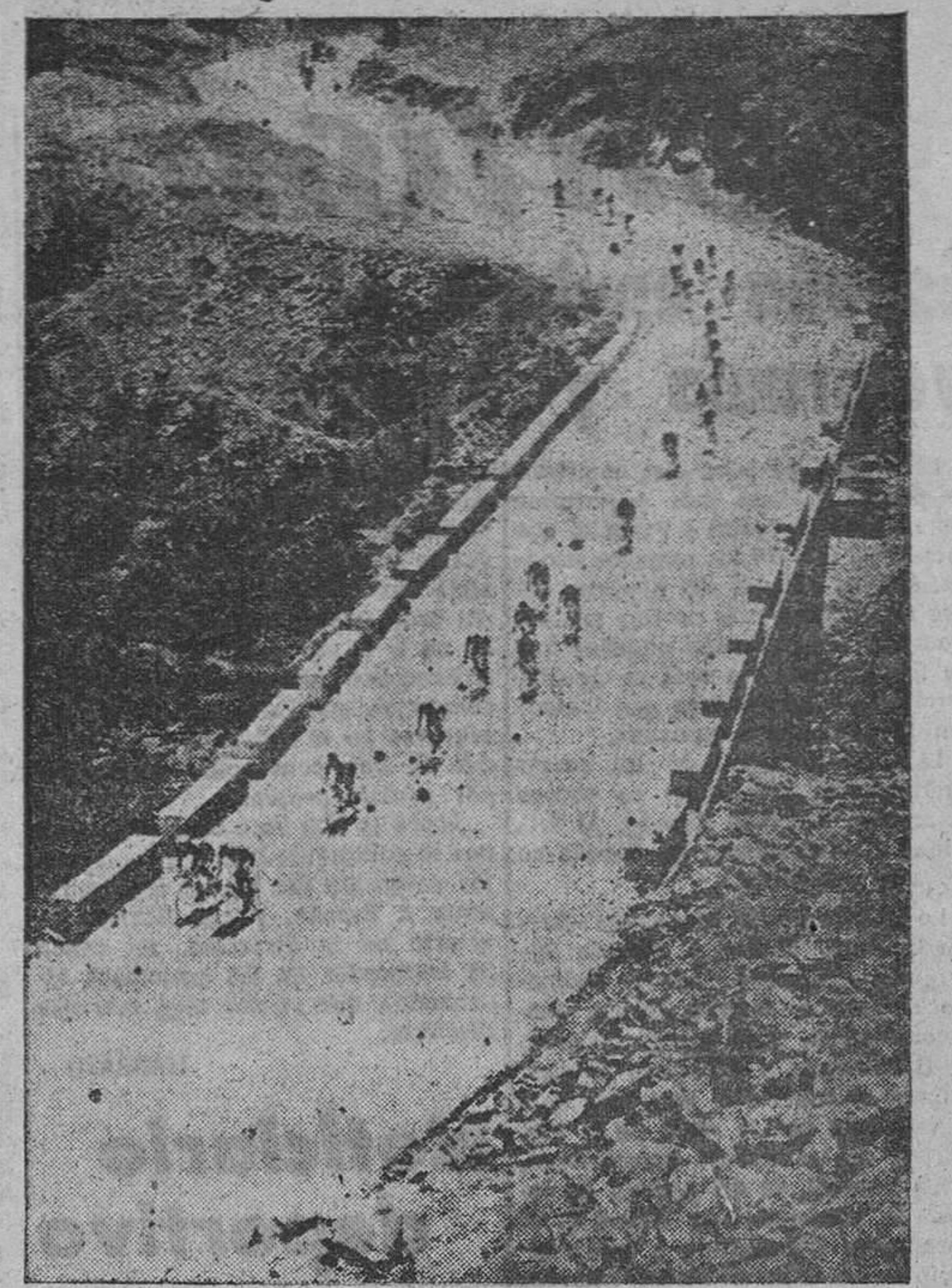
El ciclismo, deporte que sustituye ahora al fútbol en cuanto a la popularidad, tiene, al margen del esfuerzo que representa cabalgar sobre dos ruedas a fuerza de pedales, una innegable belleza, como puede demostrarse en esta foto correspondiente al Campeonato de España, fondo en carretera, tomada cuando el pelotón comenzaba a subir el puerto de Somosierra.

Lean a Pérez Madrigal en su obra «Memorias de un converso» (nueve tomos). Precio, 115 pesetas. «INSTITUTO EDITORIAL REUS». Preciados, 6 y 23. Madrid.