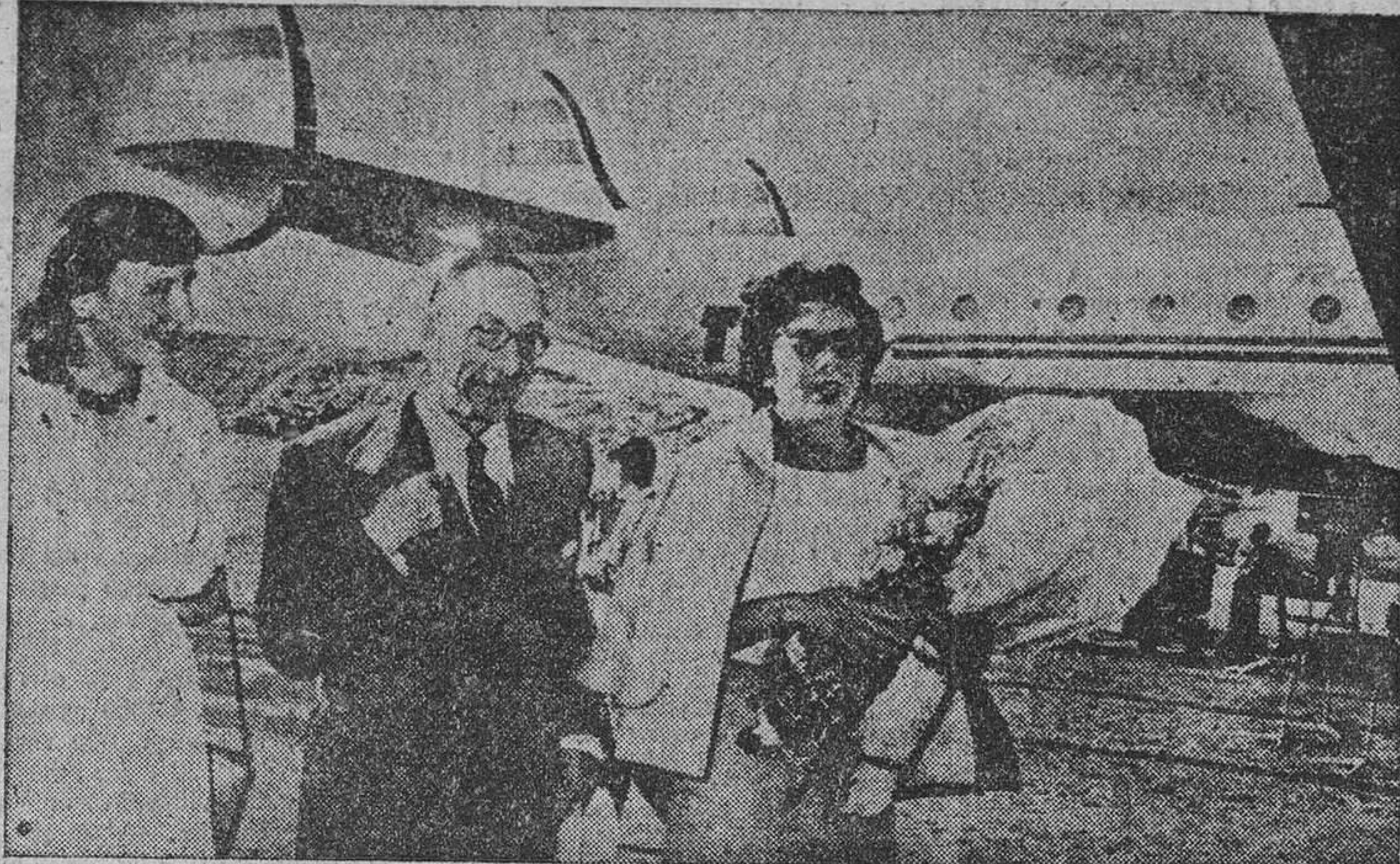
La famosa cantante chilena Rosita Serrano acaba de llegar a Madrid, apeándose en Barajas. Rosita, que viaja con pasaporte diplomático, fué recibida por el embajador de su país.