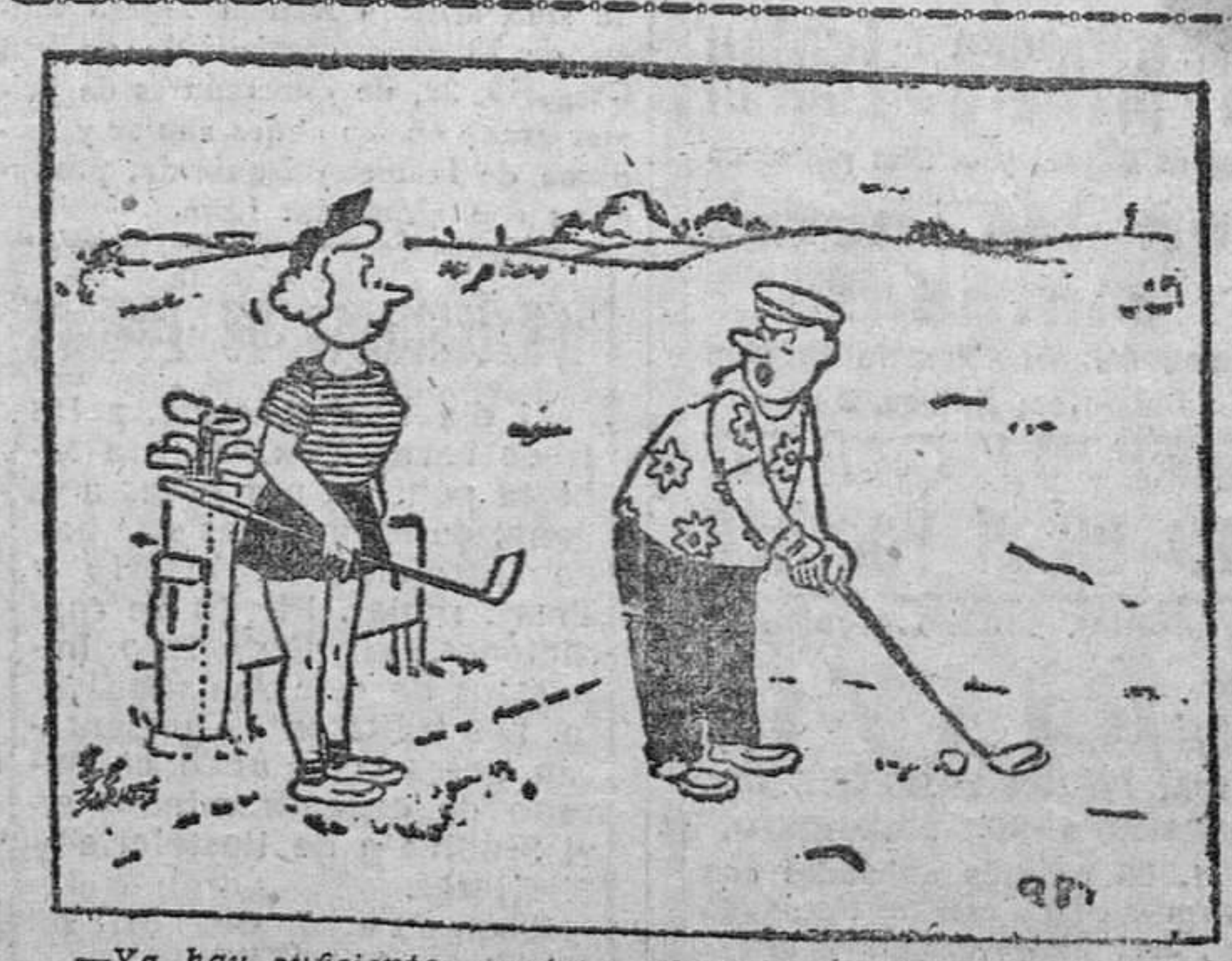
—Ya hay suficientes agujeros abiertos en el campo de golf. ¿No podrías cerrar esa boca?

Ciudad del Vaticano, 7.—"Osservatore Romano" publica un Decreto de la Sagrada Congregación del Santo Oficio sobre el ayuno eucarístico en la solemnidad de la vigilia pascual. El Decreto dispone: 1º Los sacerdotes que celebran la Misa de la vigilia pascual a medianoche, así como también los fieles que en ella comulgan, están obligados a observar el ayuno a partir de la misma noche, según los cánones 808 y 858 del Código del Derecho Canónico. 2º Si la Misa de vigilia se celebra antes de la medianoche, los fieles están obligados a observar ayuno, según lo establecido en la constitución "Christi Dominus", es decir, de tres horas para las comidas sólidas y de una hora para líquidos no alcohólicos. Hoy mismo aprobó Su Santidad el Papa la decisión de la Sagrada Congregación ordenando su publicación. Como se recordará, la celebración nocturna de la vigilia pascual fue autorizada por Decreto de la Sagrada Congregación de Ritos.—Efe.