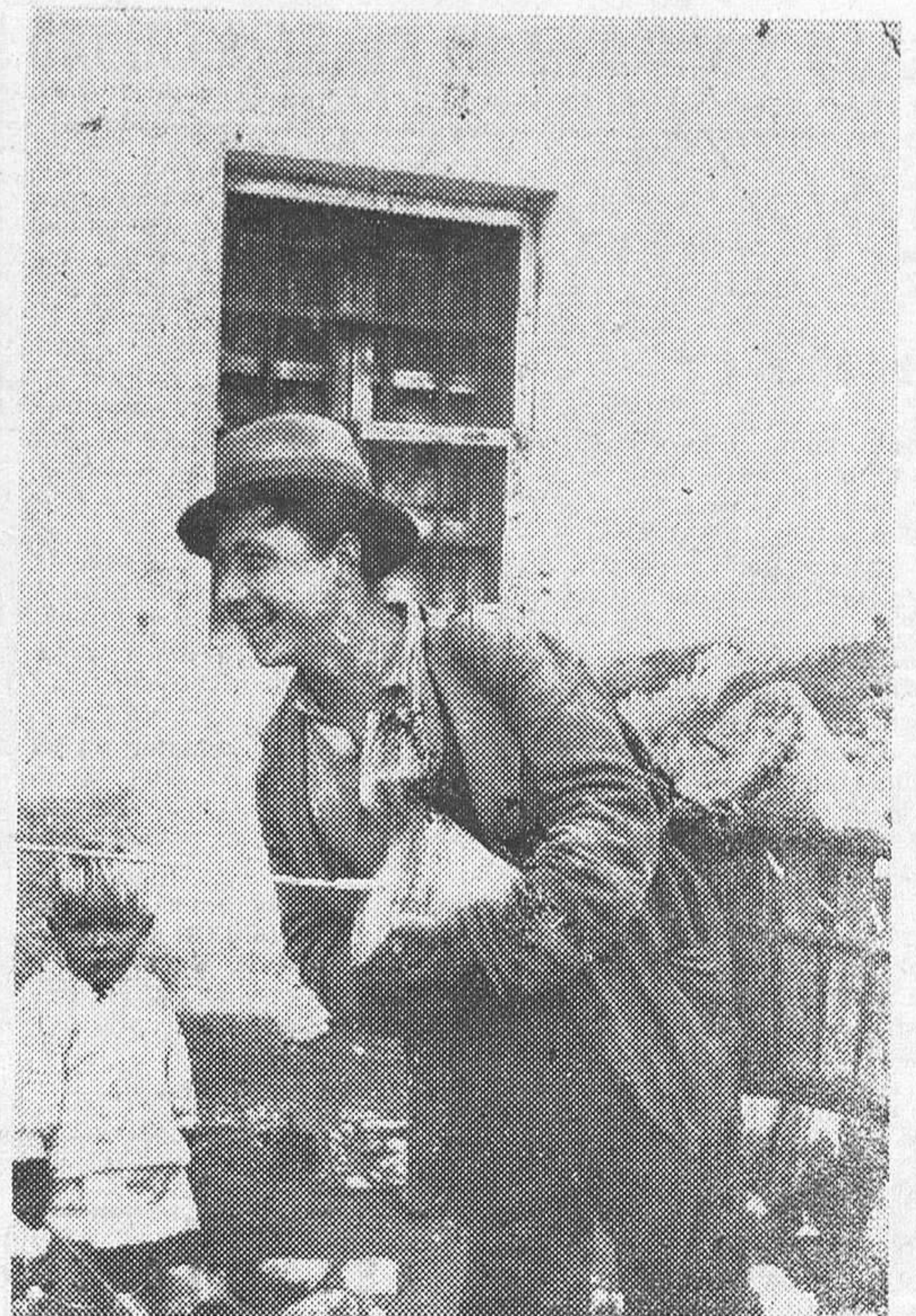
Sin la zambomba, parece que faltaría algo esencial en las fiestas navideñas. Los vendedores empiezan a pregonarla por nuestras ciudades, y ahí tienen ustedes a este adelantado "llevando el instrumento", que él mismo construyó, en los arrabales de la capital granadina.