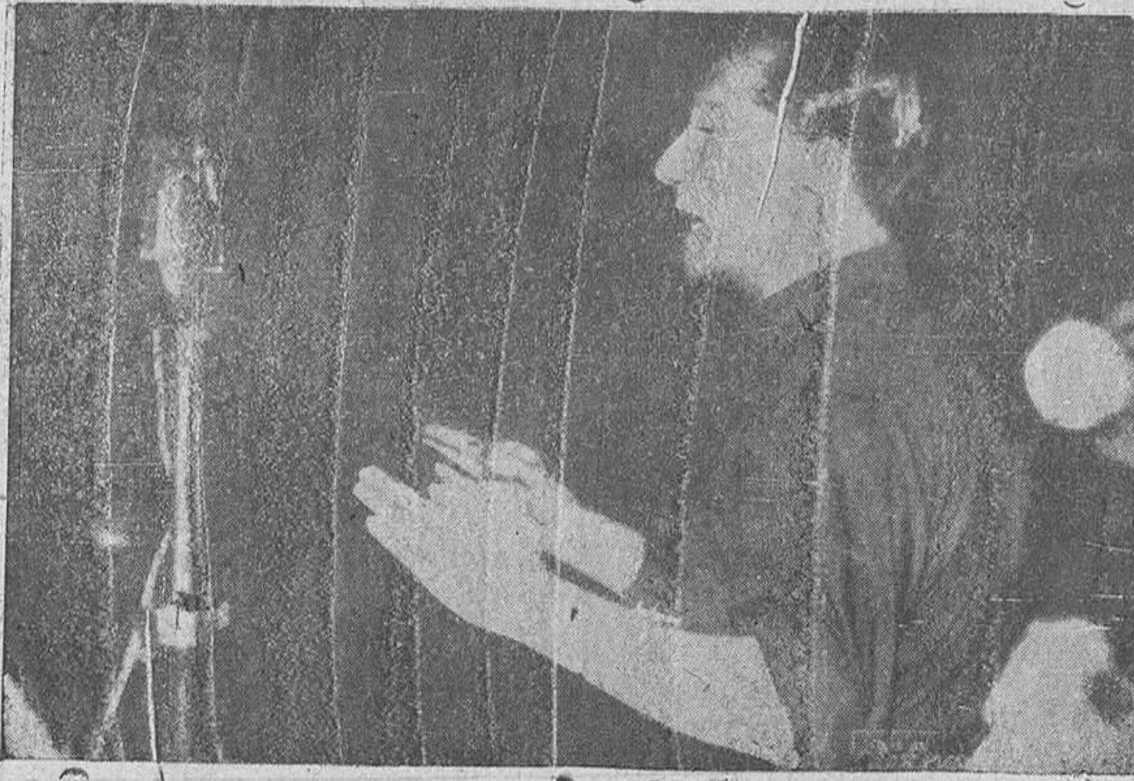
En tercera página insertamos el texto íntegro del discurso fundacional pronunciado por José Antonio el día 29 de octubre de 1933 en el Teatro de la Comedia de Madrid.