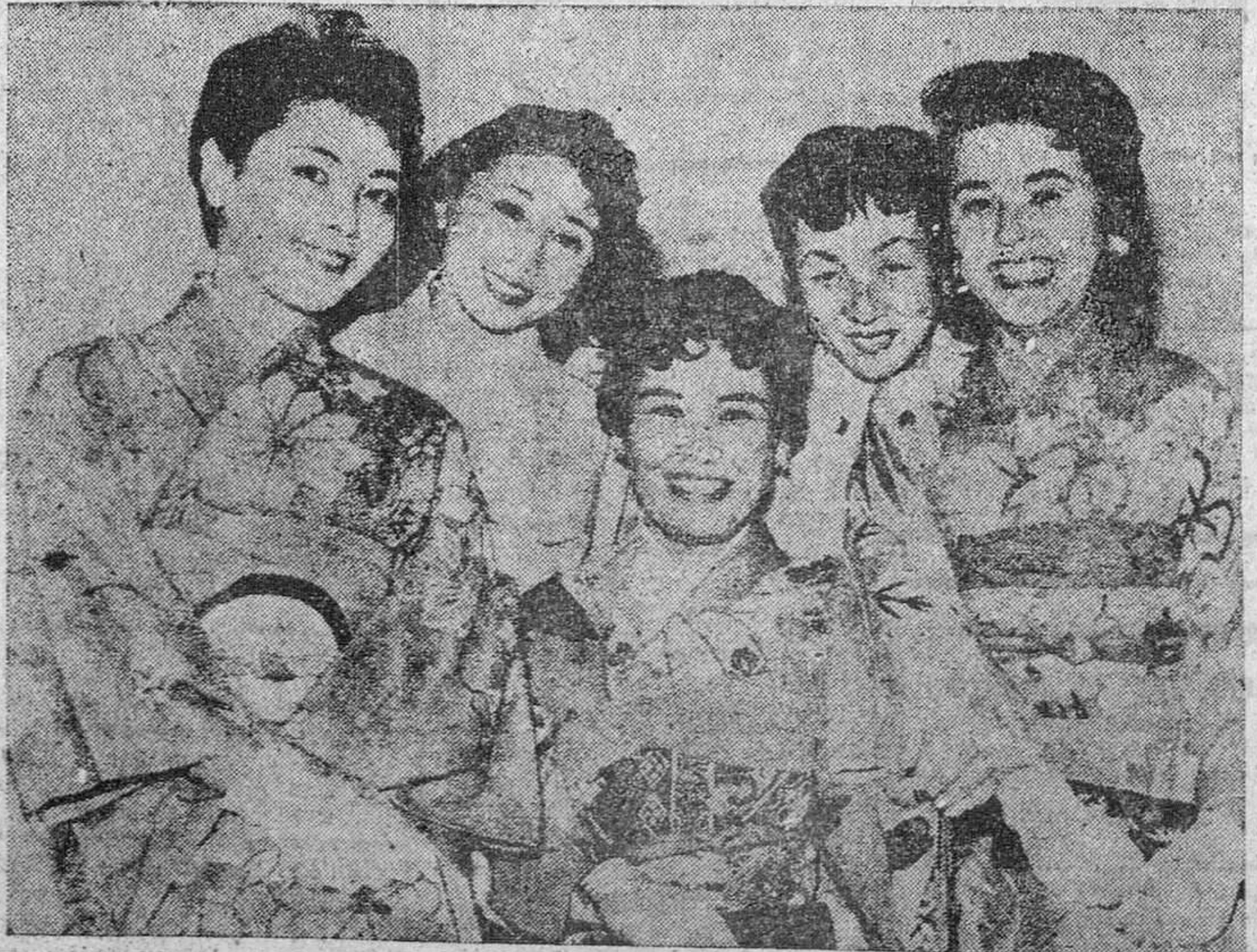
Esta puede ser la divisa de este grupo de jóvenes japonesas que han llegado a Londres para seguir un cursillo de aspirantes a azafatas. No creemos que el quimono sea mañana su uniforme de vuelo. Pero hace bonito.