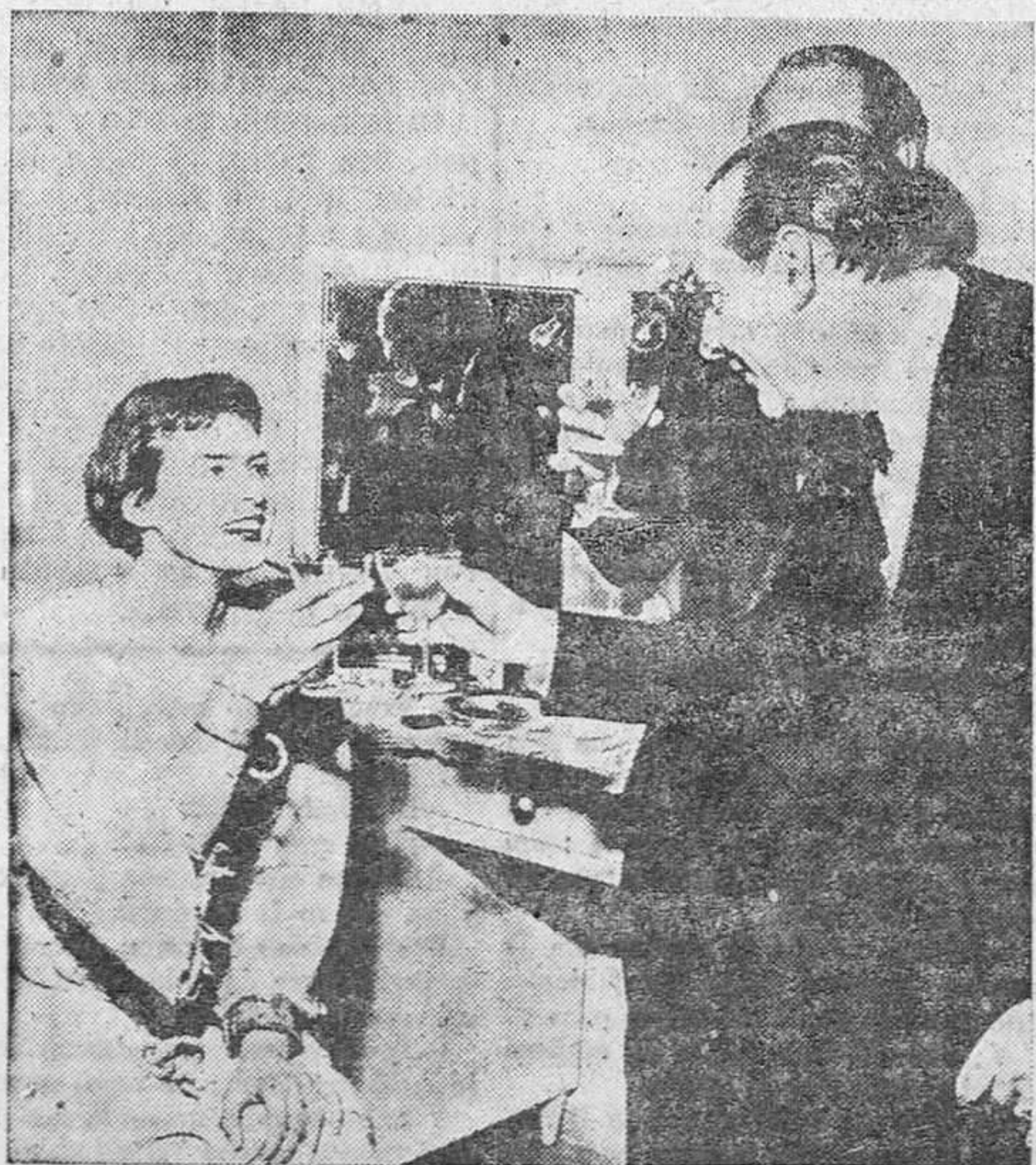
Rosellini y su esposa Ingrid Bergman.

Roberto Rossellini ha fijado su partida para la India a primeros de año. El marido de Ingrid Bergman