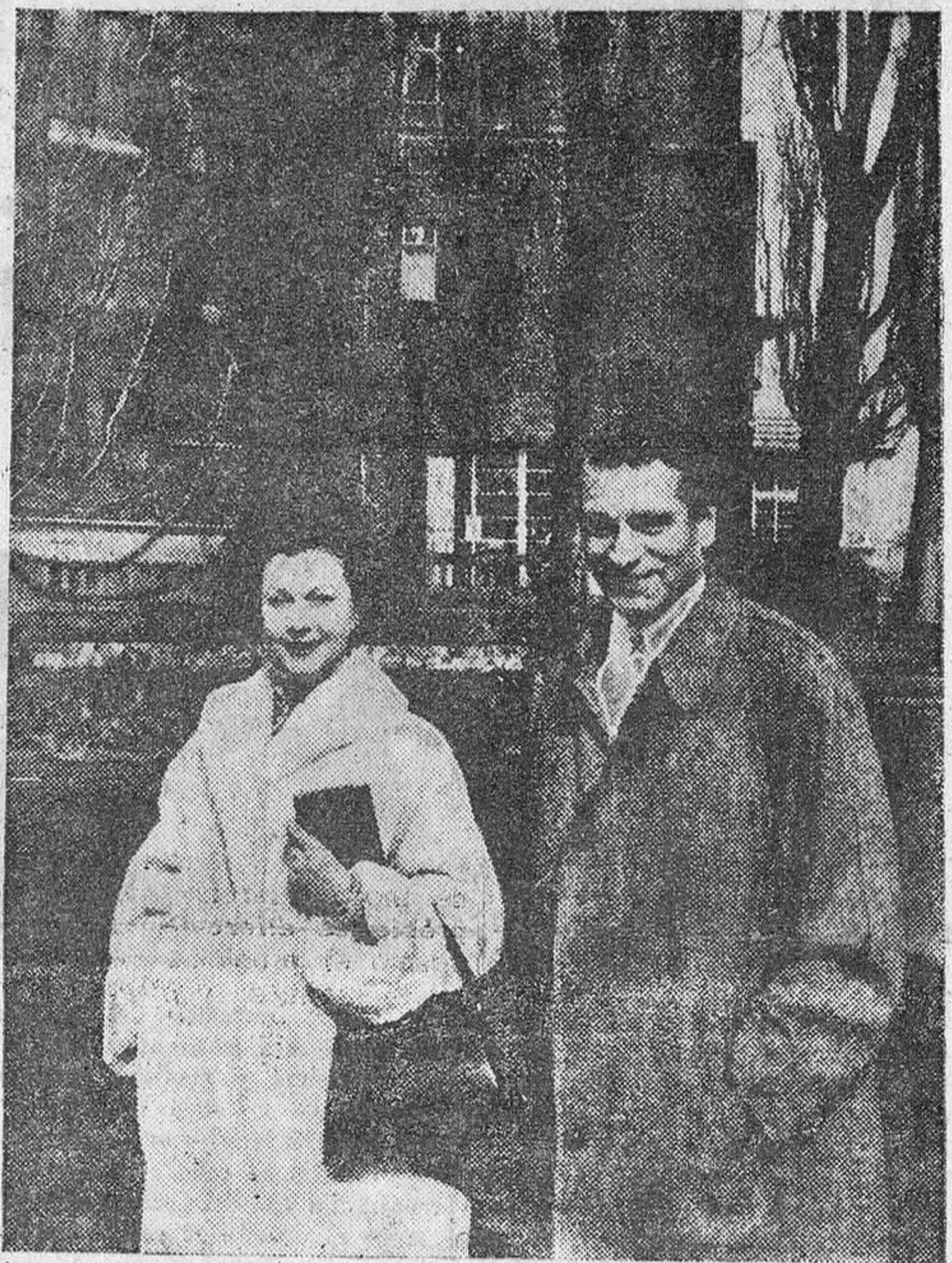
Vivien Leigh y Laurence Olivier.

He aquí la edad oficial de algunos de los actores más populares del cine: Fred Astaire, 55 años; Ingrid Bergman, 38; Laurence Bacall, 31; Walter Pidgeon, 57; Charlie Chaplin, 66; Claudette Colbert, 50; Gary Cooper, 54; Joan Crawford, 47; James Mason, 46; Gre-