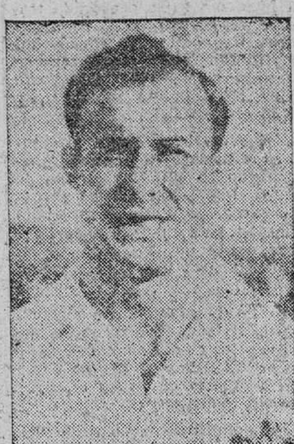
Un nuevo caso se planteará para el fútbol español en el organismo internacional, pues al parecer el «Perpignan» ya ha tramitado una denuncia concreta a la Federación para que sea cursada a la F.I.F.A. Se trata del caso César, cuyo expediente tomara carta de naturaleza en el organismo federativo dentro de pocos días, si no lo ha tomado ya. Hace algunos meses, a consecuencia de una visita del presidente del «Perpignan» a Barcelona, señor Sabater, de acuerdo con la Directiva del C. de Fútbol Barcelona, el entonces jugador azulgrana suscribió contrato por el club francés.

convenio para que firmara por la «Cultural Leonesa», y al parecer se limitó a solicitar del «Perpignan» la anulación del contrato sin que accedieran los directivos del club francés a las pretensiones de César.