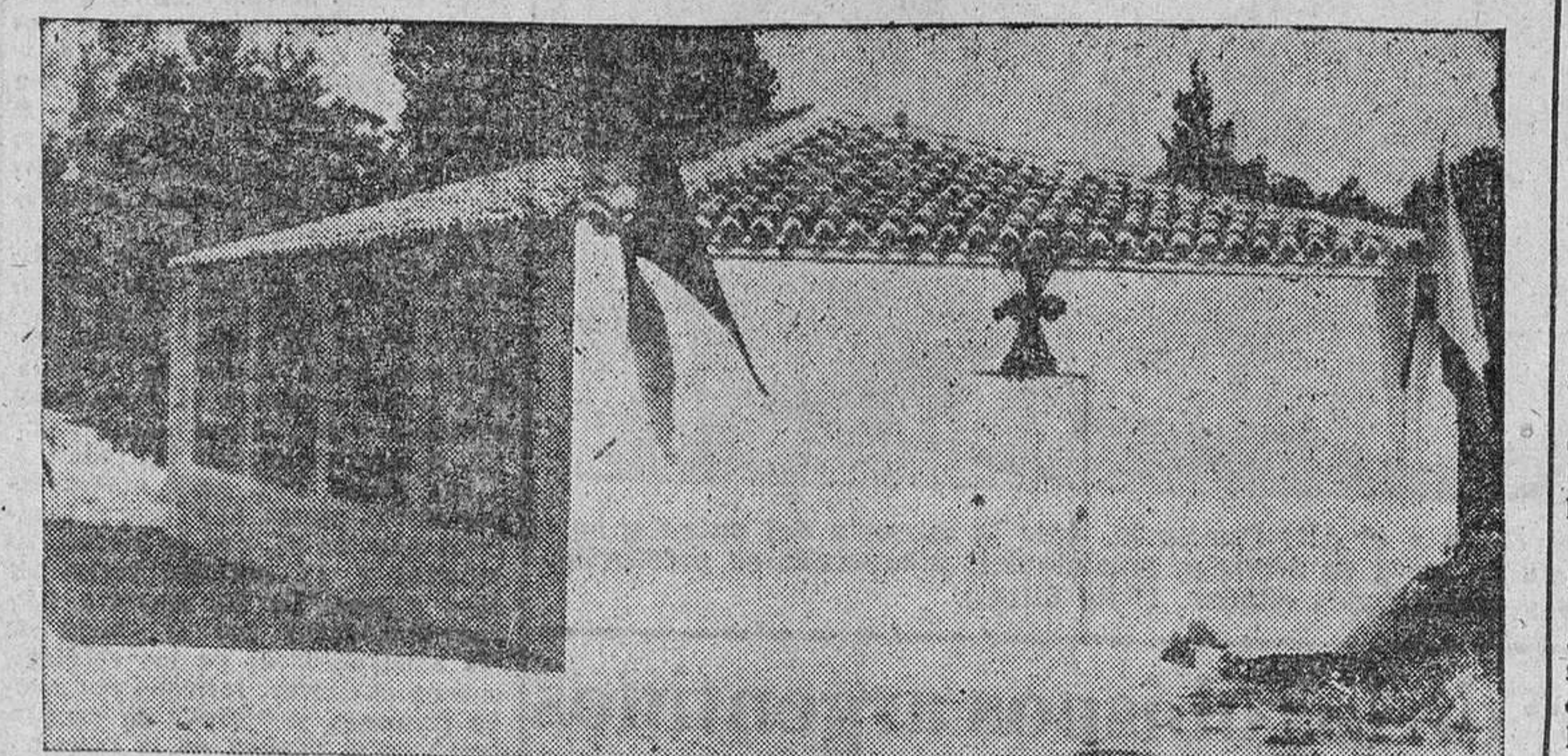
LAVADEROS PUBLICOS/CUBIERTOS. (Foto Juanes.)

Peleas de Arriba es uno de esos pueblos patrocinados por la Obra Social de la Falange. Allí existía un abastecimiento de agua en deficientes condiciones de servicio. En poco tiempo se hicieron las reparaciones oportunas y al mismo tiempo se cubrieron los lavaderos, con un sólido y arroso edificio, para lo cual recibió Peleas una subvención de cerca de treinta mil pesetas, con lo que el pueblo apenas si tuvo que poner otra cosa que la presencia personal. Pero el lugar donde naciera San Fernando tiene otras necesidades—Centro Rural de Higiene, teléfono, etc.— que pueden y deben satisfacerse sin más que entregarse de lleno a la tarea, poniendo a contribución voluntad, entusiasmo y, sobre todo, promoviendo entre los vecinos esa inquietud que es capaz de remover los más fuertes obstáculos en aras de la colectividad y de la prosperidad del pueblo. Mas para conseguir esto es menester también aprovechar al máximo las posibilidades, procurando que no se pierdan en una política cicatera y mezquina que frene la marcha ascendente que, a impulsos del Movimiento Nacional, siguen la casi totalidad de los pueblos de España.