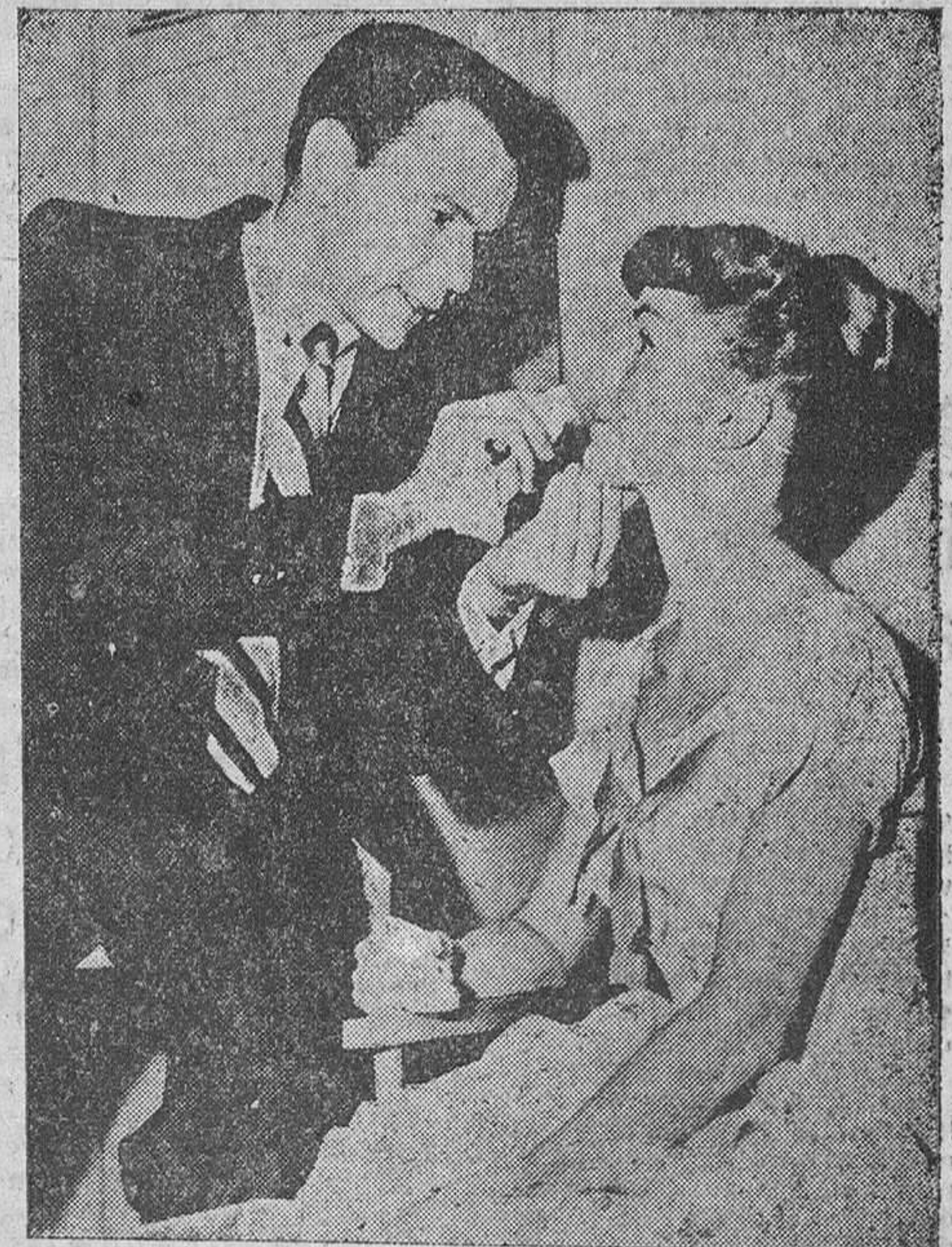
Frank Sinatra se muestra muy comedido con Debbie Reynolds mientras los dos esperan ser llamados a escena para la película de la Metro "The Tender Trap", donde comparten honores con David Wayne y Celeste Holm.