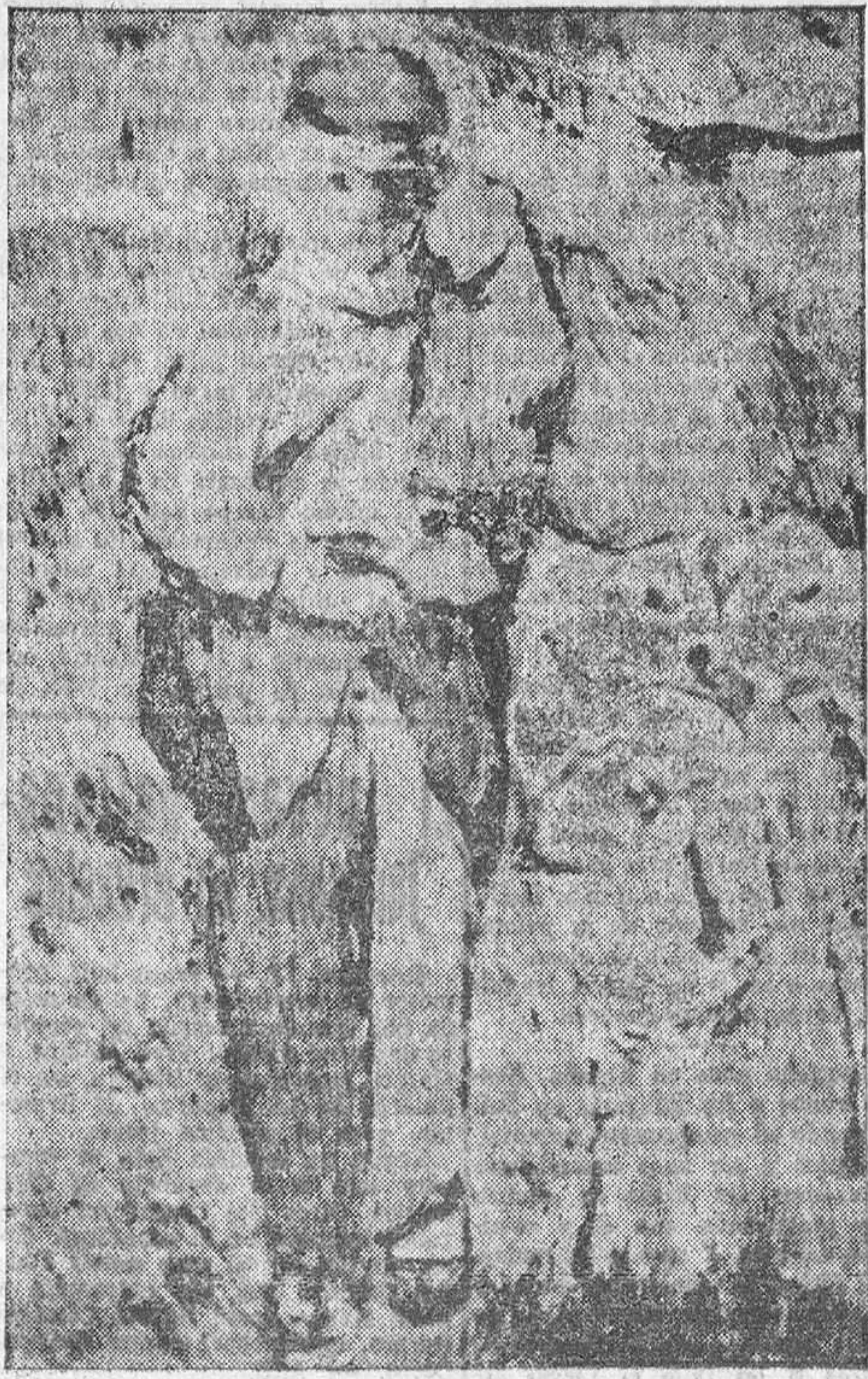
La figura es otro de los motivos de la reciente obra de Modesto Ciruelos en la que figuran labores de recolección y estampas bucólicas.

Su obra está realizada bajo una tendencia expresionista ibérica. Es un periodo más de su marcha pictórica, una fase nueva dentro del expresionismo que ya manifestó al público en anteriores facetas. Lleva esta obra de Ciruelos una mayor