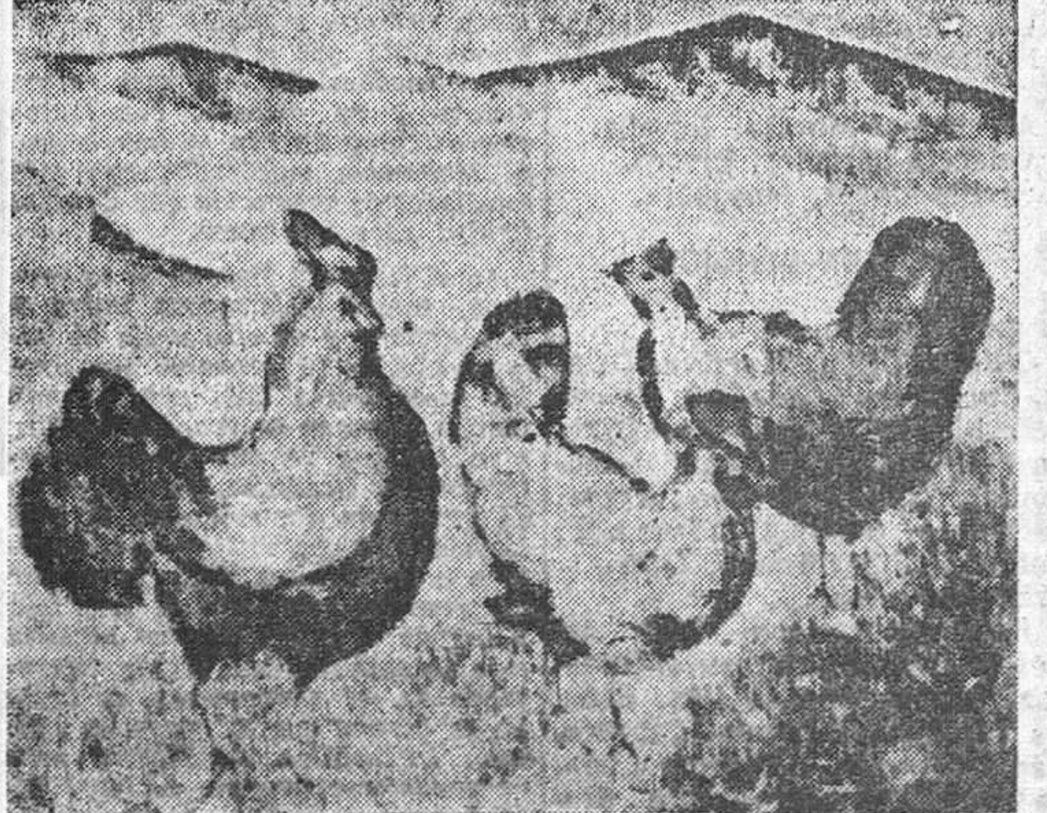
Estampas campestres de Ciruelos a las que habría de añadirse el magnífico dominio del color: para que el lector apreciese la fuerza expresiva de la obra.