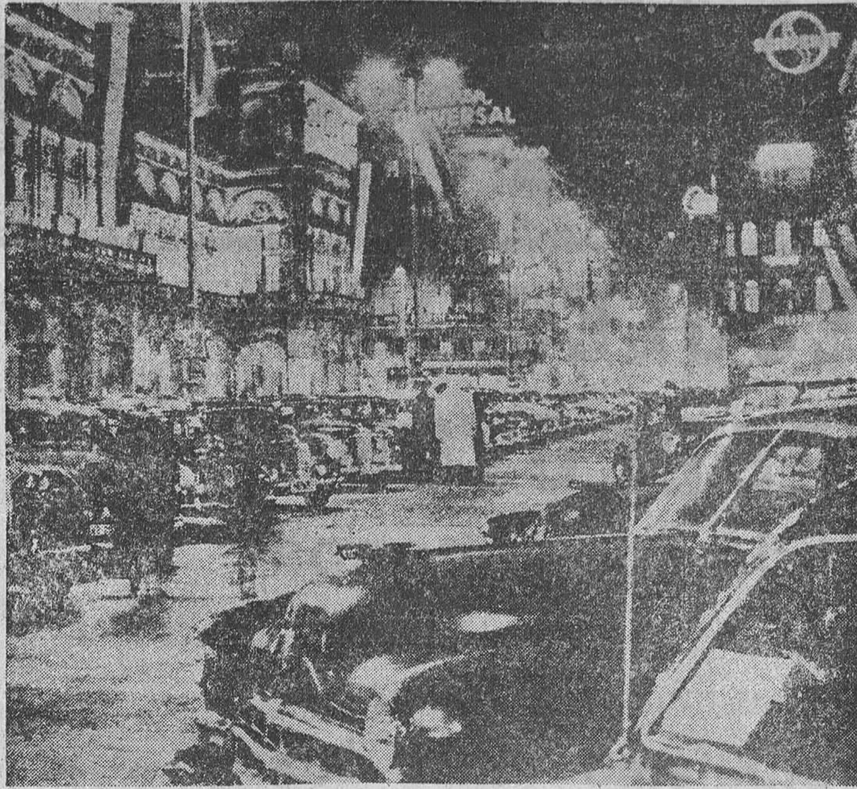
Los vieneses no quisieron que volviera a funcionar la Opera de la ciudad más musical del mundo hasta que los rusos dejaron de ocupar su patria. La noche de la inauguración, Viena ofrecía este magnífico aspecto en los alrededores del teatro reconstruido, cuya fachada vemos en primer término.