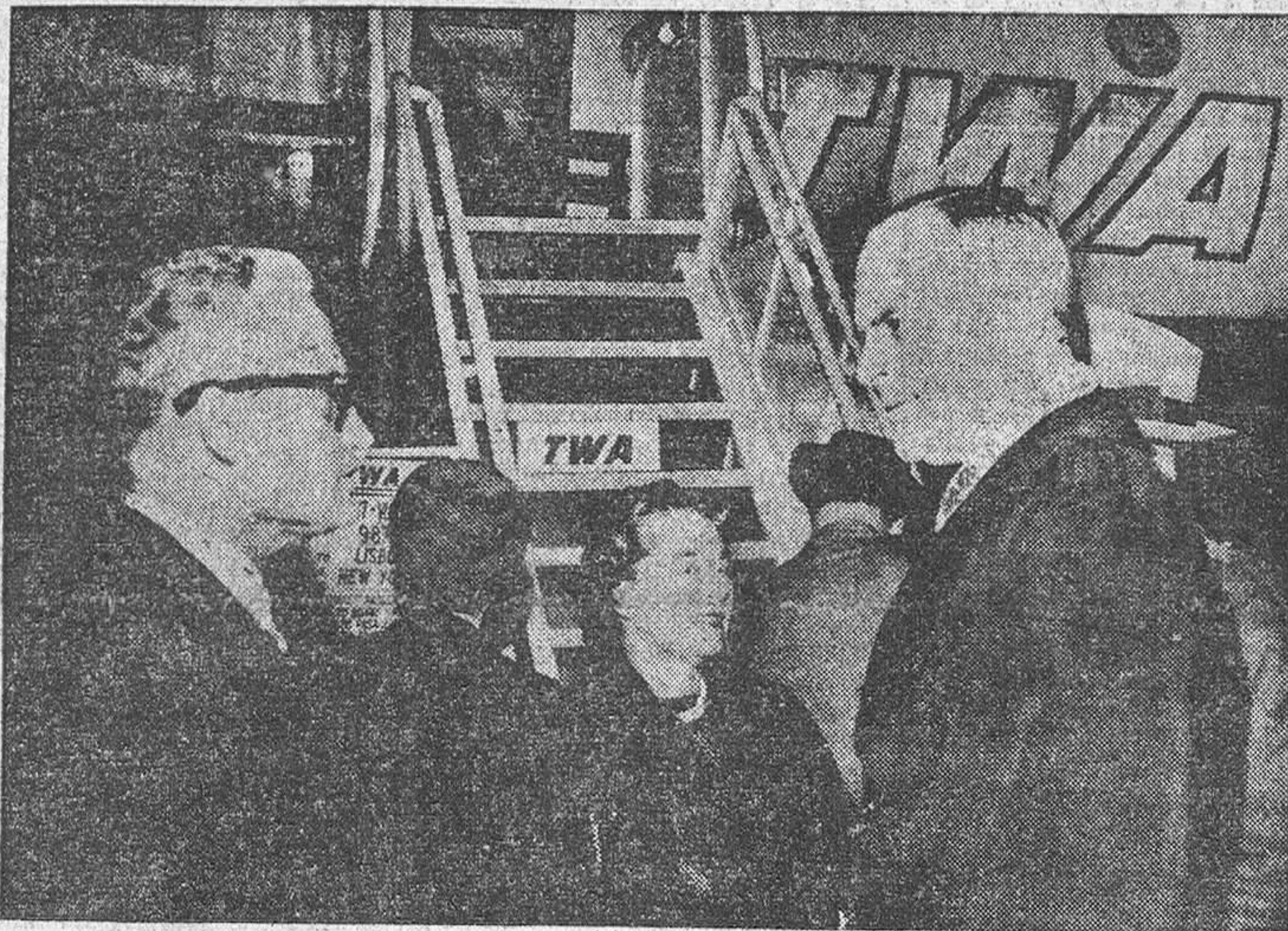
MADRID.—El senador por el Estado de Arizona, Barry Goldwater, a su llegada al aeropuerto de Barajas, donde fué recibido por el embajador de los Estados Unidos en España, Mr. Lodge.