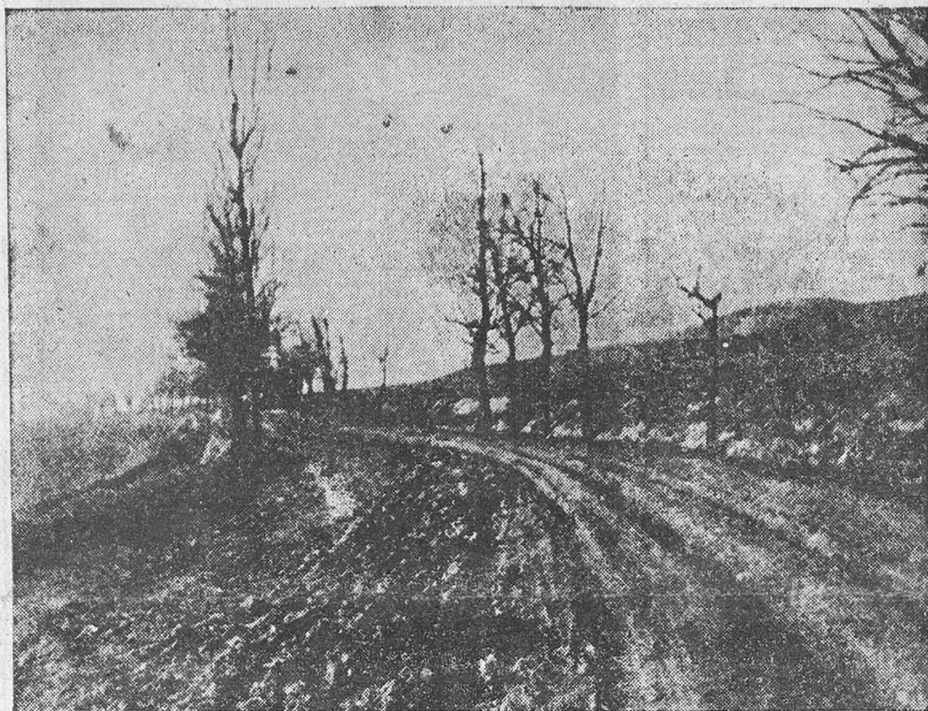
Tipo escenario de octubre y, mejor, del otoño en los campos castellanos.