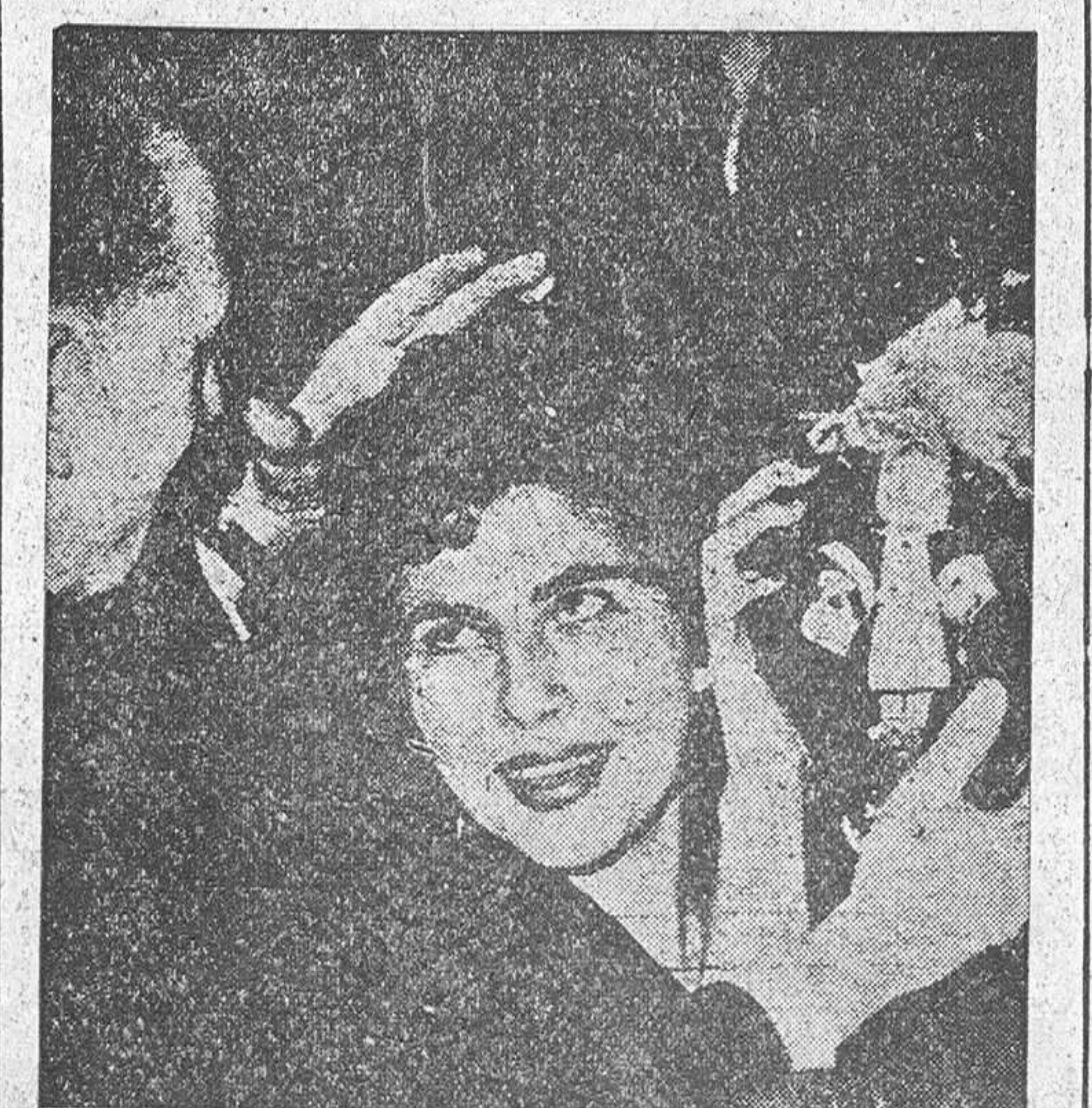
Teherán, 22.—La emperatriz Soraya ha regresado a Teherán después de pasar unas vacaciones en Europa. Fue recibida por el Sha, miembros del Gobierno y numerosas personalidades.