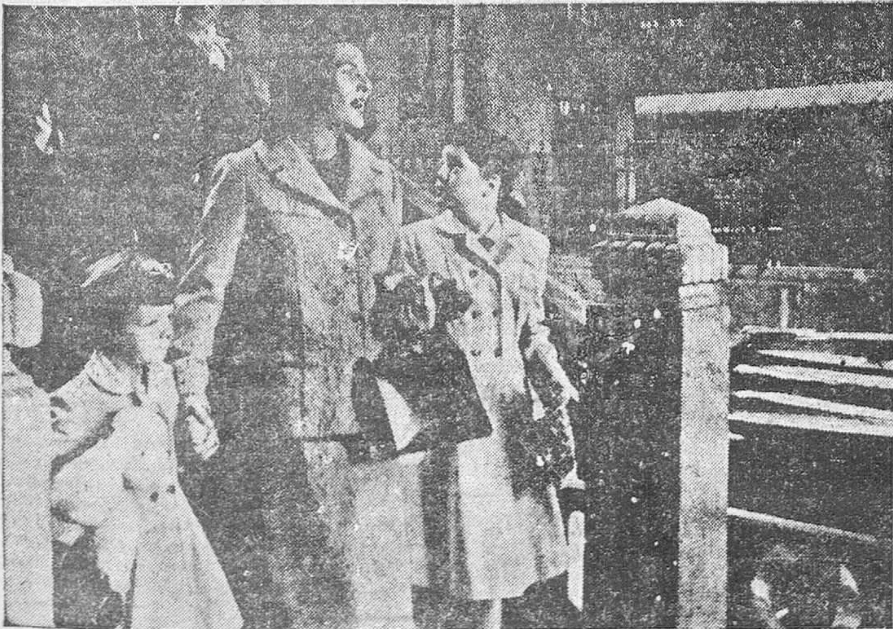
Rita Hayworth sale con sus hijas de su residencia en París

—Sí—le respondió—, pero desearía por lo menos que usted no llamara a la puerta metiendo tanto ruido.