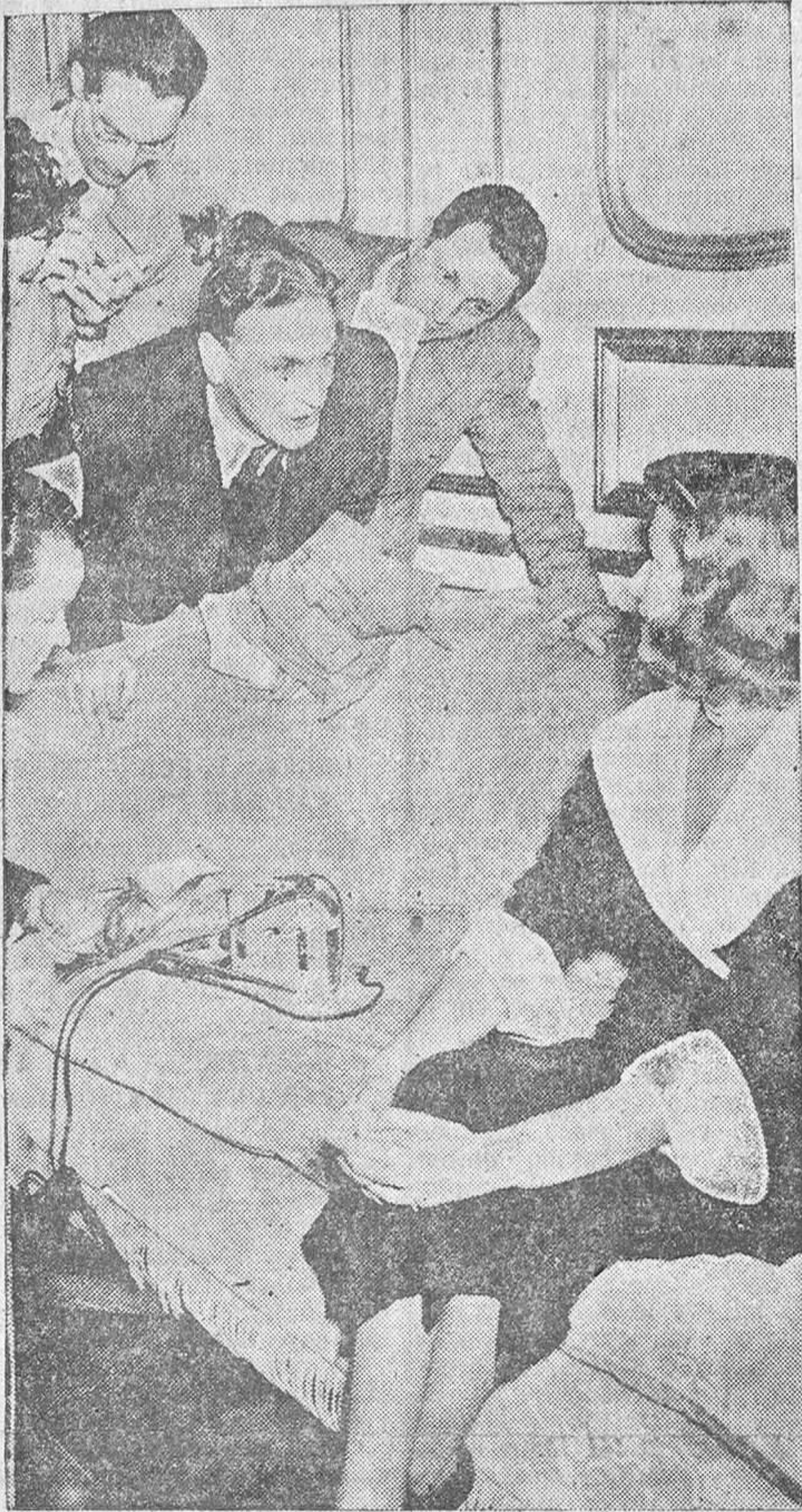
La estrella habla con los periodistas, pero no dice nada importante. Ella es como es y hace lo que quiere...

popularidad, y un golpe escénico de esta clase podía servir para recuperarla.