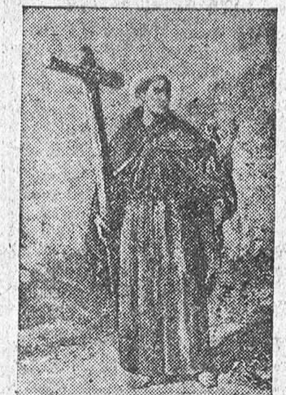
El año 1499 nació en Alcántara, villa de Extremadura (España), San Pedro, hijo de un hábil jurista, consultor y corregidor del pueblo. Inclinado desde sus primeros años a la piedad, era propuesto por sus maestros como modelo de virtud a sus compañeros. A los diecisiete años entró en la Orden de San Francisco, de Asis, empuerado una vida de penitencia asustísima, que sólo comía una vez cada tres días y aun poco uchi sin probar bocado; dormía hora y media y por espacio de cuarenta años tomó este descanso de rodillas o sentado arrodinado la cabeza a la pared; a raíz de su carne traía asperisimos cilicios y comía a b. sangrientas disciplinas. Contó más a los veinticuatro años y fué nombrado superior. Observó pobreza extrema, pureza angelical y humildad sincera, renunciando el ser confesor del emperador Carlos V. Inspiró el Señor que reformase la Orden franciscana; comenzando en el angustioso convento del Pedregal, la reforma, que luego se propagó rápidamente. Concedió el Señor el don de contemplación y el de milagros: no pocas veces veíase arrojado en éxtasis, pasar caudalosos ríos a pie enjuto, procurar celestias provisiones a los religiosos, hacer florecer un seco bastón como magnífica higuera; poseía el don de profecía. En el convento de Arenas murió a los sesenta y tres años, apareciéndose a Santa Teresa y diciendo: "Bendita penitencia, que me ha merecido tanta gloria".

DIA 19 DE OCTUBRE San Pedro de Alcántara, franciscano