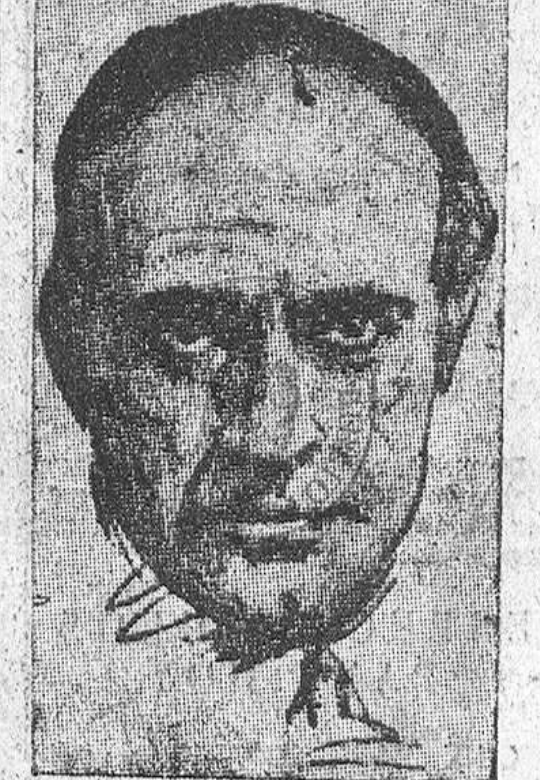
hallaba en coma. Su vida se fue extinguiendo dulcemente.