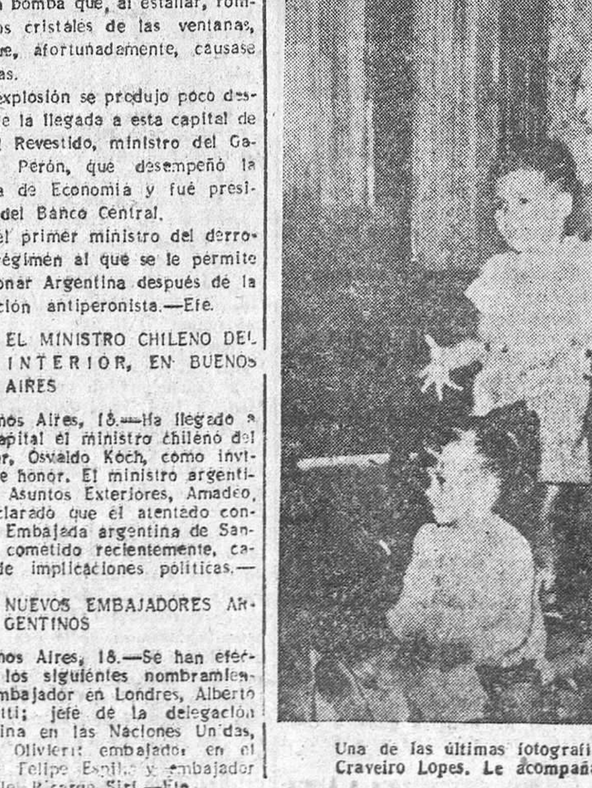
Una de las últimas fotografías del Presidente de la fraterna República de Portugal, general Craveiro Lopes. Le acompañan su esposa y sus nietos. El Presidente portugués es esperado en Inglaterra.