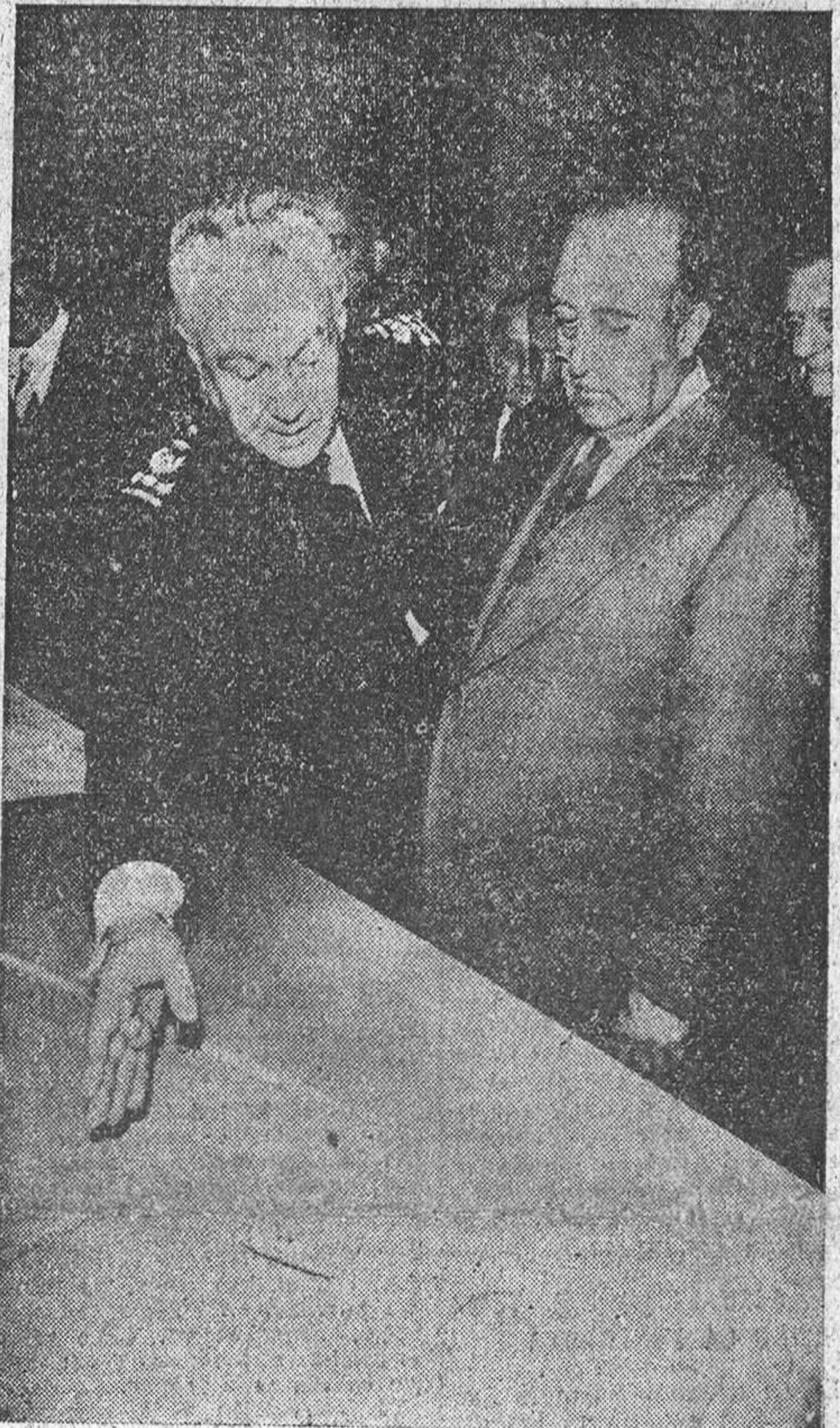
BARCELONA.—Su Excelencia el Jefe del Estado, acompañado de varios ministros del Gobierno y otras personalidades, examina la maqueta del proyecto de modernización del puerto de esta capital.

Muchas gracias, mi general. El Generalísimo, después de estrechar nuevamente la mano a sus visitantes, pasó a su despacho, acompañado del general