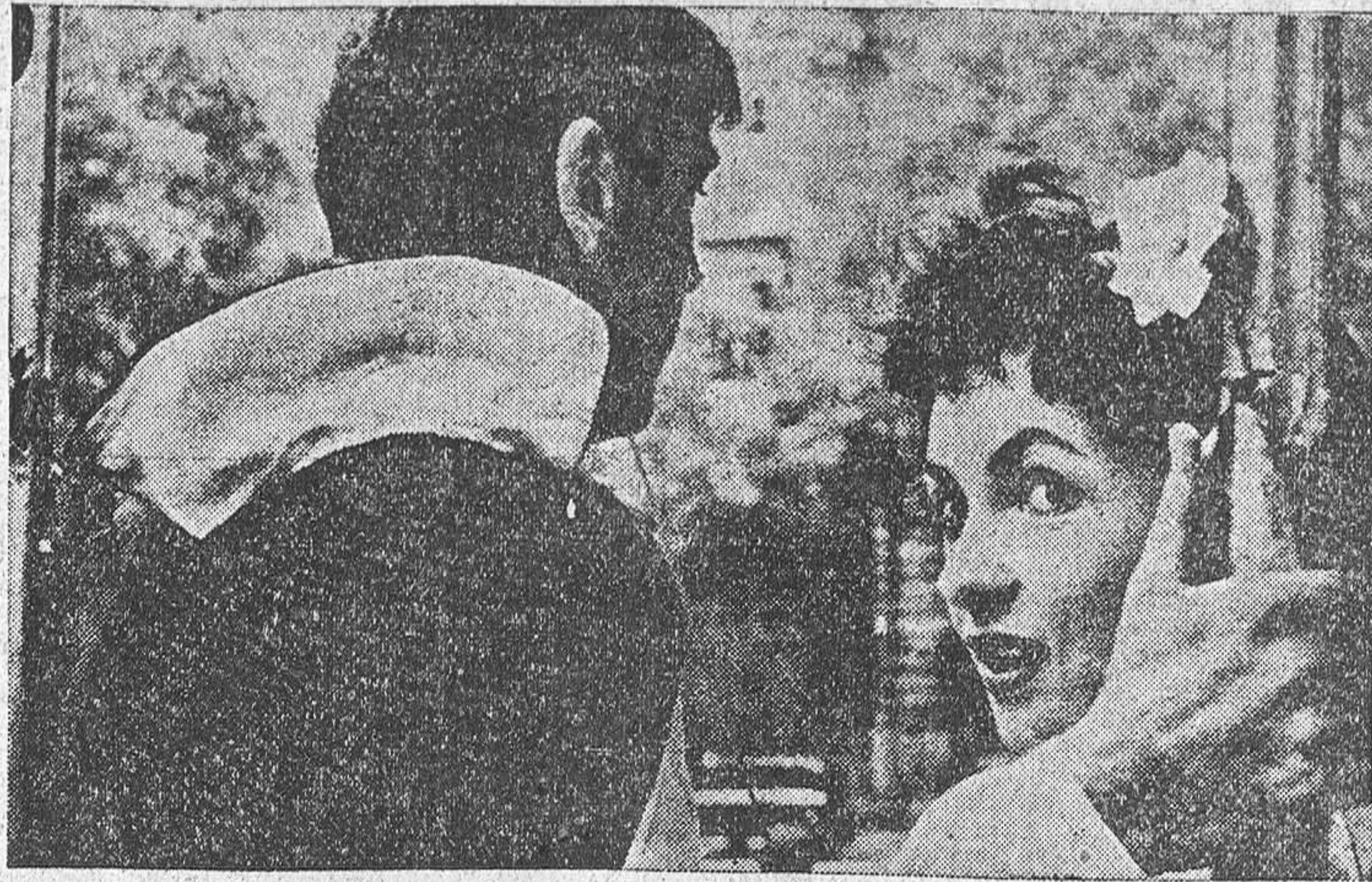
Gina Lollobrigida y Burt Lancaster durante el desfile propagandístico organizado por las Calles de París días antes de comenzar el rodaje de "Trapecio".

Para ser feliz lo principal es acertar en la elección, dice la Lollobrigida