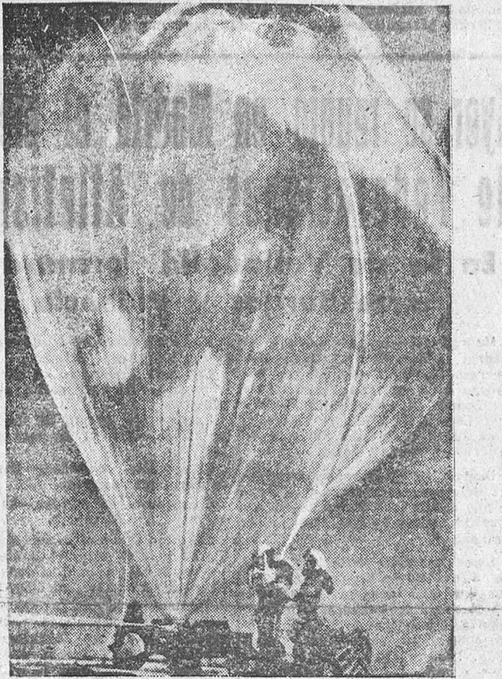
En la base aérea de Lowry (Colorado) ha sido lanzado este globo de 55 metros de altura, lleno de gas polioileno. Está destinado a experimentos meteorológicos y se asegura que ayudará a predecir el tiempo.