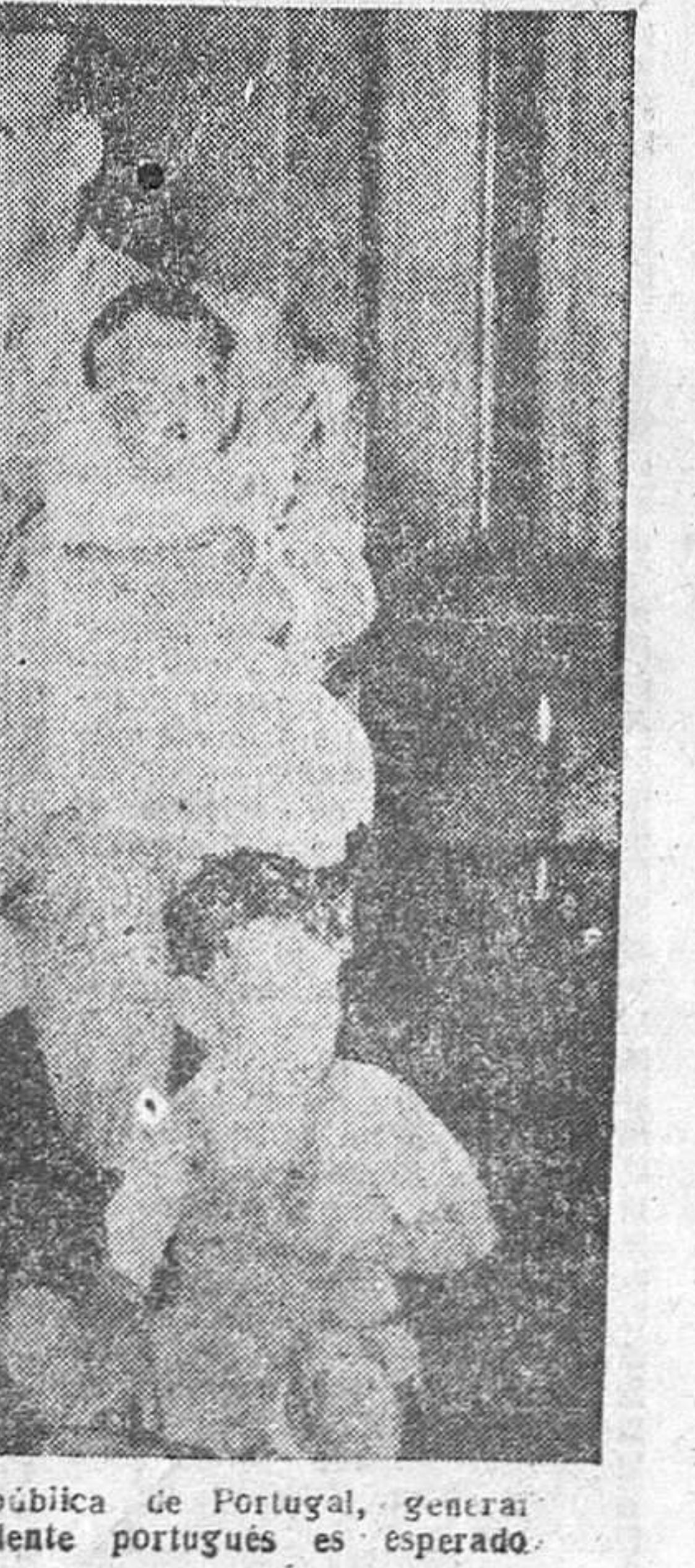
Una de las últimas fotografías del Presidente de la fraterna República de Portugal, general Craveiro Lopes. Le acompañan su esposa y sus nietos. El Presidente portugués es esperado en Inglaterra.