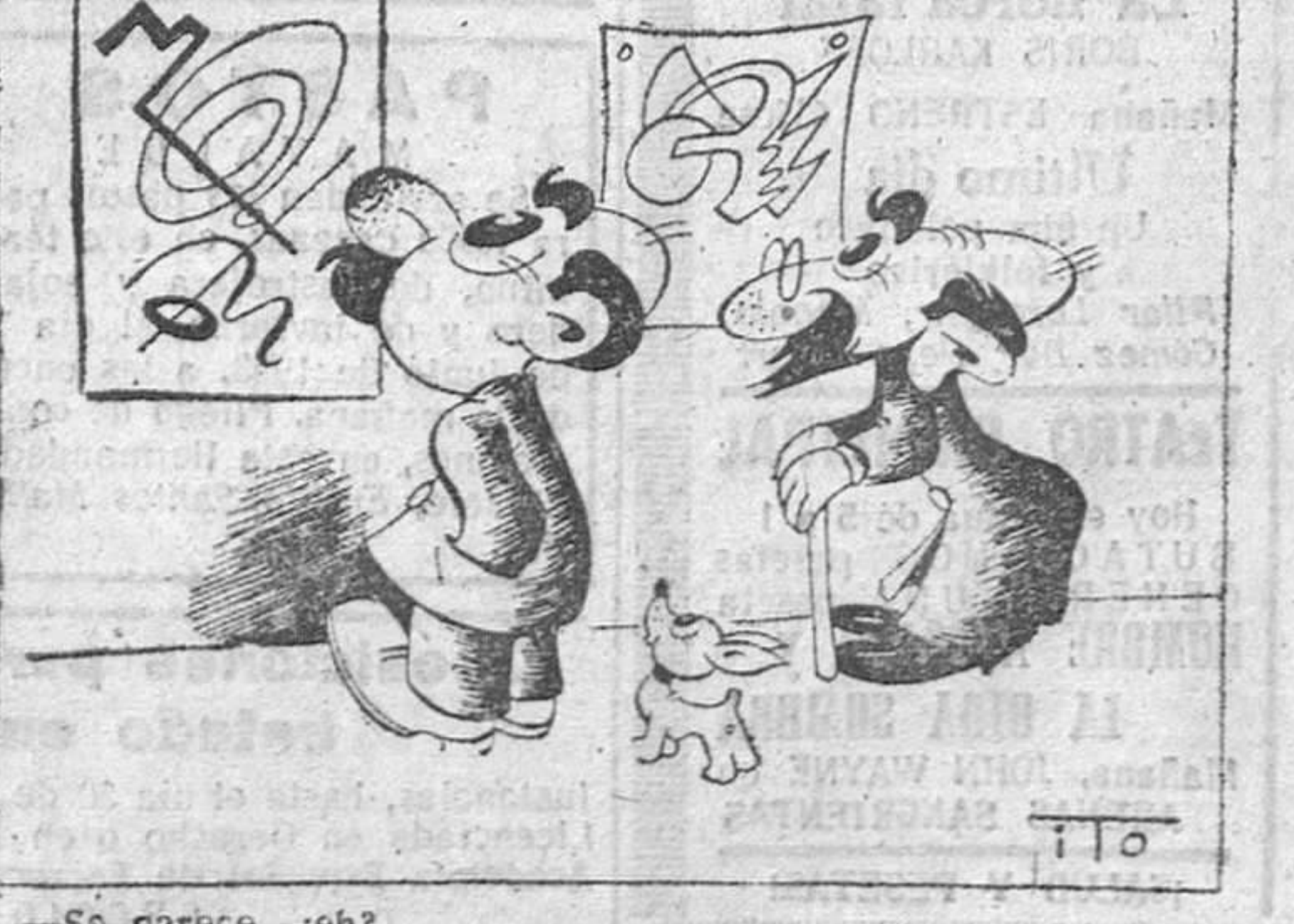
—Se parece, ¿eh? —Si; se parece... que el autor no tenía nada que hacer.