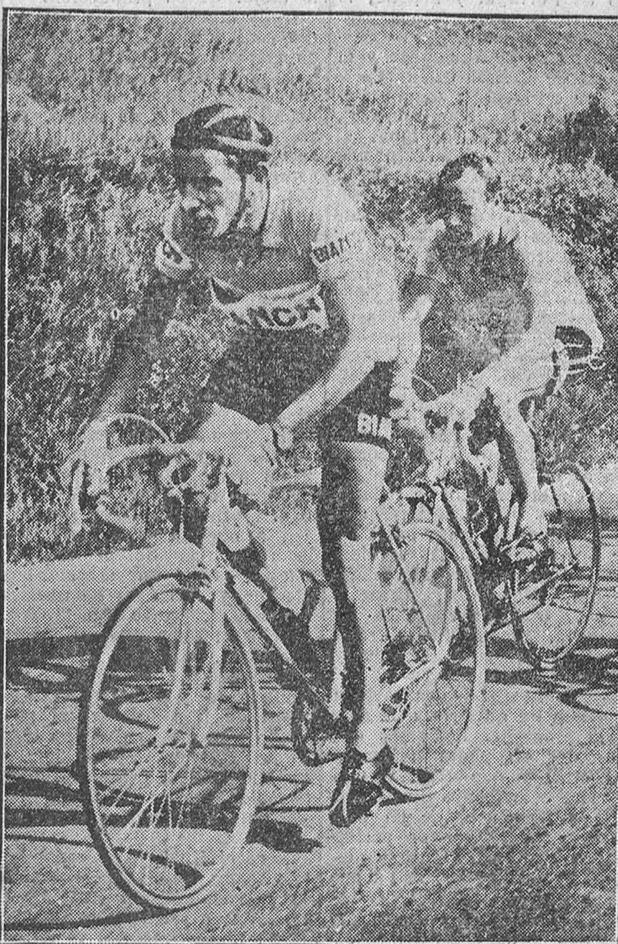
LUCHA ENTRE COPPI Y KOBLET. MODENA.—El "mariscal" Coppi, seguido del suizo Koblet, "general en jefe" de la Vuelta a Italia al finalizar la décima etapa, corrida bajo la fórmula de contra el reloj.