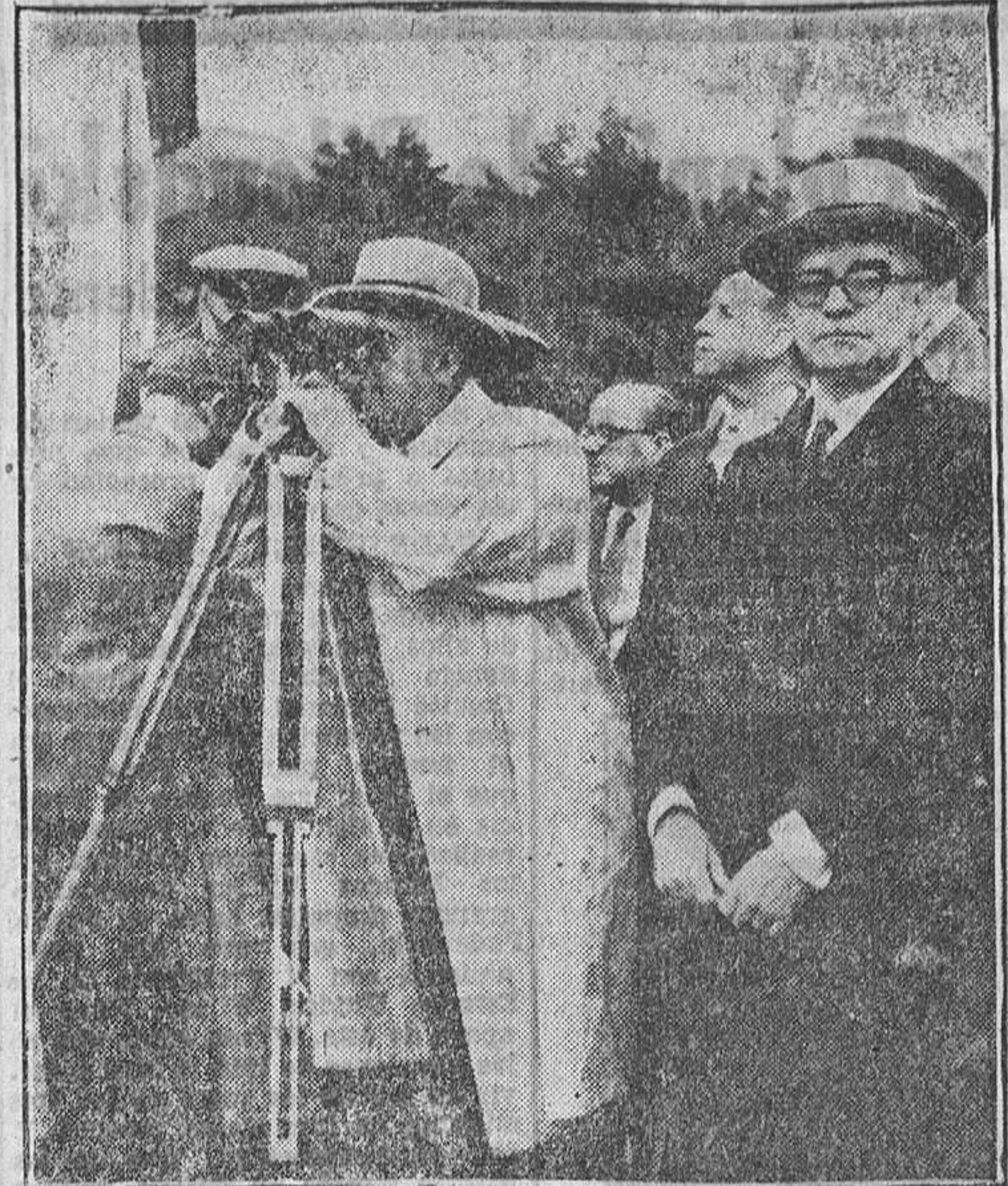
Guadarrama.—Su Excelencia el Jefe del Estado sigue a través de los prismáticos la operación fumigadora de una zona de 25 hectáreas de pinos, en Guadarrama, por cuatro avionetas.