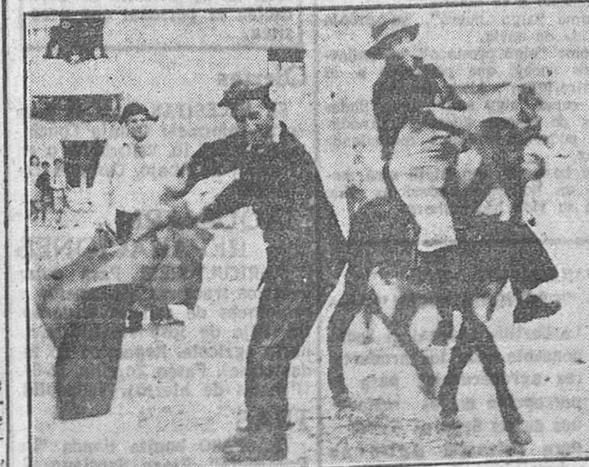
Ayer dimos información de las fiestas de Amusquillo. Esta fotografía recoge un momento de la parodia de corrida de toros...

¿Tú deseas unos espléndidos festejos? Estos cuestan mucho dinero. Contribuye con tu donativo a su realización.