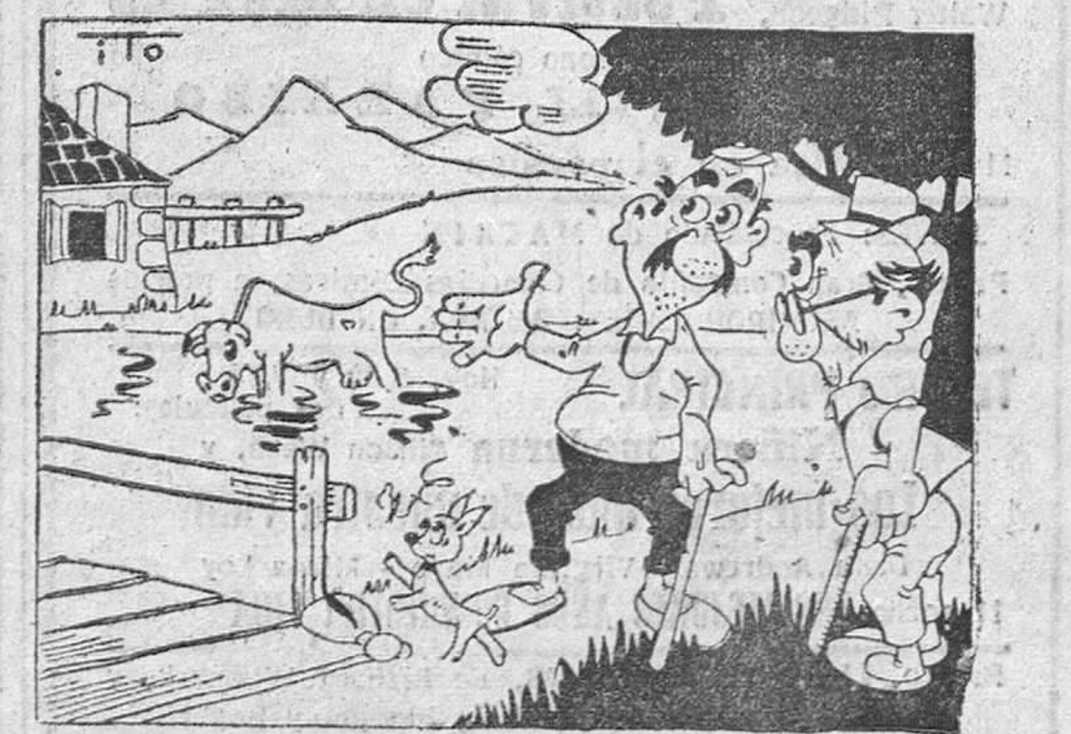
¿Ve usted? ¡Cómo no va a tener agua la leche!