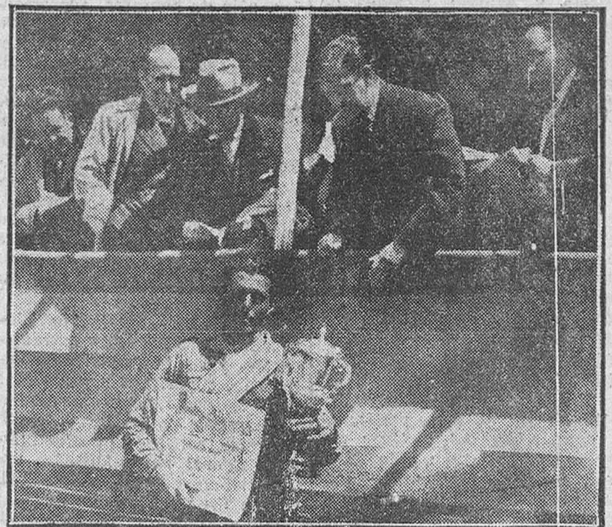
El campeón provincial de arada luciendo la banda, la copa y el diploma que acaba de entregarle el Gobernador Civil.