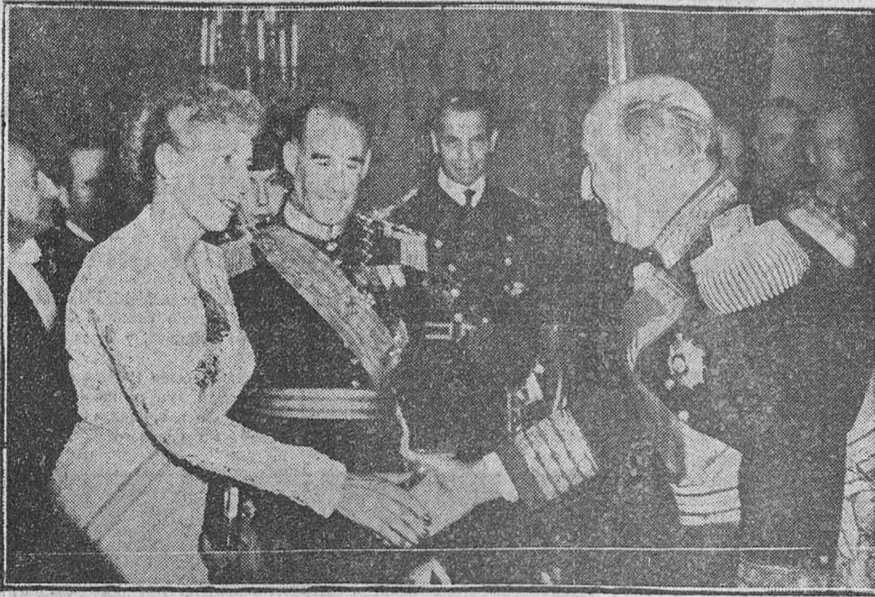
EL PARDO.—Su Excelencia el Jefe del Estado, Generalísimo Franco, saluda a la esposa del Presidente portugués, momentos después de imponerla la Gran Cruz de Isabel la Católica.