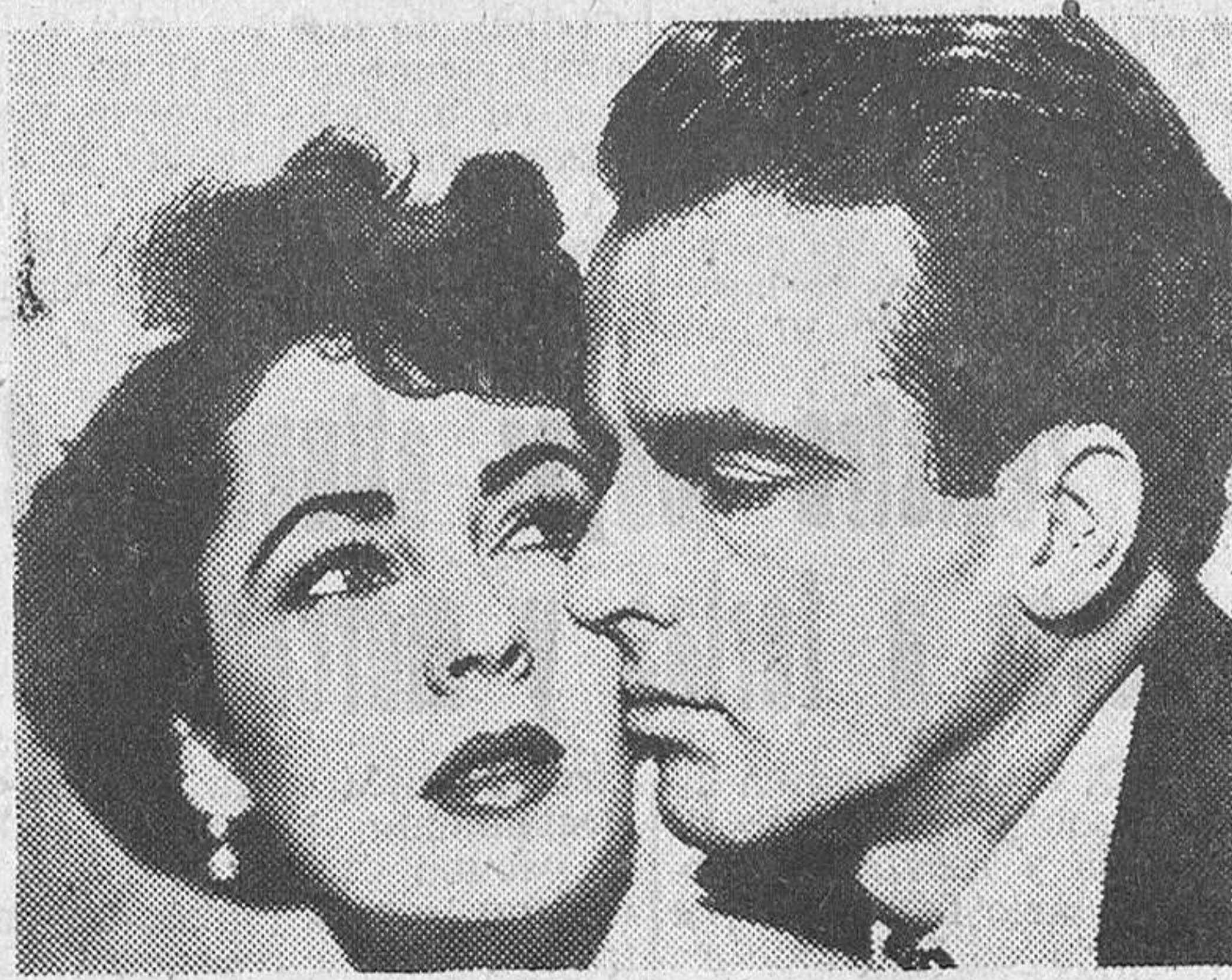
Elizabeth Taylor y Montgomery Clift en una escena de "Un lugar en el sol", la maravillosa superproducción Paramount, seis veces premiada por la Academia de Hollywood, que esta tarde se estrena en el Cine Barrueco, presentada por "Mercurio Film"