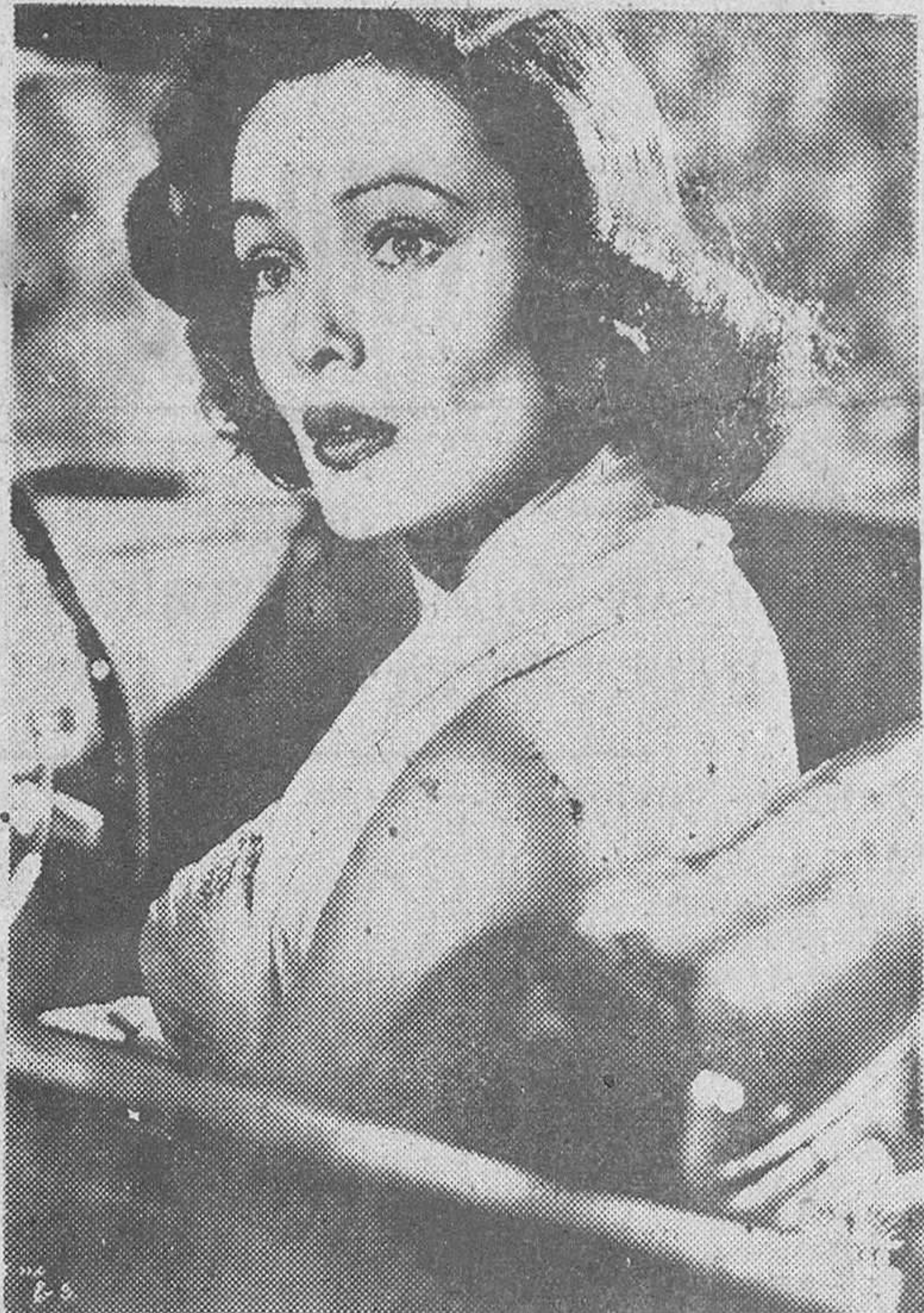
Un primer plano de la bellissima Cine Tierney, elegantísima como de costumbre, en la divertidísima superproducción "Casado y con dos suegras"

Edgar Neville nos ha ofrecido en "Duende y misterio del flamenco" una buena antología de música