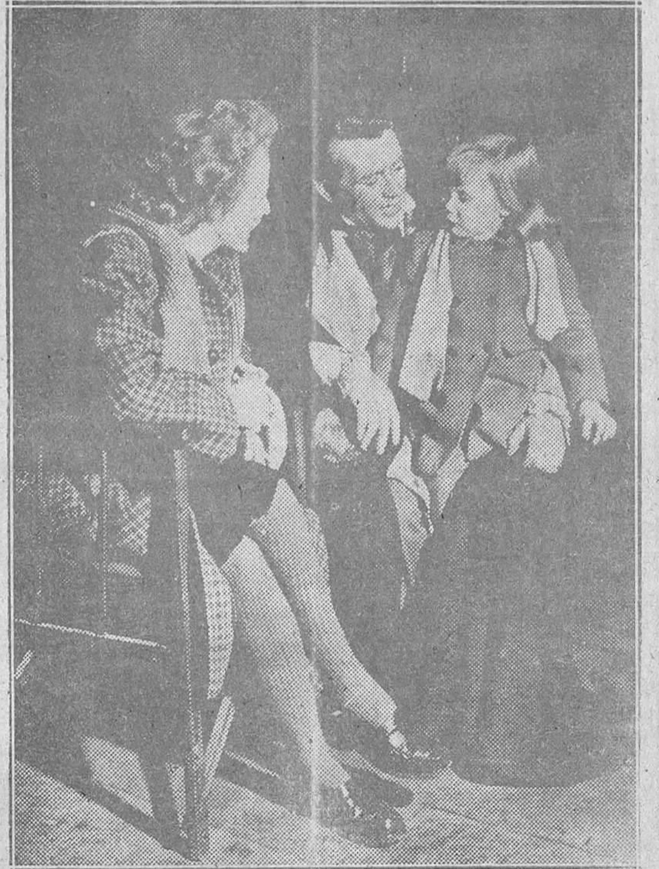
GARY COOPER, con su esposa e hija.

Las películas italianas presentadas en 1952 han sido de excepcional calidad. Todas ellas podrían ser filiadas al neorealismo. El ci-