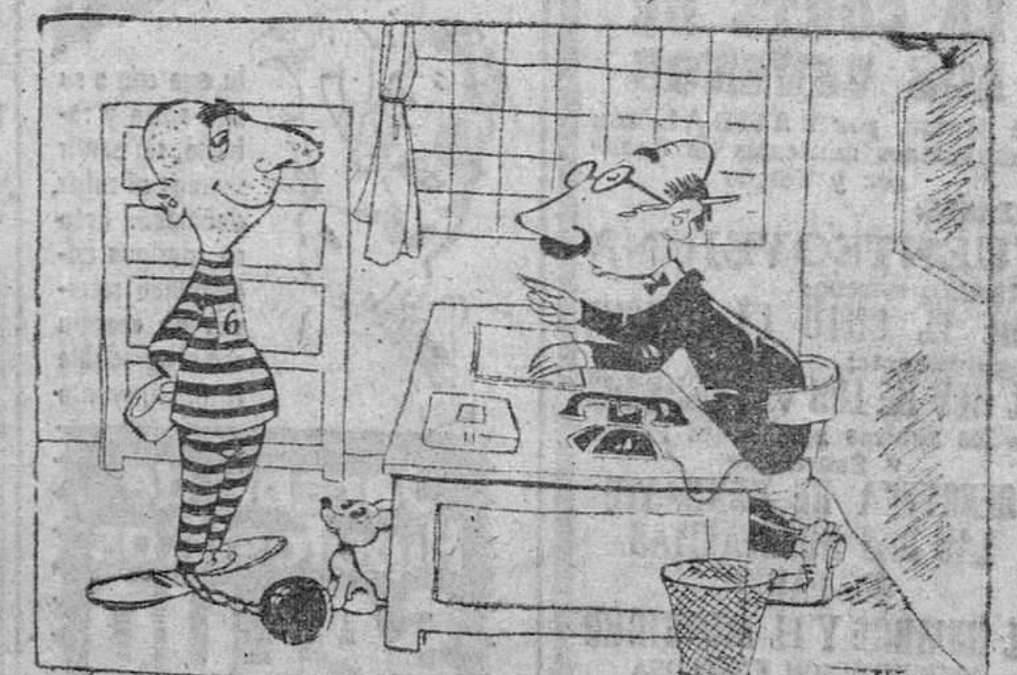
—Por su buen comportamiento, le autorizo a salir para comprar la lima que desca. Pero pronto aquí, ¿eh?