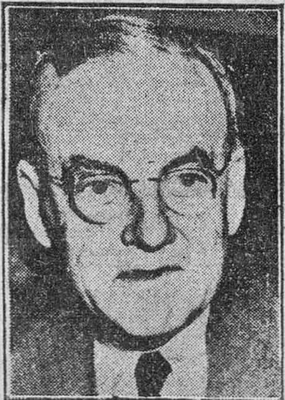
Foster Dulles, secretario de Estado norteamericano, que va a Corea a entrevistarse con el presidente Rhee y a preparar la conferencia política que ha de seguir al armisticio.