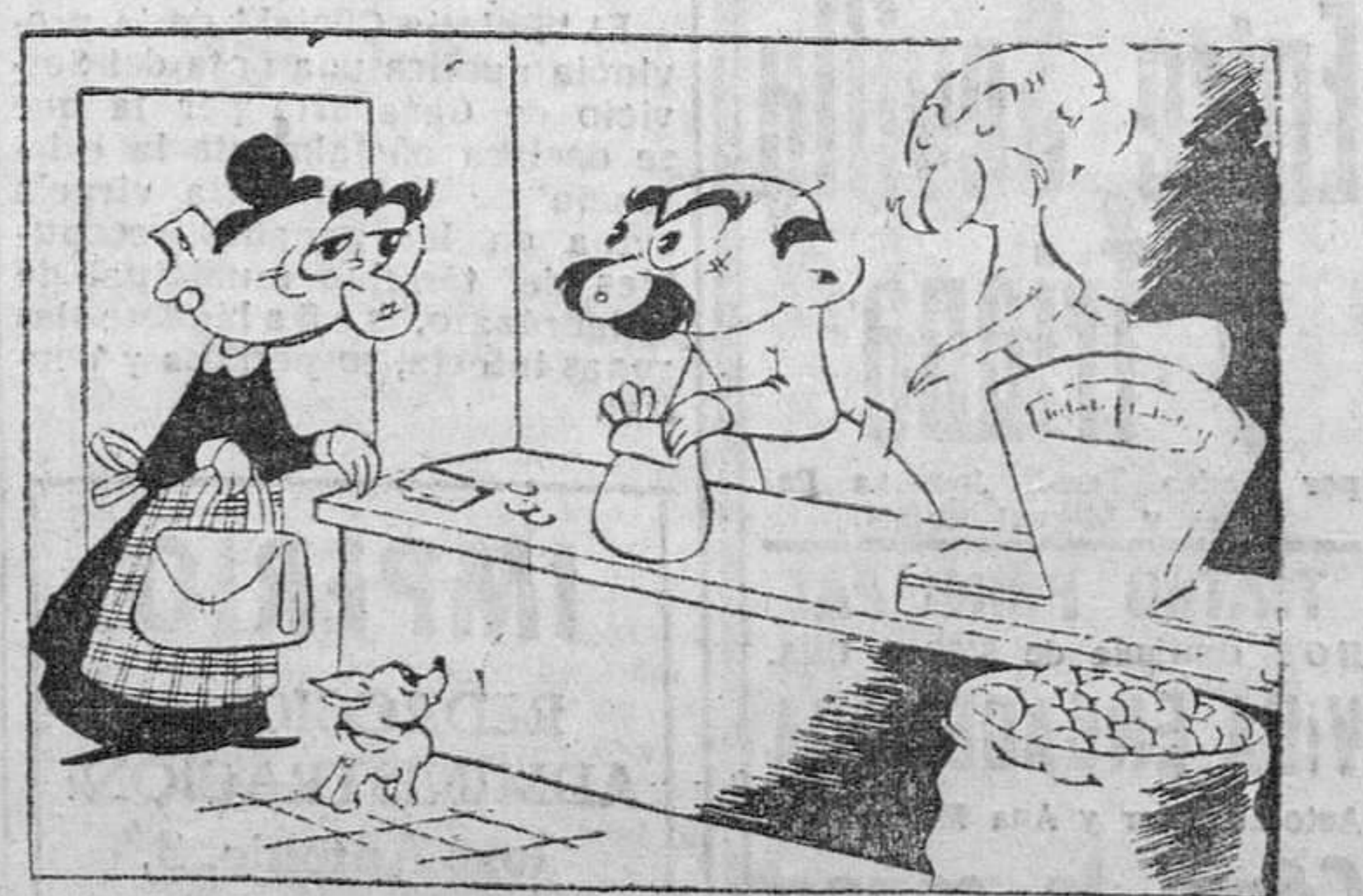
—Di a tu señora que la doy el kilo bien corrido... (La conciencia): —¡Vaya, ya le "plingue" trescientos gramos!