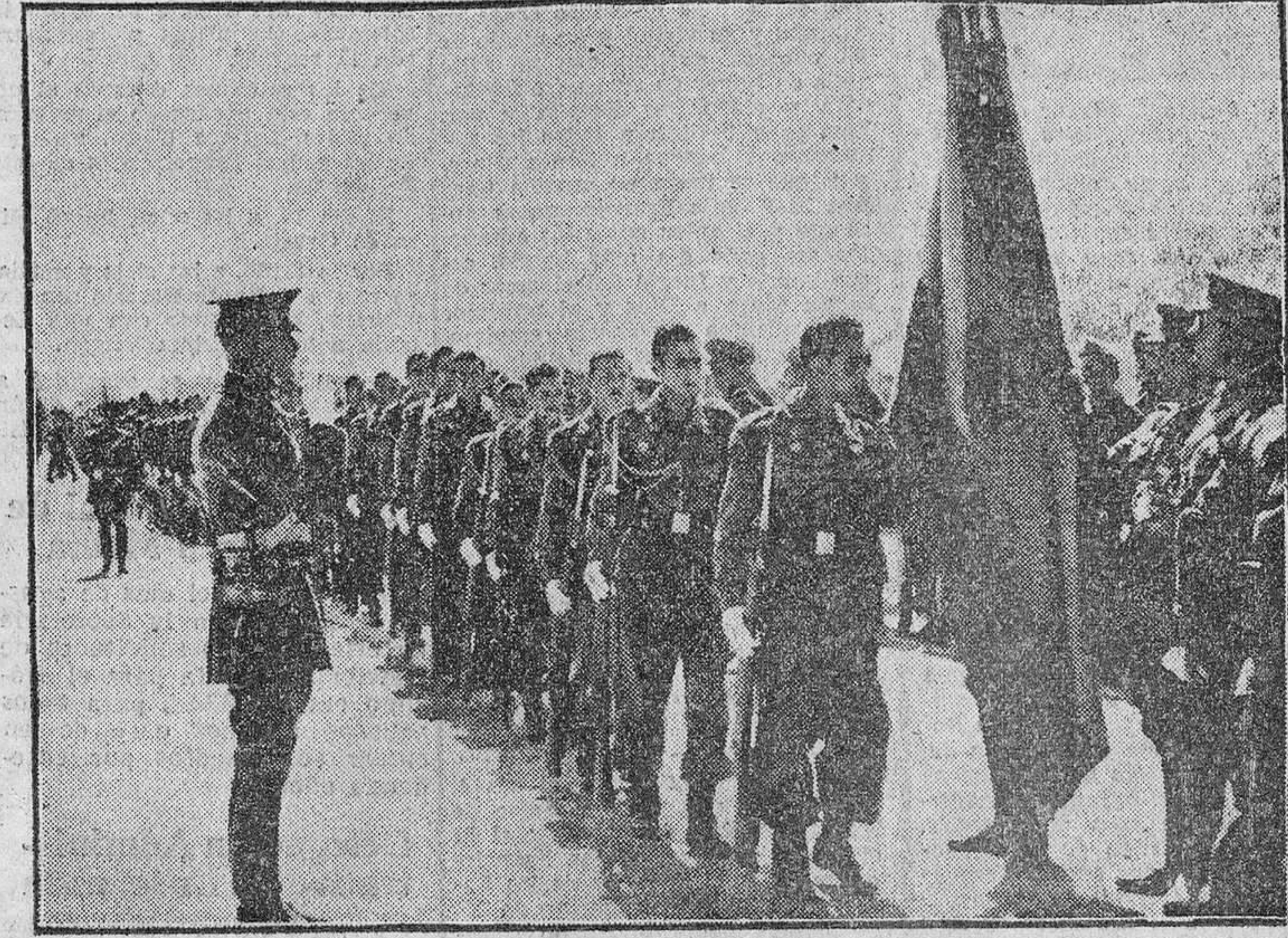
Los cadetes de la Milicia Universitaria, que siguen el curso en el Campamento de Monte la Reina, juraron ayer bandera. Nuestra foto recoge el momento en que los cadetes besan la enseña de la Patria. (VEA NUESTRA INFORMACION EN TERCERA PAGINA)