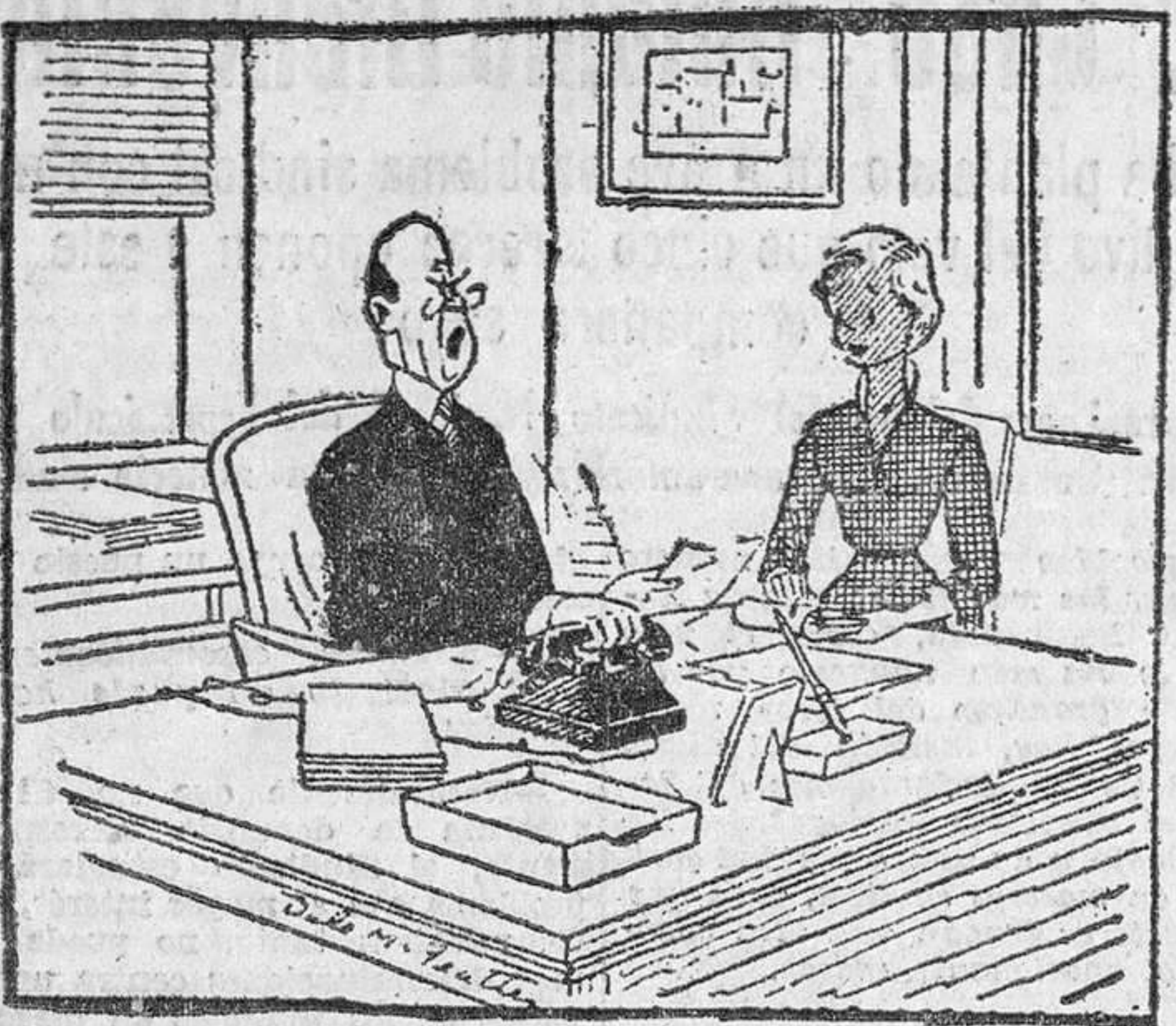
—Deben haberse equivocado, creyendo que esto era una pastelería... Preguntaban por "Dulce Bomboncito". (EPS-SB.)