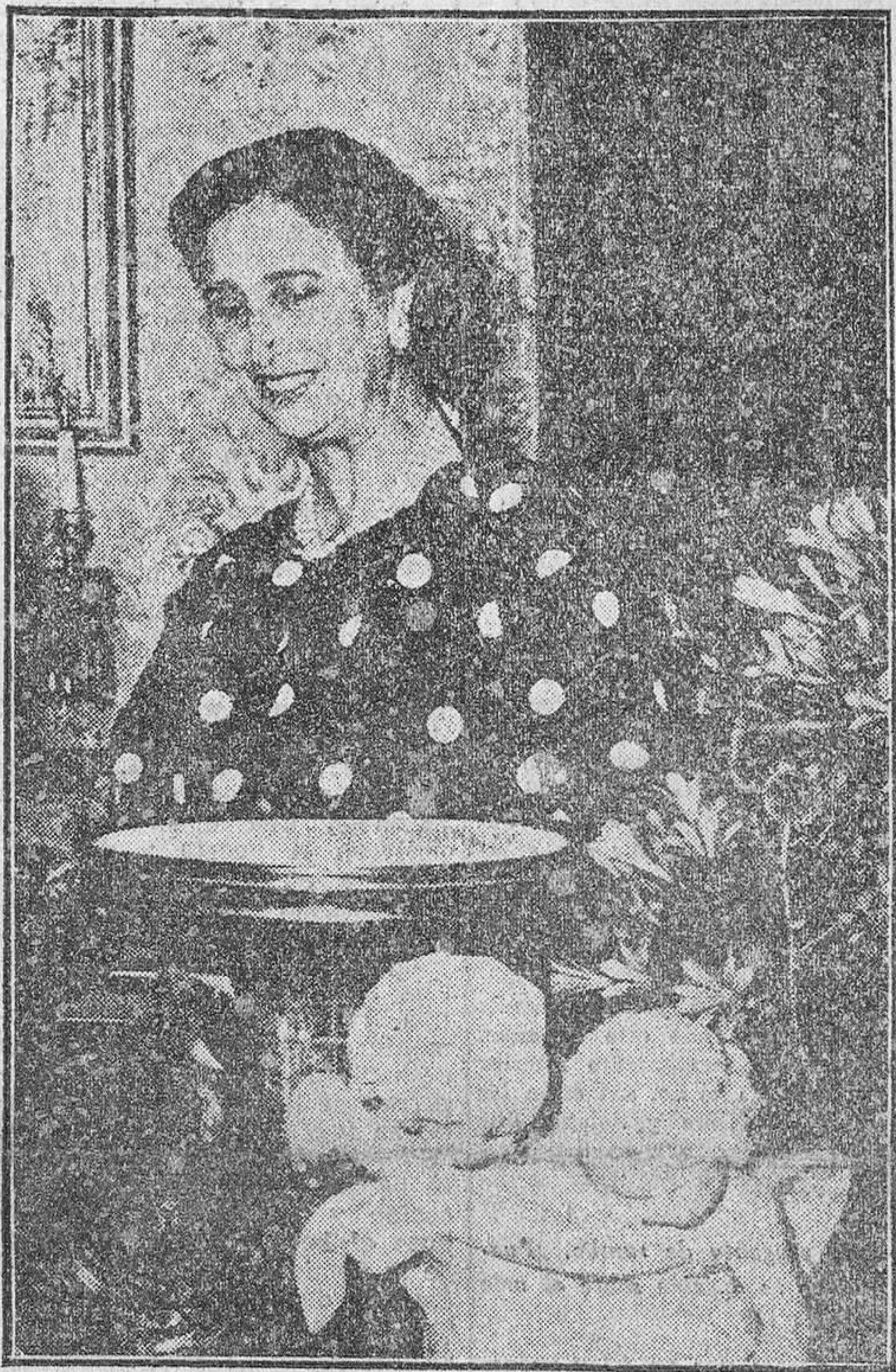
Excelentísima señora Doña Carmen Polo de Franco, que ha recibido, en Burgos, el título de Dama Noble de Castilla.

La esposa de S. E. recibió el título de DAMA NOBLE DE CASTILLA