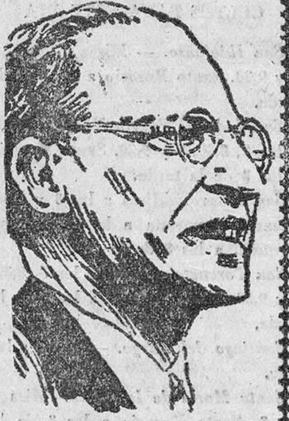
Alcide de Gasperi, jefe de la democracia social-cristiana, que ahora, después de ocho años de gobierno y del reciente y precario triunfo electoral, tiene en vilo su futuro político y el de su partido al negarle la confianza la Cámara de Diputados.

Roma, 28. (Urgente).—La votación de la Cámara de Diputados ha sido adversa al Gobierno, que se verá obligado a dimitir.—Efe.