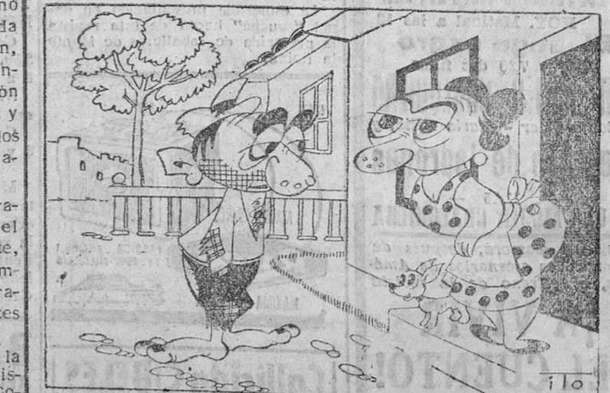
—Pero, ¿los zapatos que le di ayer? —Los vendí. Comprenderá la señora que estaban en muy buen uso para pedir limosna.