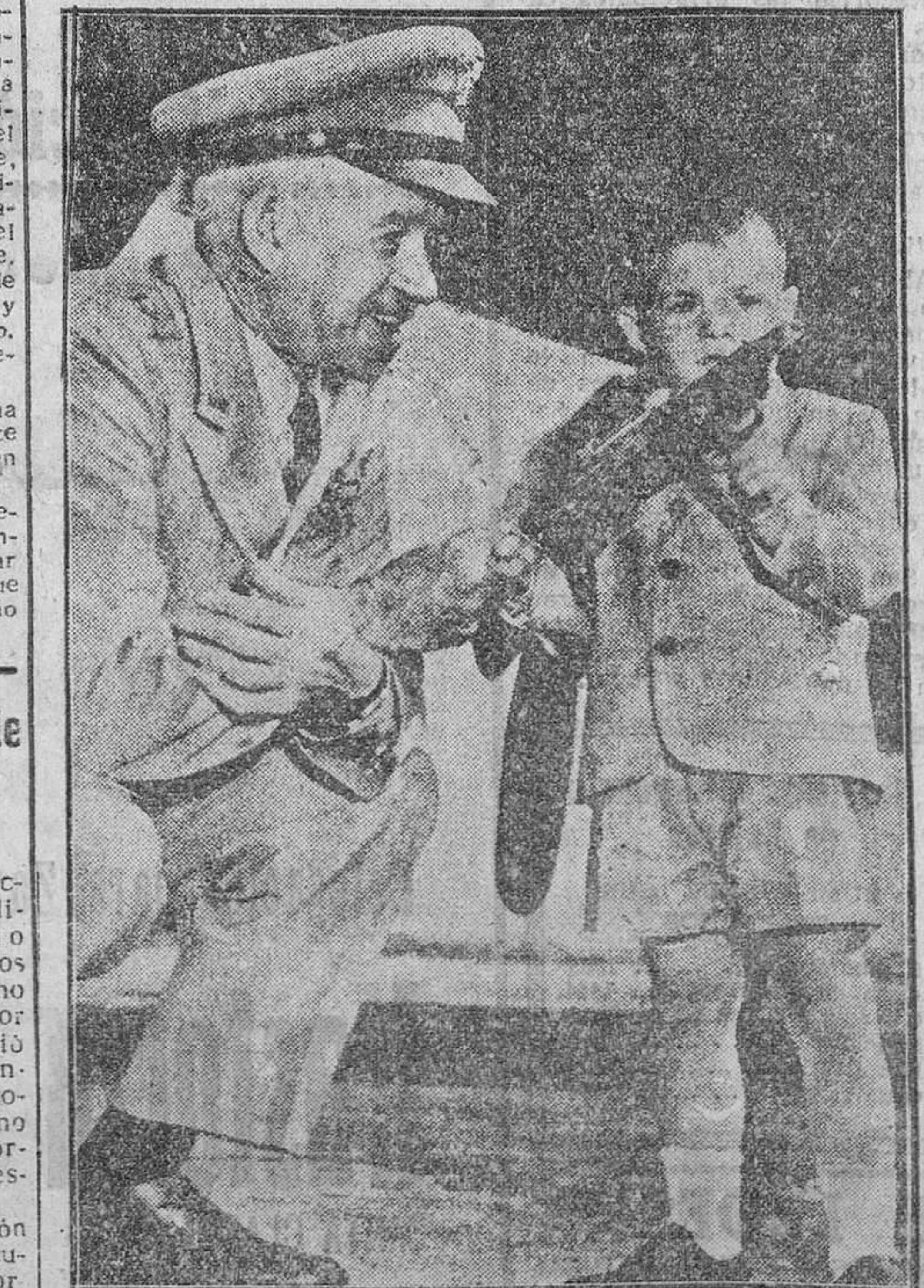
El general Ridgway, junto a sus hijos, que llegaron a Washington, tras sus padres al aeropuerto de Washington.