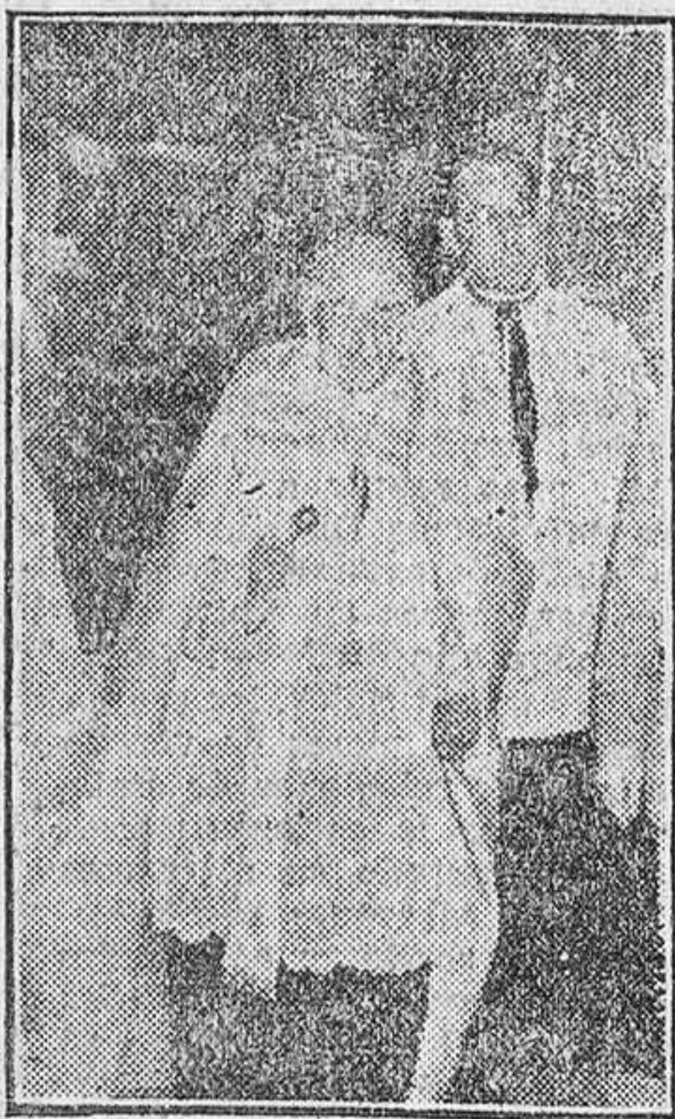
El Vicario Capitular bendiciendo el edificio.

Para utilización como residencia de enfermos están habilitadas siete plantas de las diez de que consta, servidas por la enfermera jefe de planta, cada una, y dos a su orden, cuyos puestos de observación se si-