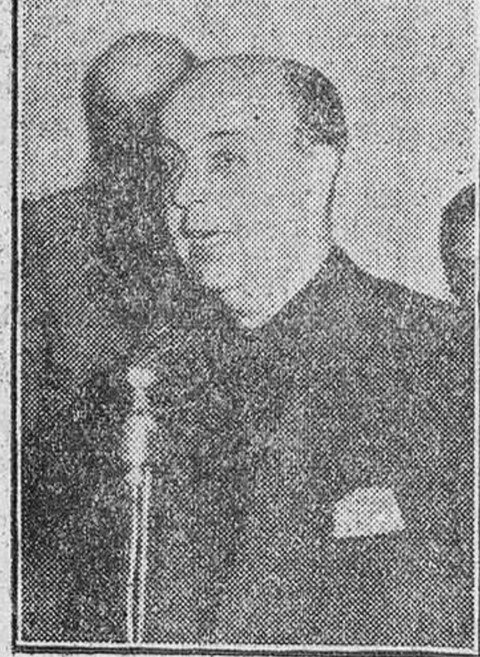
Los oradores que intervinieron en el acto inaugural.

A las siete de la tarde de ayer fué inaugurada la Residencia Sanatorial "Onesimo Redondo", del Seguro de Enfermedad, magnífico edificio de diez plantas y dotado de todo género de adelantos, que hacen de él modelo y última palabra en su género y fines específicos.