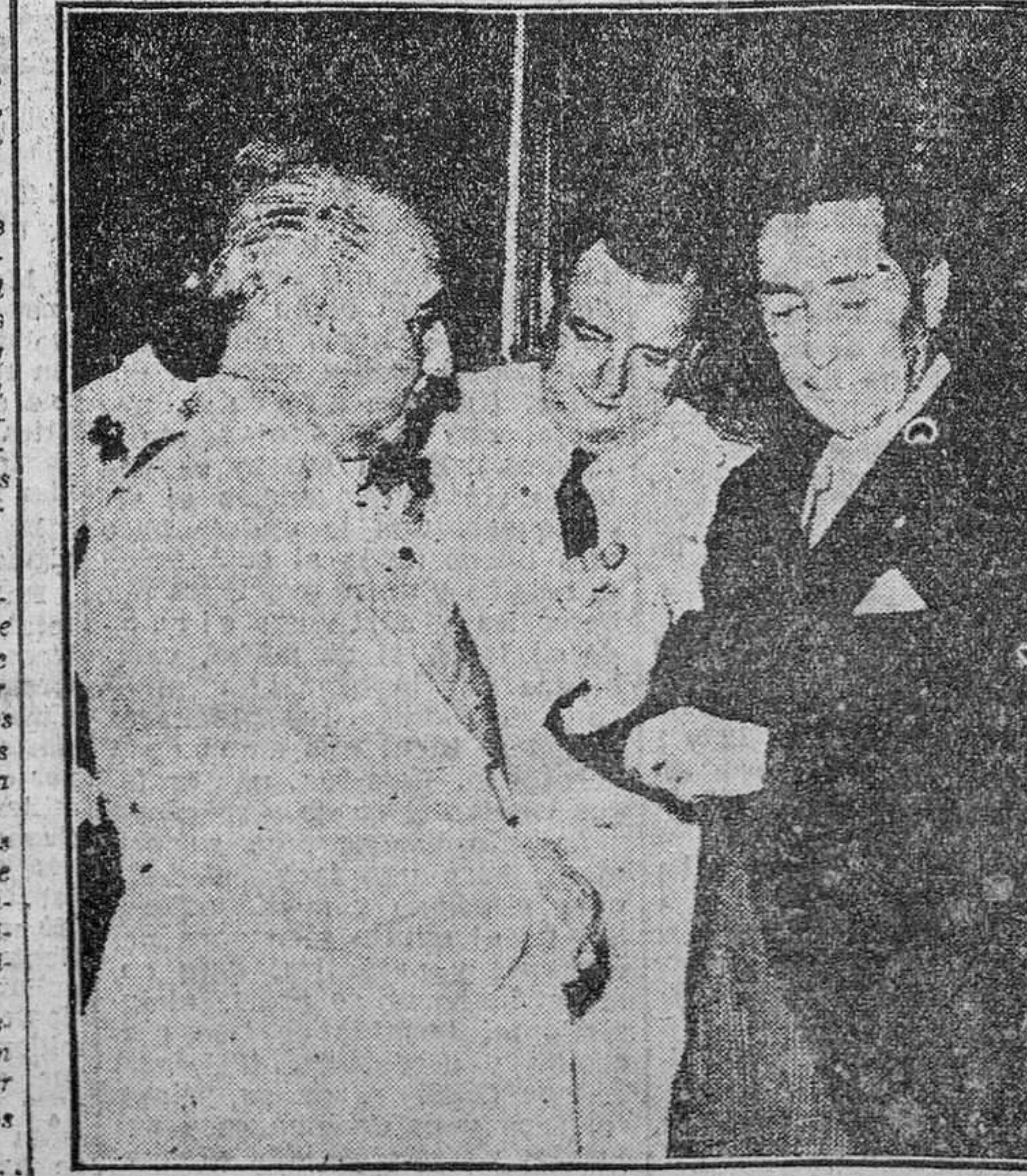
En el Palacio de El Pardo le ha sido impuesta a Su Excelencia el Jefe del Estado la Gran Cruz del Mérito Civil, que recientemente le fué concedida por el presidente de la Iraterna Republica del Ecuador. Asistieron al acto el embajador de aquel país, el ministro de Asuntos Exteriores y altos jefes de las Casas Militar y Civil.