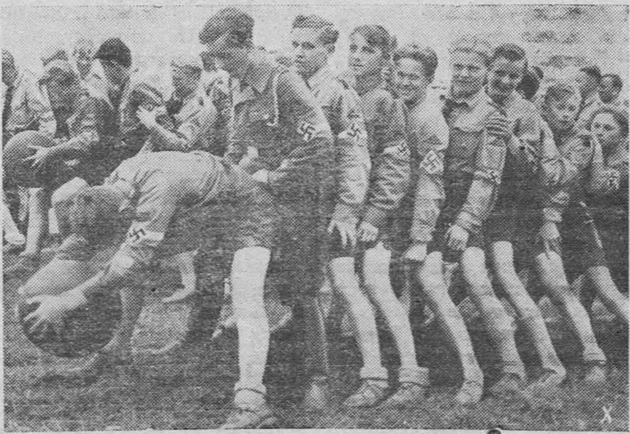
Para hacer generaciones sanas y fuertes, las juventudes alemanas practican toda clase de deportes.