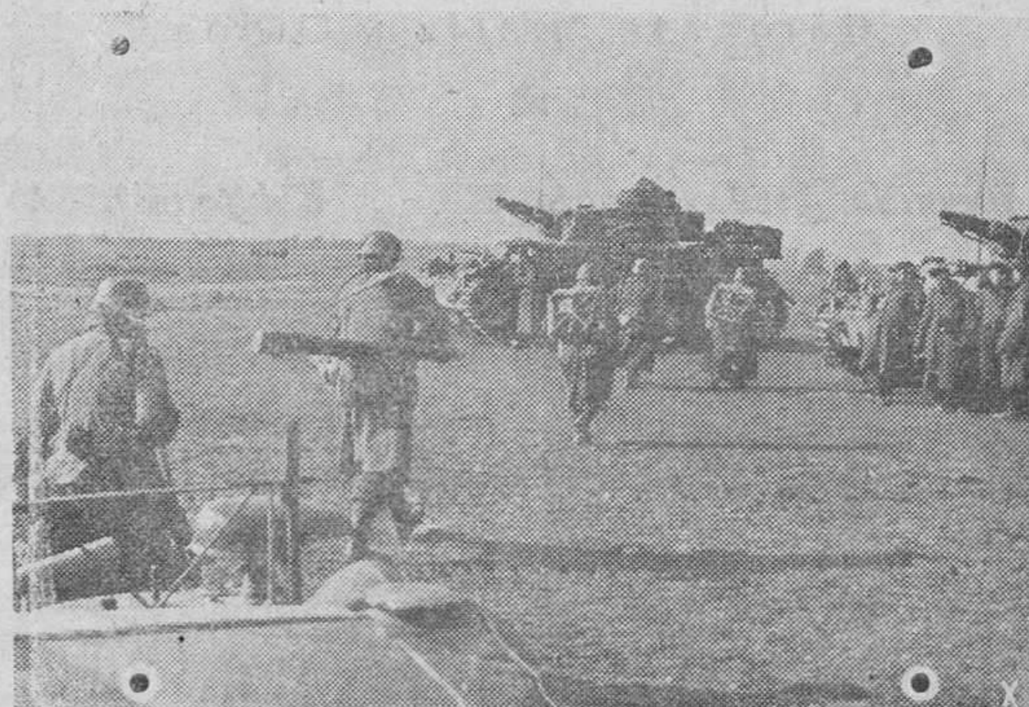
Los tanques alemanes avanzan mientras la infantería limpia el espacio acabado de conquistar.