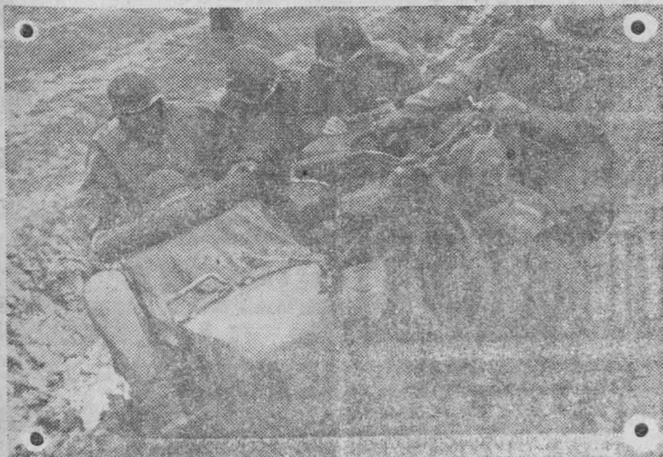
Soldados alemanes sacando su máquina del barro en una carretera rusa.