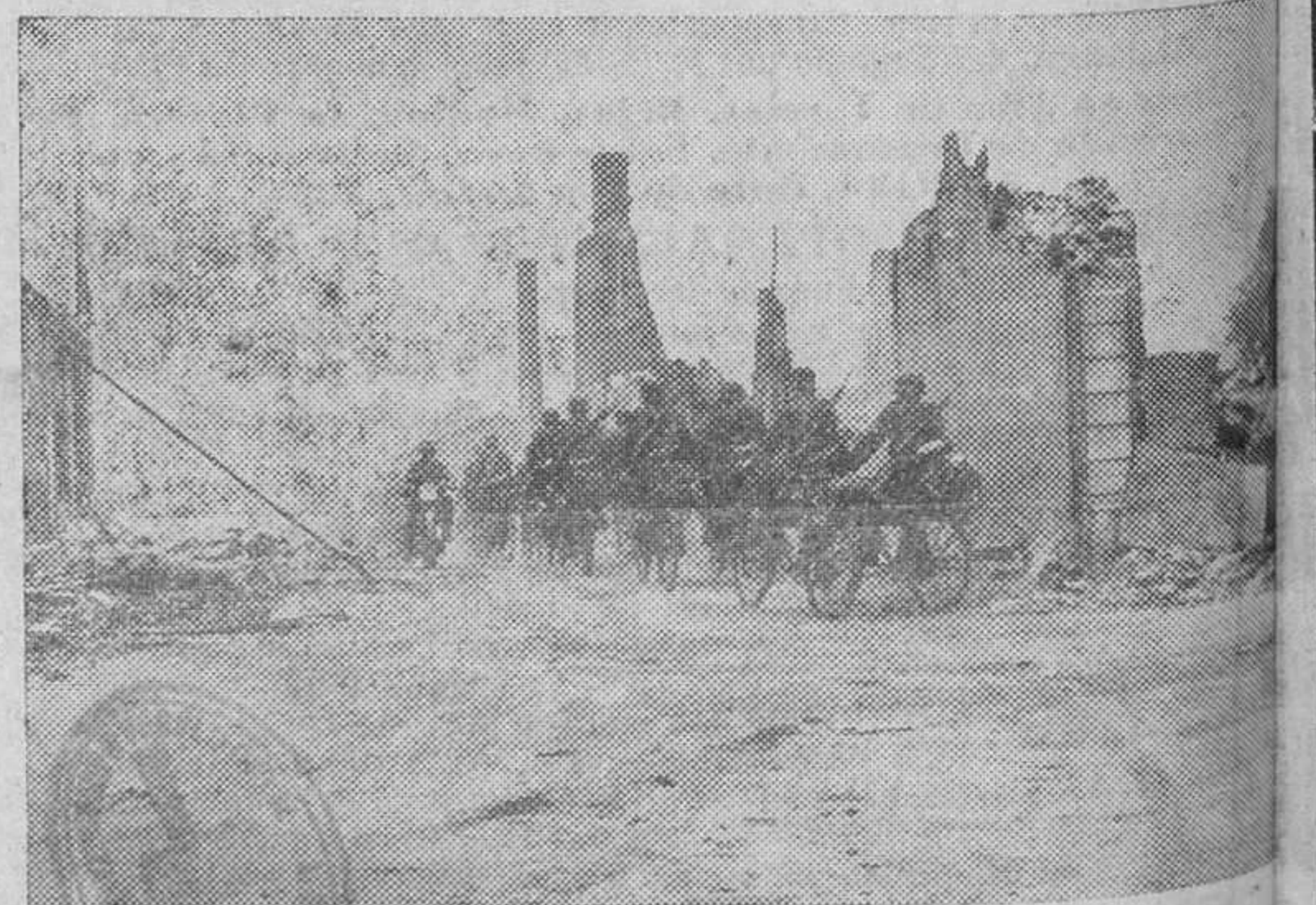
Ciclistas del ejército alemán en marcha hacia la primera línea