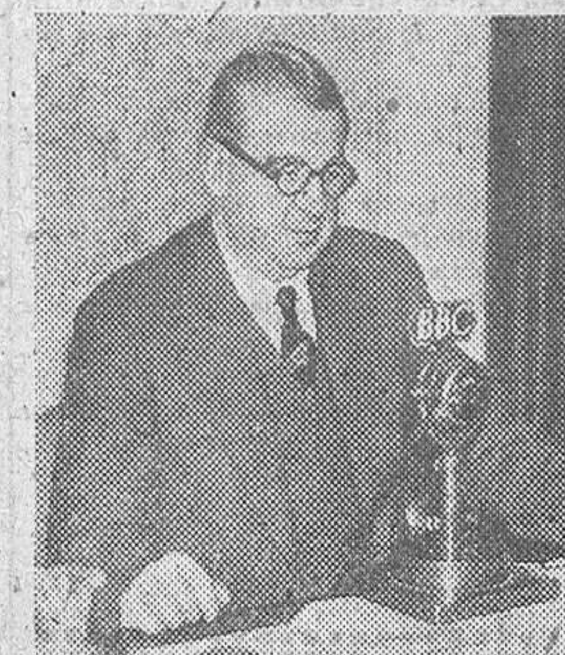
El muy honorable sir Ben Smith, K. B. E., ministro de Alimentación, fotografiado durante su importante discurso dirigido a la nación el día 5 de febrero del año actual

Sultaneh declara que lo estipulado hace innecesaria toda discusión de la disputa en la O. N. U.