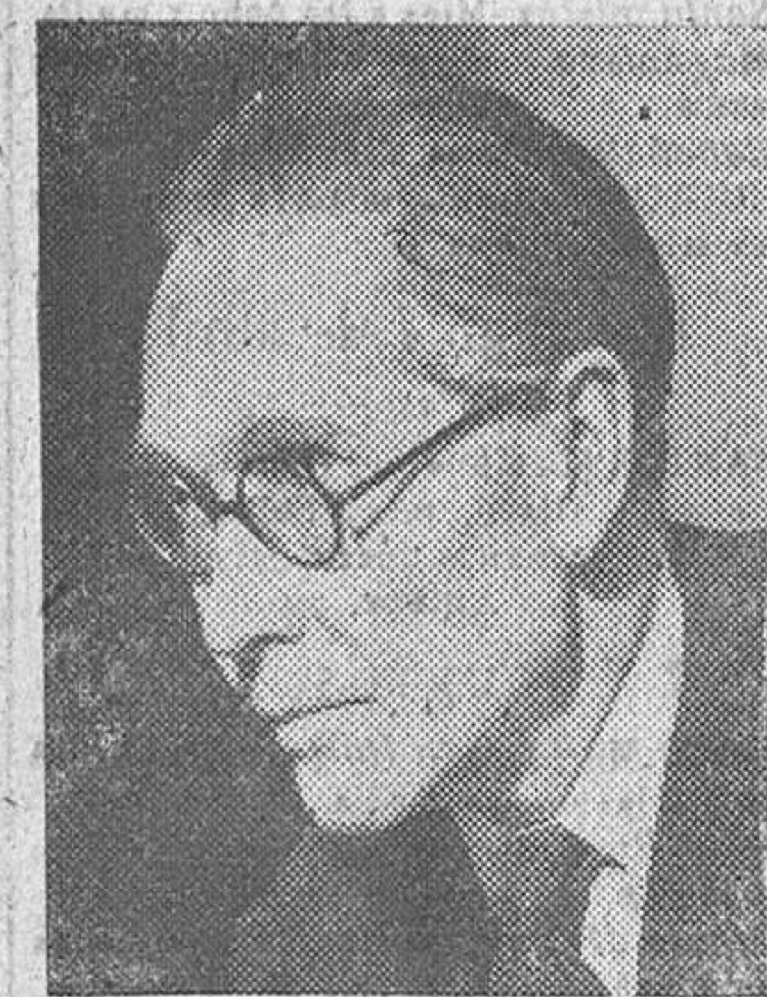
El Muy Honorab'e Philip Noel-Baker, M. P., Ministro de Estado.