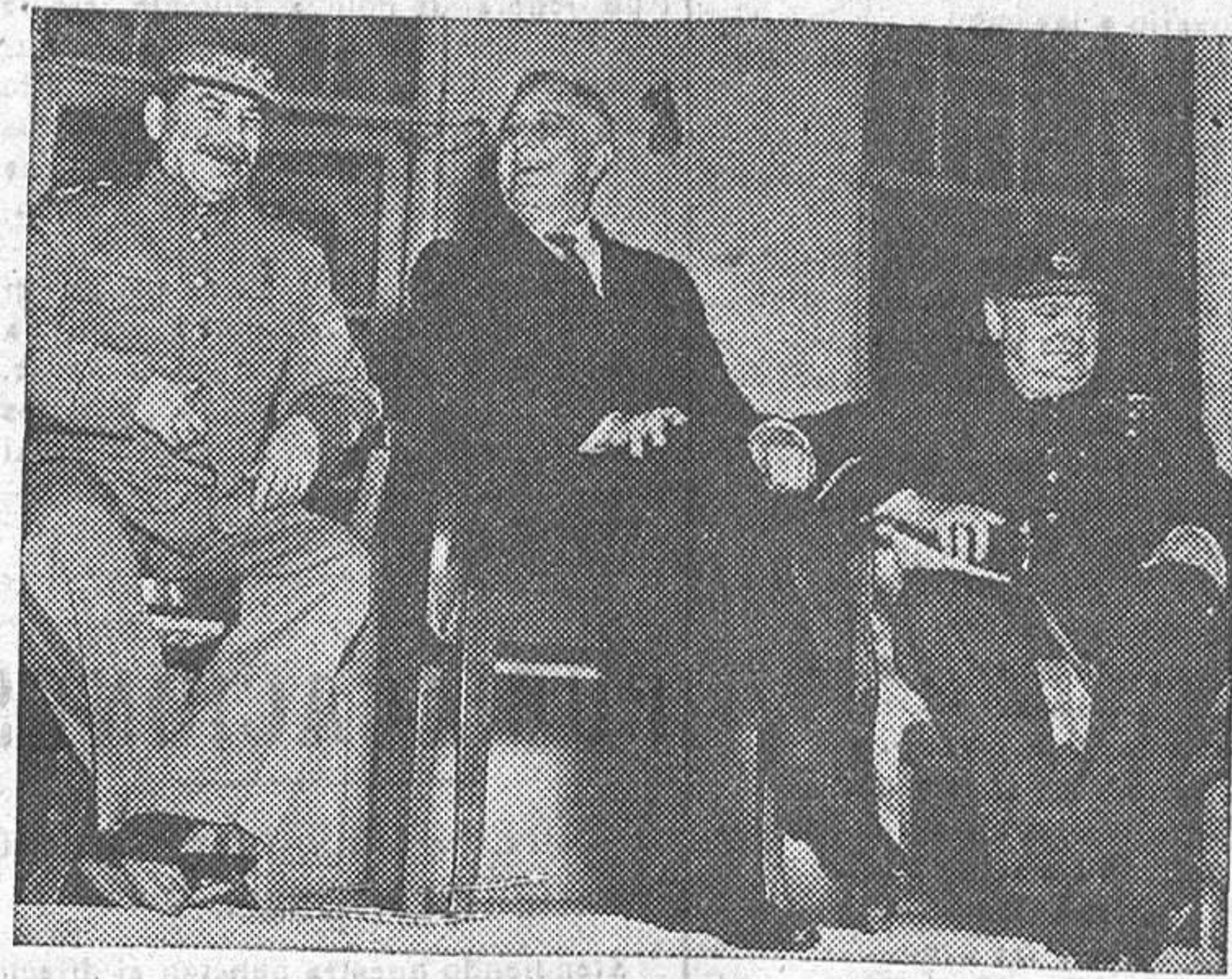
Stalin, con Churchill y el fallecido presidente Roosevelt, durante la conferencia de Teherán

El mariscal soviético valora como un acto peligroso el discurso del ex-premier británico